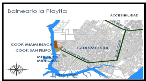
Figura 2. Rutas principales como llegar al atractivo

2.1.4. Entorno Natural. La playita del Guasmo posee 20260 m 2 total del área recreativa y playa, con una altura de 2m.s.n.m. Y con una temperatura que varía entre los 24 -30° C, y una precipitación ANUAL entre los 500-1000 mm, según fuentes del INOCAR (Instituto Oceanográfico de la Armada del Ecuador) Este lugar posee una gran riqueza en Flora y Fauna por las cercanías del río Guayas y del Estero, que da como consecuencia la presencia de gran cantidad de aves, peces y plantas.