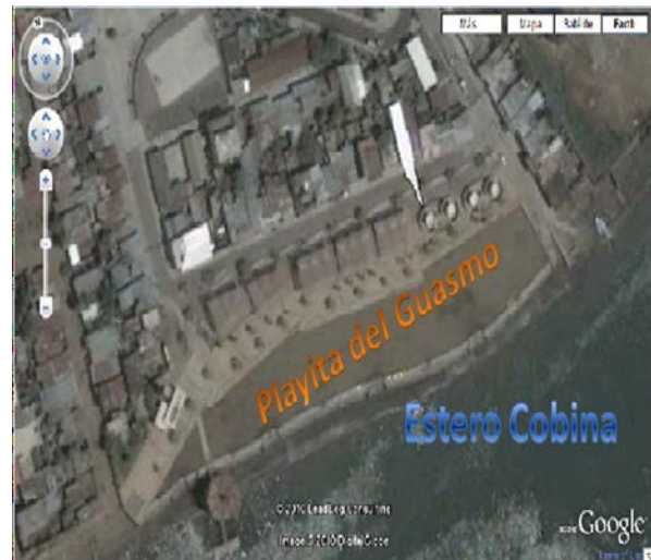
Figura 1. La playita del guasmo

2.1.3. Medios de Acceso. Para la creación de este proyecto también se conto con el embellecimiento paisajístico del corredor turístico que hay para acceder al Centro Recreacional, es decir pavimentación de sus calles, adoquines, parqueos públicos, señalización de sus avenidas, casas pintorescas. Como obras complementarias las manzanas adyacentes al proyecto, cooperativas San Filipo y Dique Amazonas, son intervenidas de manera similar a la de los “Barrios de Excelencia”, adecentando las fachadas de 455 viviendas y con la construcción de aceras, bordillos y áreas verdes.