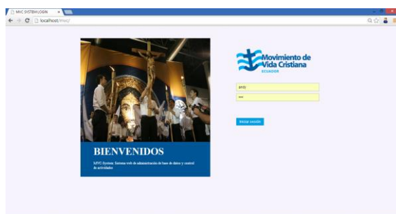
Ilustración 1. Inicio de sesión al sistema

Para ingresar al sistema, la persona deberá autenticarse con el usuario y contraseña tal cual se muestra en la Ilustración 1. De acuerdo al cargo que desempeñe la persona dentro del MVC, se presentarán las pestañas habilitadas a dicho cargo.