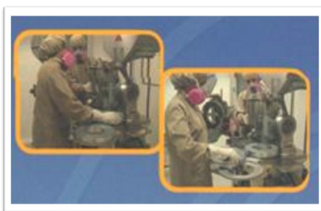
Grafico 2.8: Planta Farmayala Área de Compresión.

Elaborado por: FARMAYALA S.A.