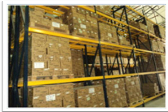
Grafico 2.17: Planta Parmayala Área de Bodega Central

Fuente: Corporación Farmayala Pharmaceutical Company S.A. Galería 2012. Elaborado por: FARMAYALA S.A.