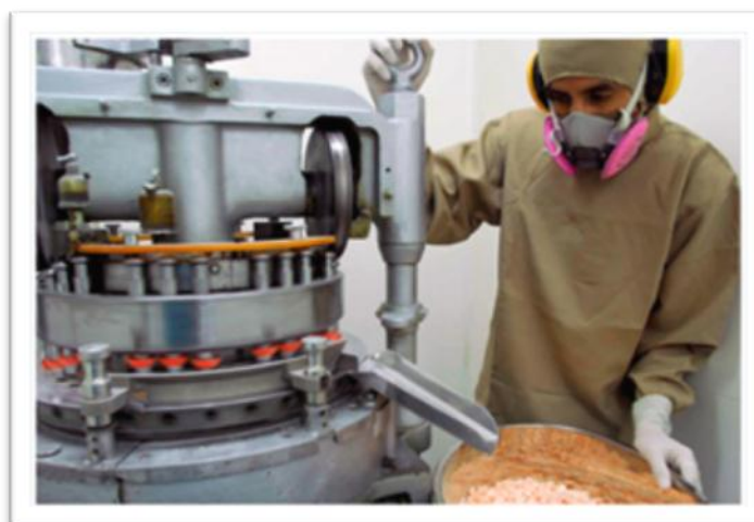
Grafico 2.7: Planta Farmayala Área de Producción de Sólidos 'Mezclador V Blender'.

Fuente: Corporación Farmayala Pharmaceutical Company S.A. Galería 2012. Elaborado por: FARMAYALA S.A.