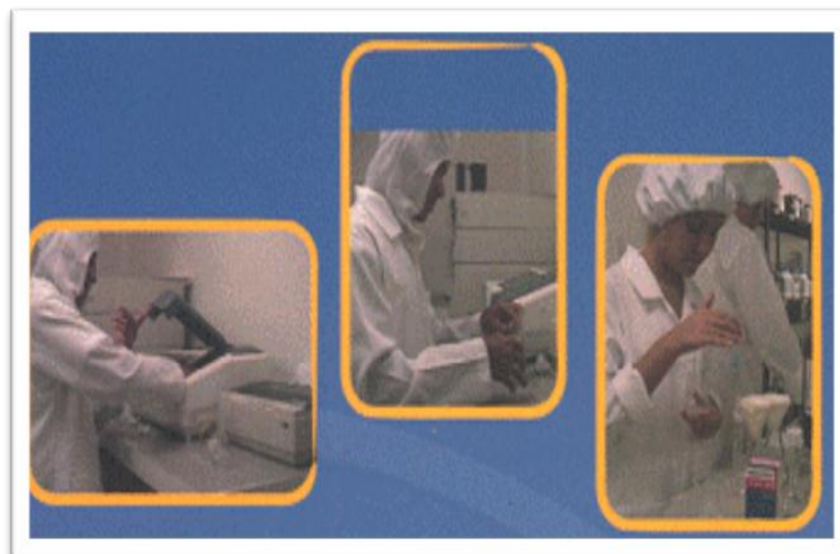
Grafico 2.4: Planta Farmayala Laboratorio de Calidad.