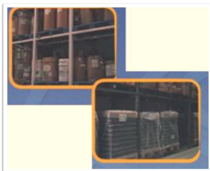
Grafico 2.5: Planta Farmayala Bodegas de Materia Prima.