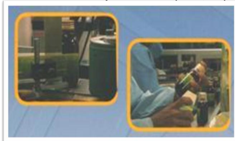
Grafico 2.14: Planta Parmayala Área de Líquidos, Etiquetado.