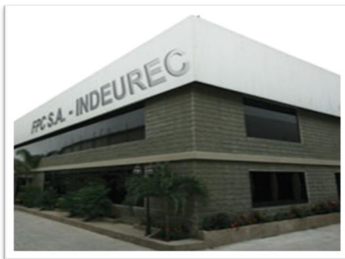
Gráfico 2.2: Planta INDEUREC.