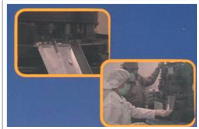
Grafico 2.9: Planta Farmayala Área de Encapsulado.

Fuente: Corporación Farmayala Pharmaceutical Company S.A. Galería 2012. Elaborado por: FARMAYALA S.A.