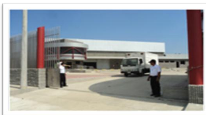
Gráfico 2.3: Planta Parmayala.