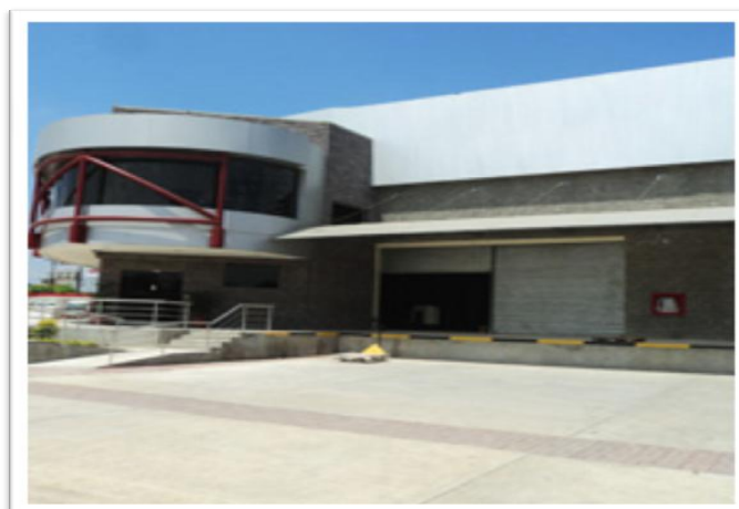
Grafico 2.16: Planta Parmayala Área de Bodega de Despacho

Fuente: Corporación Farmayala Pharmaceutical Company S.A. Galería 2012. Elaborado por: FARMAYALA S.A.