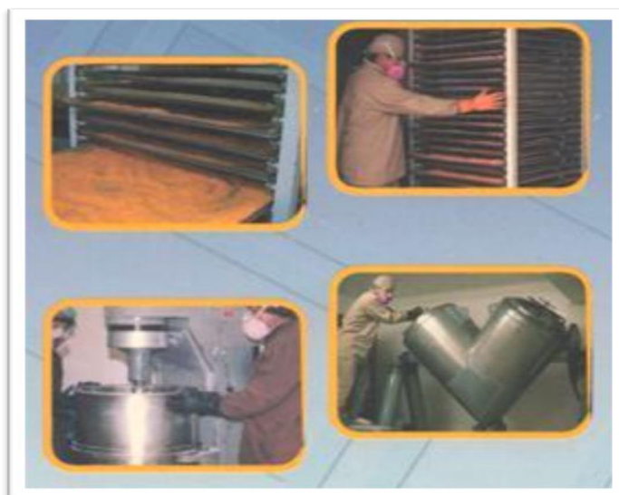
Grafico 2.6: Planta Farmayala Área de Producción de Sólidos.