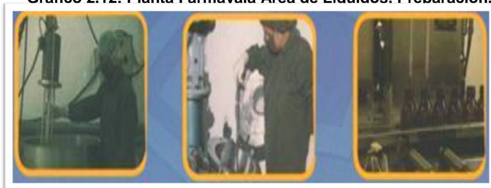
Grafico 2.12: Planta Farmavala Área de Líquidos. Preparación.

Fuente: Corporación Farmayala Pharmaceutical Company S.A. Galería 2012. Elaborado por: FARMAYALA S.A.