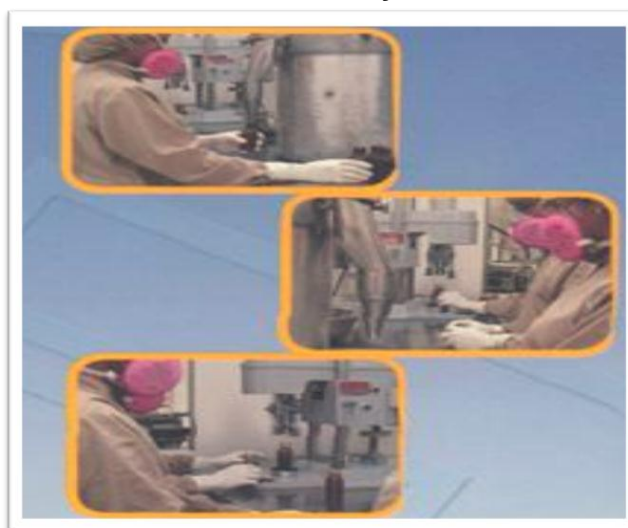
Grafico 2.10: Planta Farmayala Área de Envasado.