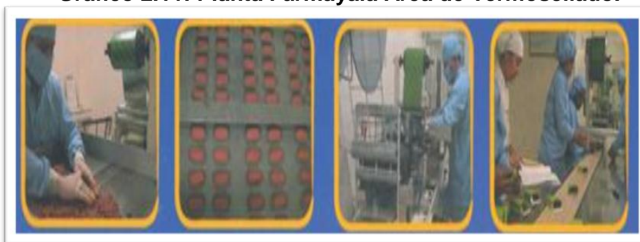
Grafico 2.11: Planta Farmayala Área de Termosellado.

Fuente: Corporación Farmayala Pharmaceutical Company S.A. Galería 2012. Elaborado por: FARMAYALA S.A.