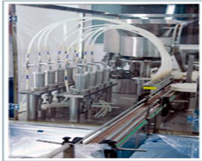
Grafico 2.15: Planta Parmayala Área de Líquidos, Codificación.