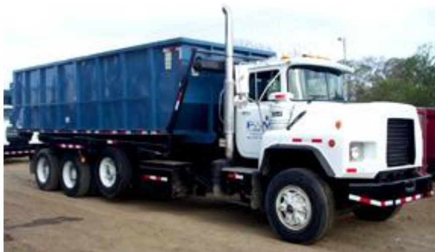
Fig. 1.16. VEHICULO ROLL-ON

Para la recolección de desechos en industrias de alta generación, se utilizan los mismos tracto-camiones marca International modelo 7600 6X4, con motor Caterpillar C-10 y una unidad de carga modelo CRO-60, marca Chagnon, con capacidad de 60,000 Lbs., la misma que permite la elevación del sobre-chassis mediante dos cilindros hidráulicos situados a cada lado del vehículo, y asimismo, mediante un sistema de poleas y cilindros hidráulicos, produce un movimiento longitudinal de un gancho y un estrobo, que permite subir y bajar un contenedor de 25 m 3 , con una capacidad de hasta 25 Tons.