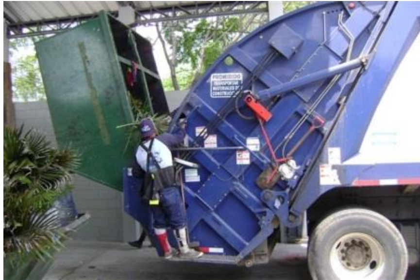
Fig. 1.7. RECOLECTOR LEVANTANDO UN CONT. DE 4m 3 .

Para cada uno de los tres métodos de recolección mencionados, la recolección con un vehículo recolector, el barrido de calles que se realiza con carretilla y herramientas manuales y la recolección en industrias utilizando contenedores, los operarios cuentan con sus respectivos equipos de protección personal, de tal forma que, la empresa y los empleados cumplan con las normas y procedimientos de seguridad, higiene y salud ocupacional exigidos en el contrato.