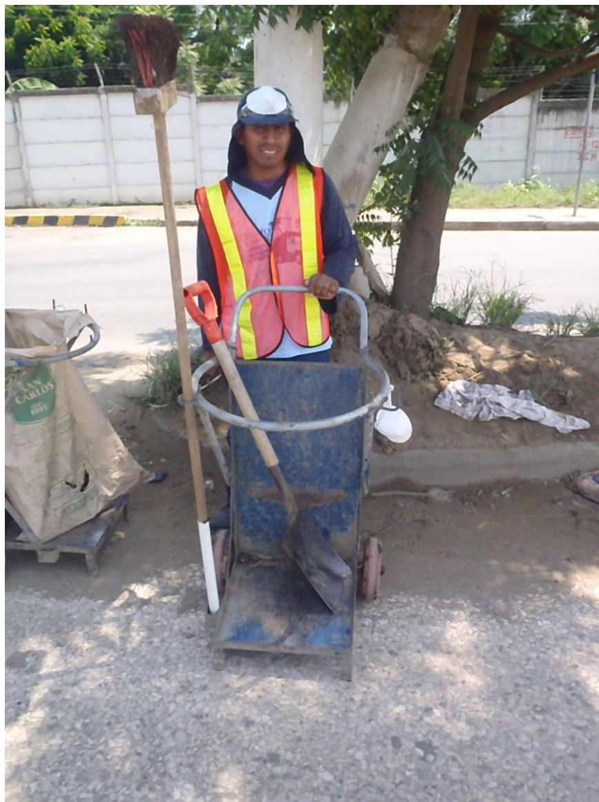
Fig. 1.5. CARRETILLERO CON SU EQUIPO COMPLETO