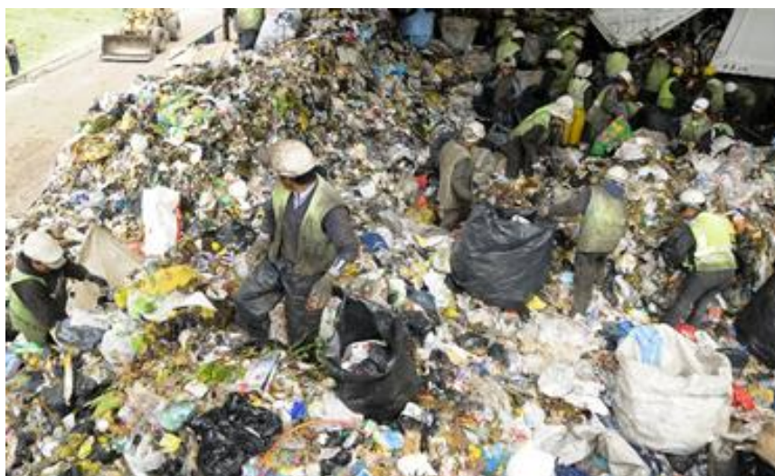
Fig. 1.12. TERMINAL DE TRANSFERENCIA ET-1

Como se observa en la figura 1.12., la estación de transferencia 1 (ET-1), tiene un área de 15.000 m 2 aproximadamente, dentro de la cual existen pendientes y desniveles que dificultan la operación interna. Previo al ingreso de los recolectores de carga trasera a descargar los desechos, éstos deben ser sometidos a un proceso de pesaje, para determinar el volumen de basura transportado, valor que se obtiene por diferencia, al momento de pesar al mismo vehículo a la salida.