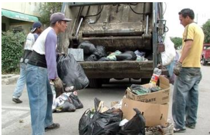
Fig. 1.2. RECOLECTOR CON BASURA EN LA TOLVA.