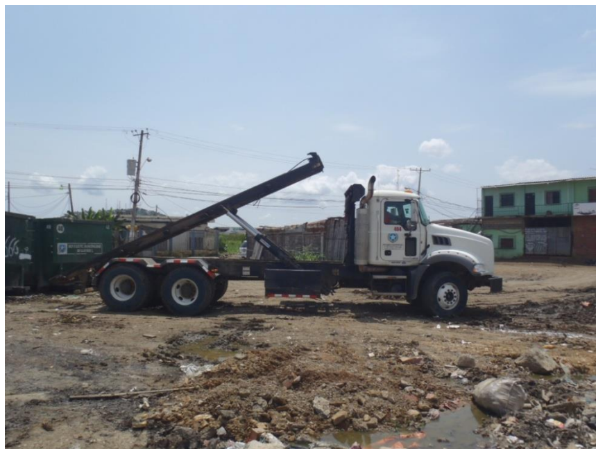
Fig. 1.9. ROLL- ON LEVANTANDO CONTENEDOR DE 25m 3 .