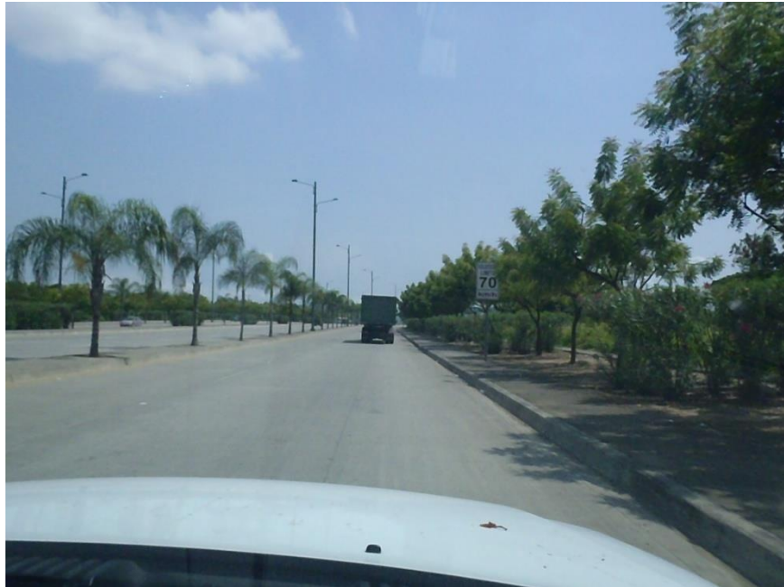
Fig. 1.4. SACOS LLENOS CON BASURA

Cada carretillero tiene un recorrido aproximado de 3 kilómetros diarios, dentro del cual recoge aproximadamente 1,000 Kgs. de basura, utilizando como herramientas una escoba, una pala, un machete y los sacos, como se observa en la figura 1.5.