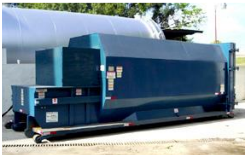
Fig. 1.11. COMPACTADOR ESTACIONARIO.

Como se observa en la figura 1.11, estos mismos contenedores o cajas Roll-on, se pueden utilizar con una pequeña modificación, que permite que sean acoplados a un compactador estacionario de pared móvil, optimizando el almacenamiento de basura, y aprovechando el máximo espacio y capacidad de cada contenedor, al compactar la basura dentro de la misma.