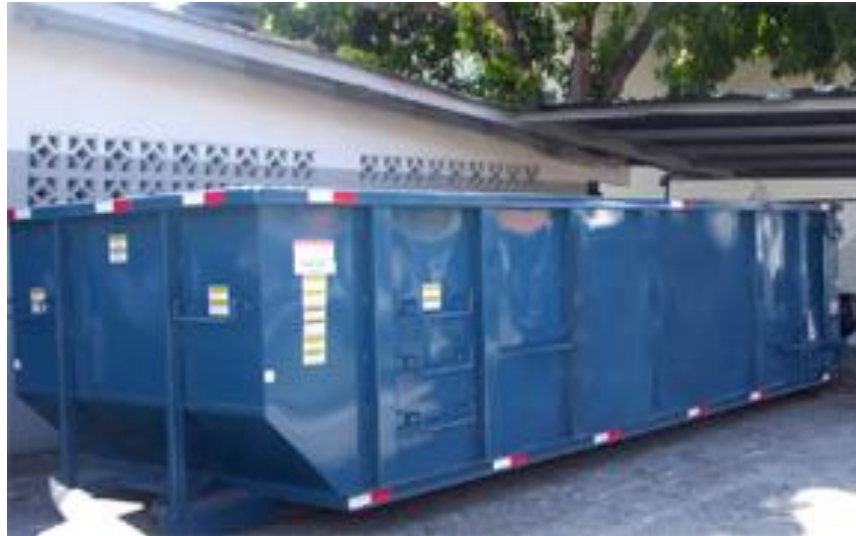
Fig. 1.8. CONTENEDOR DE 25m 3 .

tipo Roll-on, los cuales pueden manipular contenedores con capacidad de hasta 25 m 3 , (figuras 1.8., 1.9. y 1.10.) que soportan un peso máximo de 25 Tons.