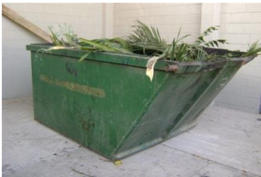
Fig. 1.14. CONTENEDOR DE 4M 3 .