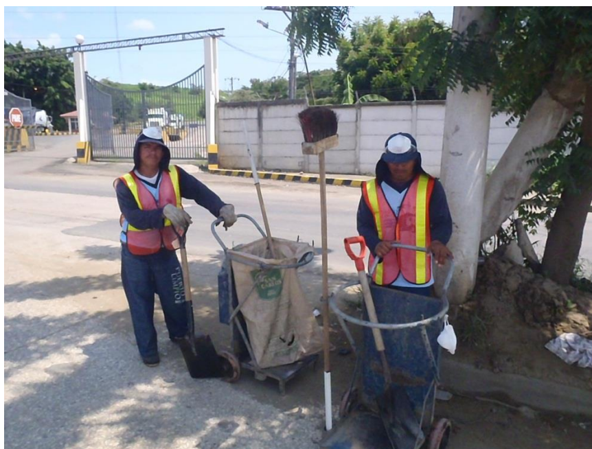
Fig. 1.15. CARRETILLAS PARA RECOLECCION EN LA CALLE

El barrido se lo realiza con una escoba, un recogedor y un machete, los desechos y material recogido en las cunetas y aceras, se depositan en un saco, que se soporta en un aro fijo a las carretillas metálicas de 2 ruedas, como se aprecia en la figura 1.15., estos sacos son recogidos posteriormente por los recolectores de carga trasera, durante sus recorridos diarios.