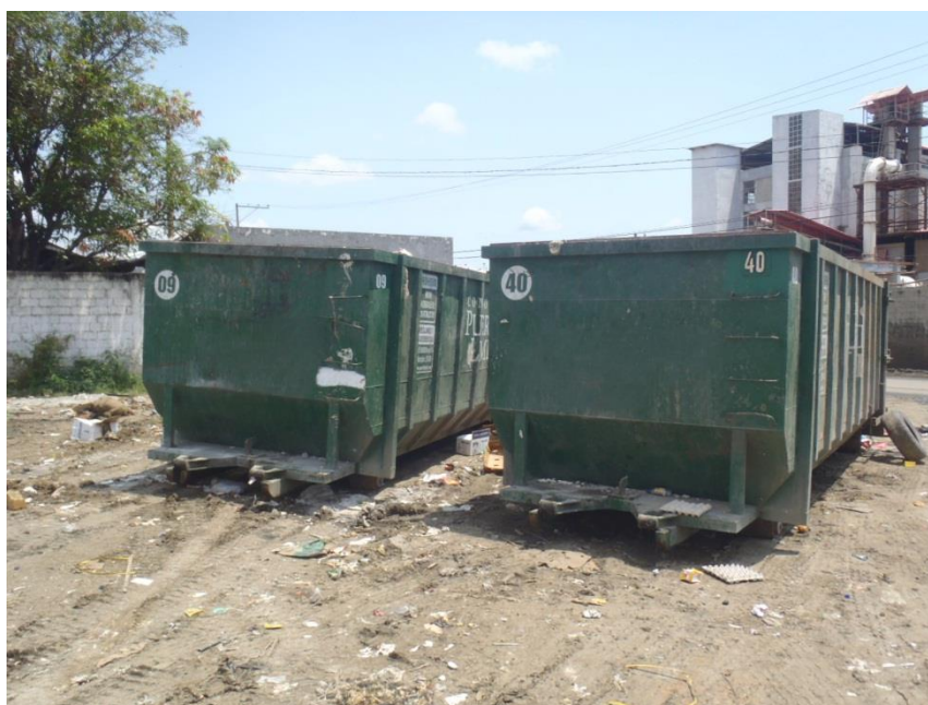
Fig. 1.17. CONTENEDOR DE 25 M 3 .

descansa sobre 4 ruedas de 8 plgs. de diámetro. En la parte inferior tiene 2 patines a todo lo largo del contenedor, que permiten la operación de carga con el sistema Roll-on de las unidades antes mencionadas, como se aprecia en las figuras 1.16. y 1.17.