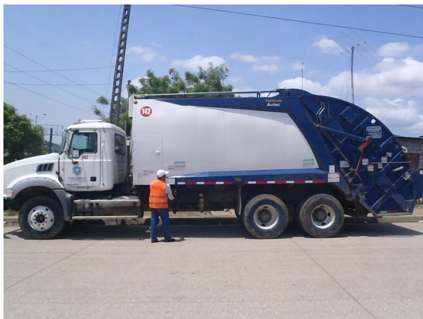
Fig. 1.13. RECOLECTOR DE 25 YDS 3 .