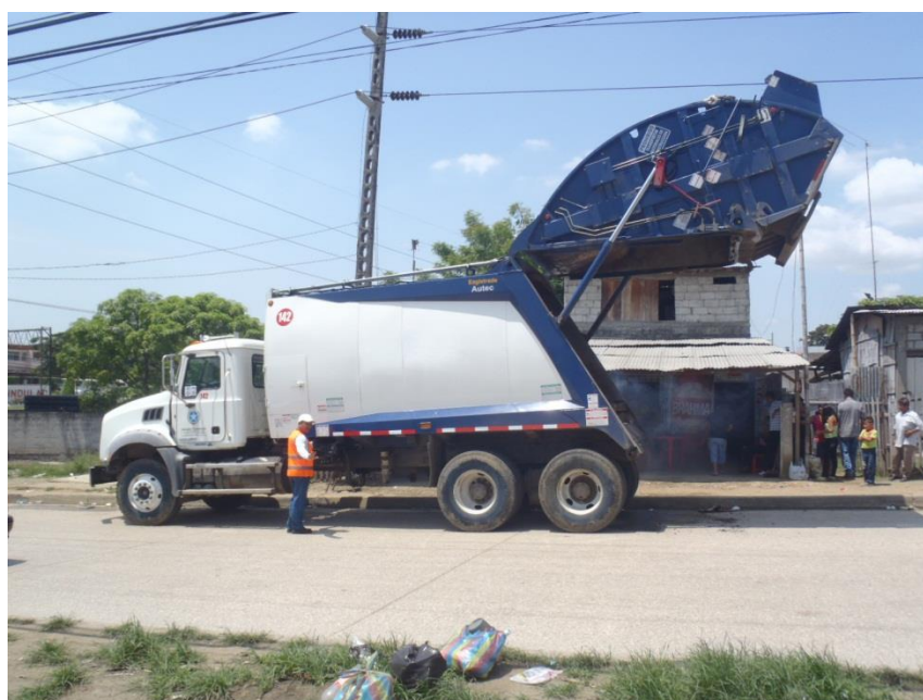
Fig. 1.3. RECOLECTOR CON LA TOLVA LEVANTADA.