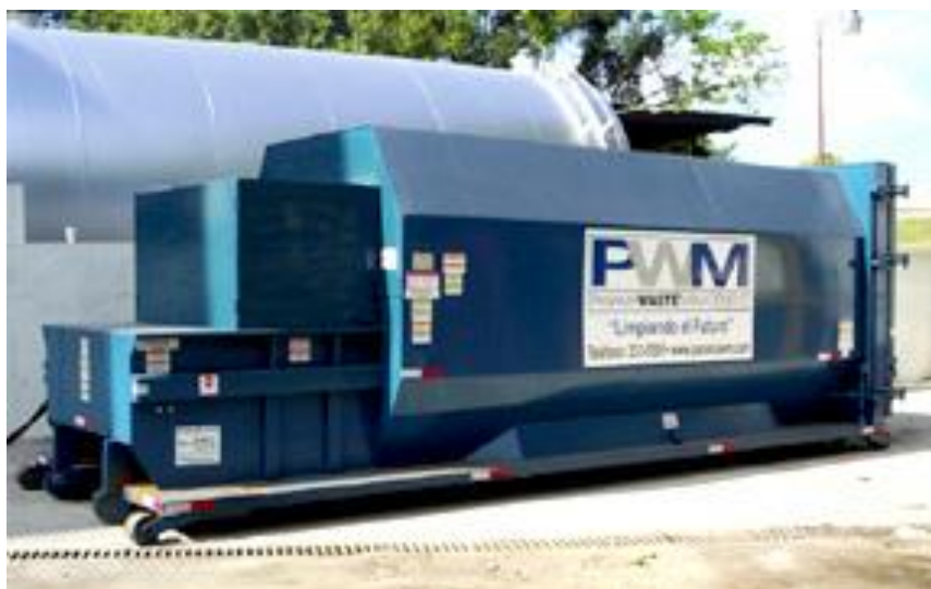
Fig. 2.1. COMPACTADOR ESTACIONARIO CON SU CAJA.

La capacidad instalada de vehículos tipo Roll-on, con los que contaba la compañía, estaba a su máxima ocupación, adicionalmente, por lo estipulado en el contrato de prestación del servicio de recolección de basura, no se podía desviar estos vehículos a otra operación que no sea la de recolección de desechos en la industria o puntos de alta generación de desperdicios