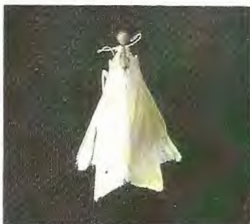
Fig. 1.8 Adulto de Diatraea Saccharalis

Diatraea Saccharalis (Fabr., 1794) (Lepidoptera: Pyralidae)