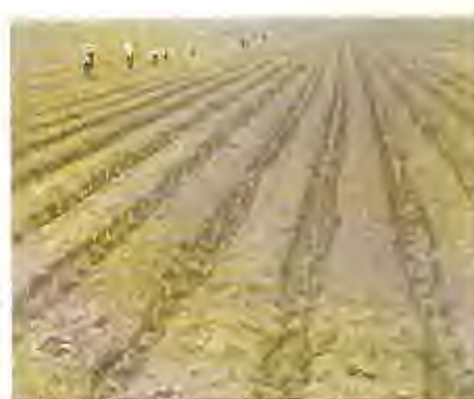
Fig. 1.2 Surquería de Caña de Azúcar

Es vital el establecimiento de semilleros o por lo menos darte un trato como semillero a tablones que se piensan utilizar para la obtención de semilla; ya que de la calidad de esta depende el éxito de la nueva plantación.