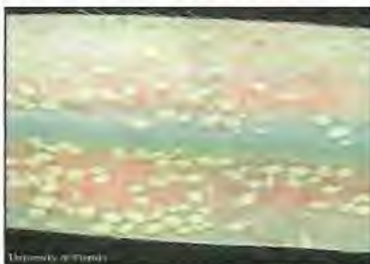
Fig. 1.11 Daños Causados por Sipha flava (Forbes)