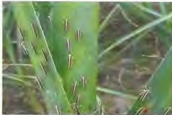
Fig. 1.10 Adultos de Perkinsiella Saccharicida

Perkinsiella saccharíca Kirkaldy (Homoptera: Delphacidae)