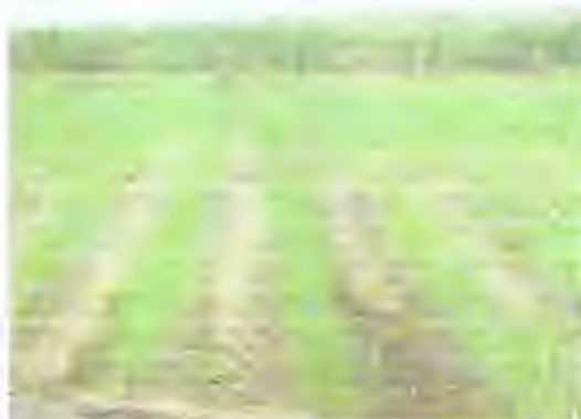
Fig. 1.1 Siembra de Caña de Azúcar

La caña de azúcar constituye, desde el punto de vista de la producción azucarera, el cultivo de mayor importancia a escala mundial. Se trata de una especie típica de climas tropicales y su cultivo se extiende hasta 35 grados de latitud a ambos lados del ecuador. Posee una excepcional capacidad productiva y supone una destacada alternativa con vista a la elaboración de alcohol carburante.