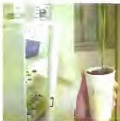
Fig. 1.4 Cámara de termoterapia y planta en vaso de icopor para tratamiento

Se coloca en medio de cultivo I (MSI) basado en las sales de Murashige y Skoog (1962) o medio de establecimiento, que le permite crecer (elongarse) bajo oscuridad y en agitación.