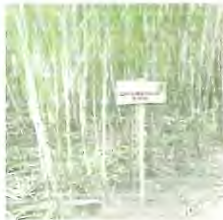
Fig. 1.7 Plantas provenientes de cultivo de tejidos sembrados en semilleros de fundación

El día anterior al trasplante, se debe proceder a regar las plantas en las gavetas para que su sistema radicular este húmedo y no sufran un exagerado estrés. Esta labor ayuda también a desprender las plantas de la gaveta fácilmente. El campo donde se va a proceder a plantar el semillero, también deberá ser regado con unos dos días de anticipación para que exista suficiente humedad en el suelo.