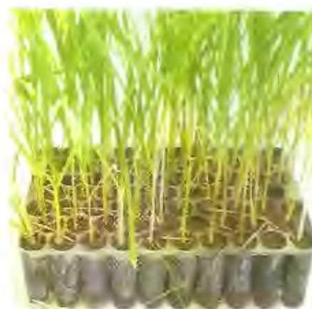
Fig. 1.6 Gavetas con plantas provenientes de Cultivo de tejidos listas para trasplante a campo.

Una vez que han transcurrido los 60 días en las gavetas, las plantas han formado un buen sistema radicular, se trasplantan a campo. Se puede usar un sistema parecido a la siembra comercial, en surcos distanciados a 1.50 m, colocando plantas individuales a 70 cm entre ellas. Estas distancias permiten sembrar unas 9523 plantas por hectárea. El trasplante se puede hacer a máquina cuando el suelo esta completamente suelto.