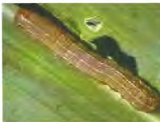
Fig. 1.12 Larva Spodoptera frugiperda Smith

Spodoptera frugiperda Smith (Lepidóptera: Noctuidae).