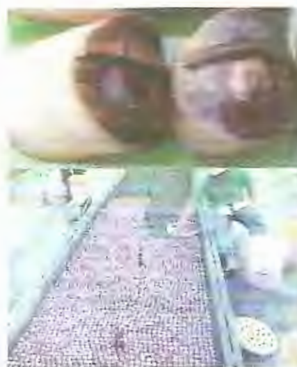
Fig. 1.3 Yemas Tratadas en agua caliente y siembra en camas de germinación

(Victoria, Guzmán y Ángel, 1995). Todas ellas están ampliamente distribuidas en Ecuador (Garcés y Valladares. 2001, Garcés, 2003).