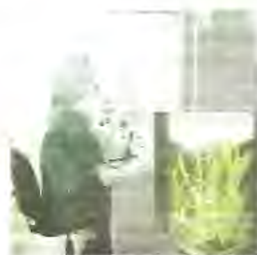
Fig. 1.5 Medio de Cultivo usados para la propagación de caña de azúcar

El medio de cultivo de multiplicación, permite obtener rápidamente un número adecuado de tallos laterales, que serán las próximas plantitas para seguir multiplicando hasta obtener un número adecuado de plantas para trasplante a gaveta y luego a campo. Las tasas de multiplicación depende de la variedad, es así que las observaciones realizadas en CINCAE, muestran que la variedad Ragnar tiene una tasa de multiplicación de 1:10, mientras que la PR 671070 presenta una relación de 1:27. La mayoría de variedades producen un promedio 10 a 12 tallos por cada meristemo extraído.