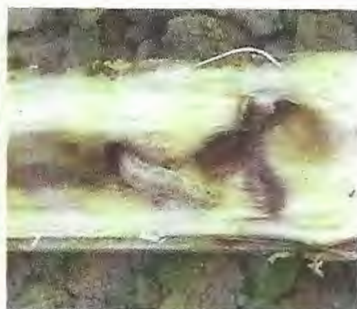
Fig. 1.9 Daños Causados por larva de Diatraea Saccharalis