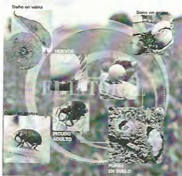
Ciclo del picudo negro