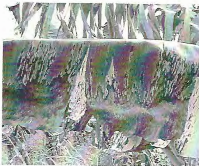
Hoja afectada por la sigatoka negra

INSTITUTO TECNOLÓGICO DE COSTA RICA C.R. 15000-200