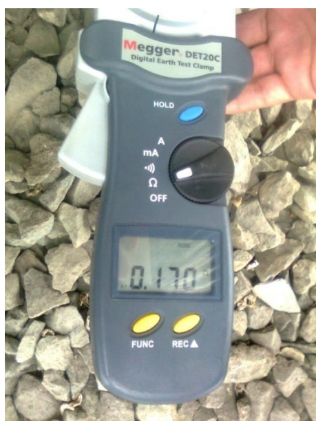
Foto 6: Prueba realizada en conexión al transformador de potencia