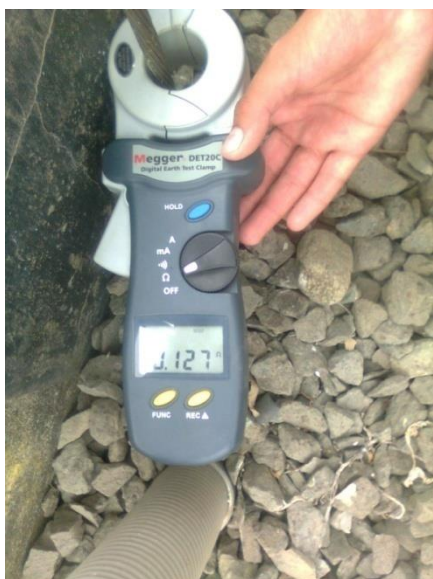
Foto 8: Prueba realizada en otras de las bases de la estructura de 69 KV