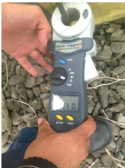
Foto 5: Prueba periódica realizada en la estructura metálica de 13.8 KV

Pruebas periódicas realizadas en la malla existente