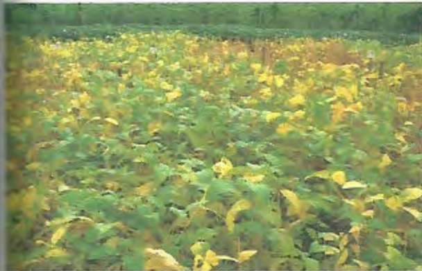
Foto 13. Ensayo en madurez fisiológica.