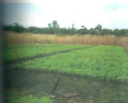
Foto 6. Vista panorámica del experimento.