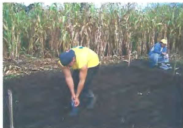
Foto 5. siembra del ensayo experimental.