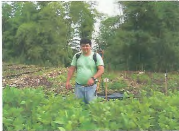
Foto 12. Control de insectos-plaga.