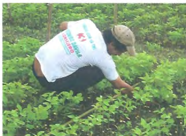
Foto 7. Raleo de plantas.