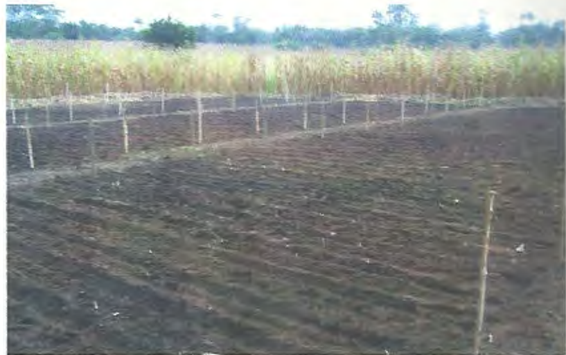
Foto 3. Vista panorámica de los surcos experimento.