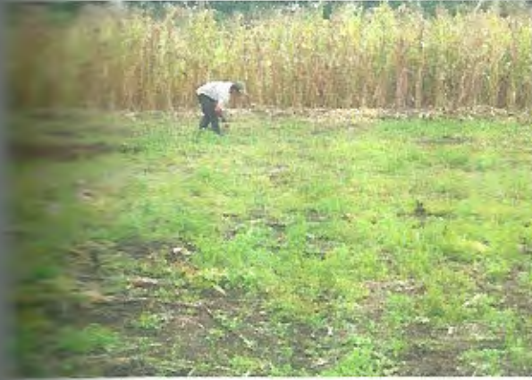
Foto 1. Adecuación del campo para la siembra