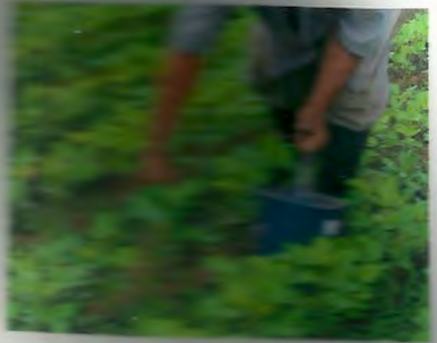
Foto 9. Aplicación de los abonos orgánicos líquidos.