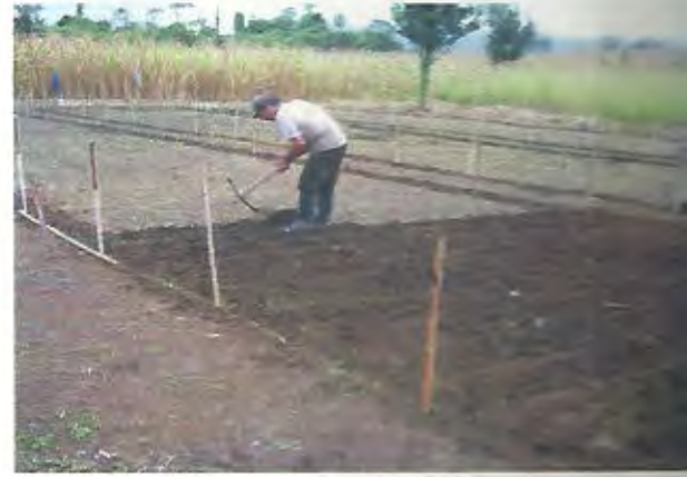
Foto 2. Elaboración de surcos para la siembra