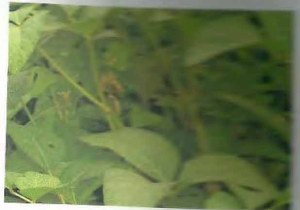
Foto 11. Cultivo en formación de vainas y semillas.