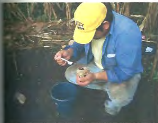
Inoculación de la semilla con Bradyrhizobium japonicum