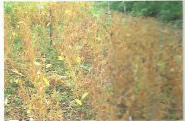
Foto 14. Cultivo próximo a cosecha.