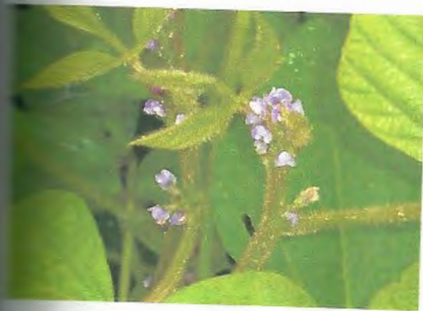
Foto 10. Cultivo en proceso de floración.