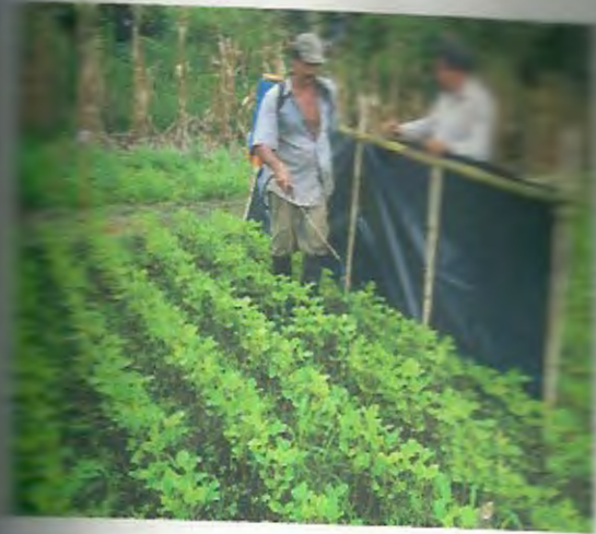
Foto 8. Aplicación de los abonos orgánicos líquidos.