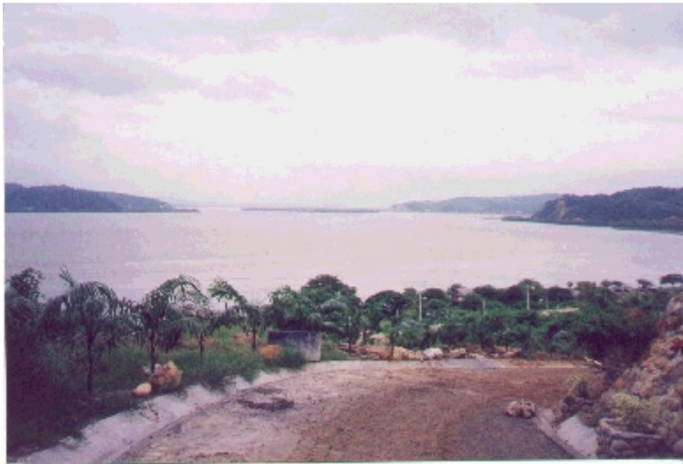
Entrada principal a Saiananda