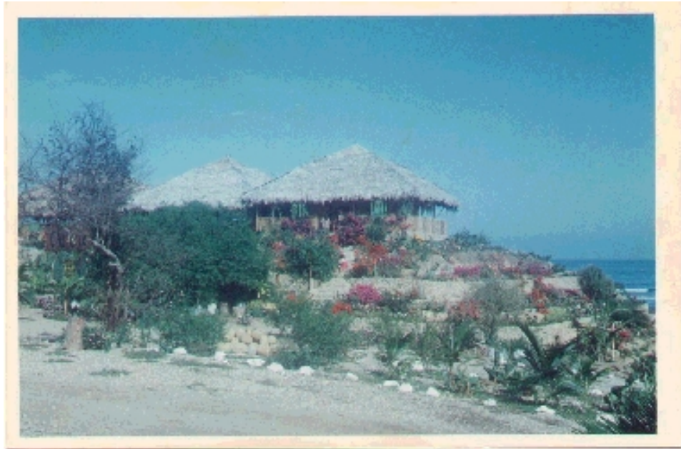
Complejo Turístico Chirije