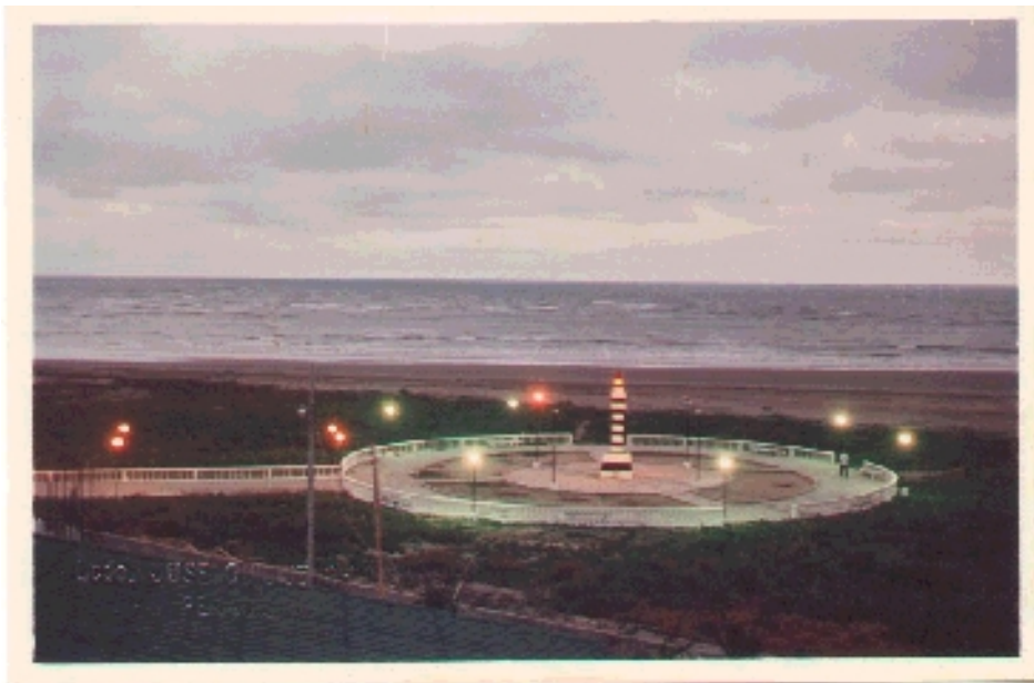
Antiguo Parque de El Faro