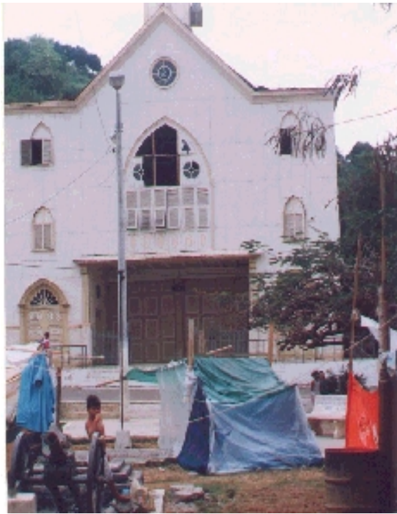
Catedral y damnificados en el Parque