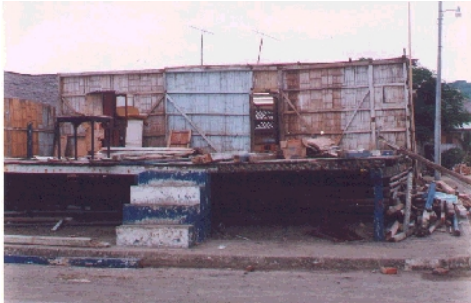
Restaurante Jixsy luego del Terremoto en Canoa