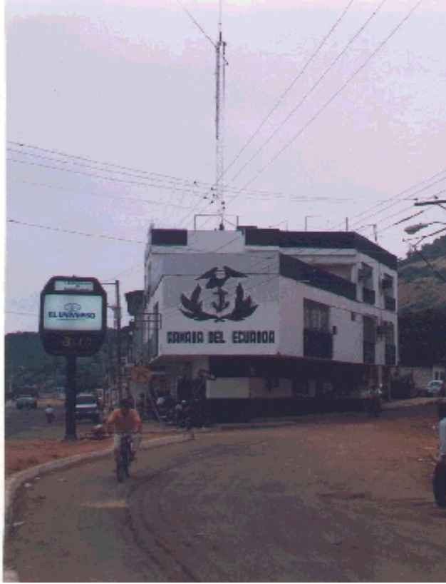
Edificio de la Armada del Ecuador