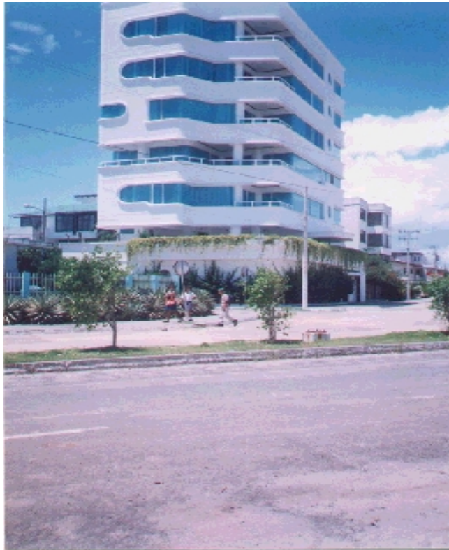
Edificio Moderno de la ciudad