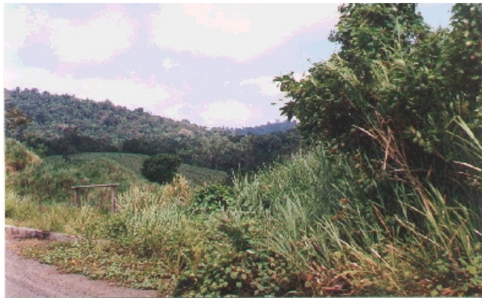
Cerro Pata de Pájaro