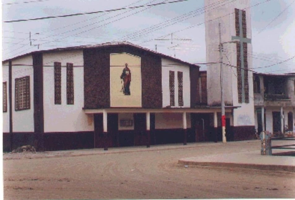
Iglesia Principal de Jama