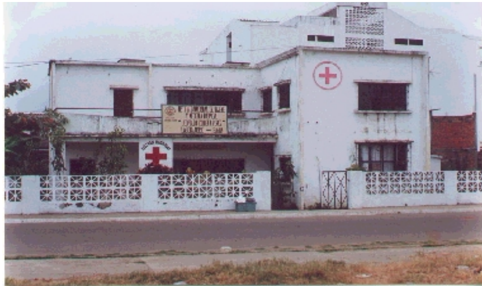
Cruz Roja Ecuatoriana de Bahía de Caráquez