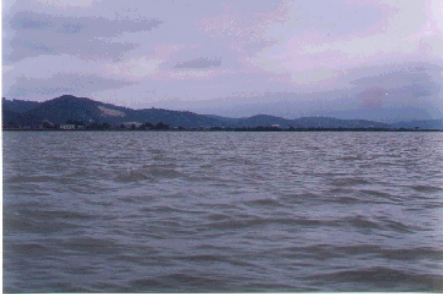
Estuario del Río Cojimés