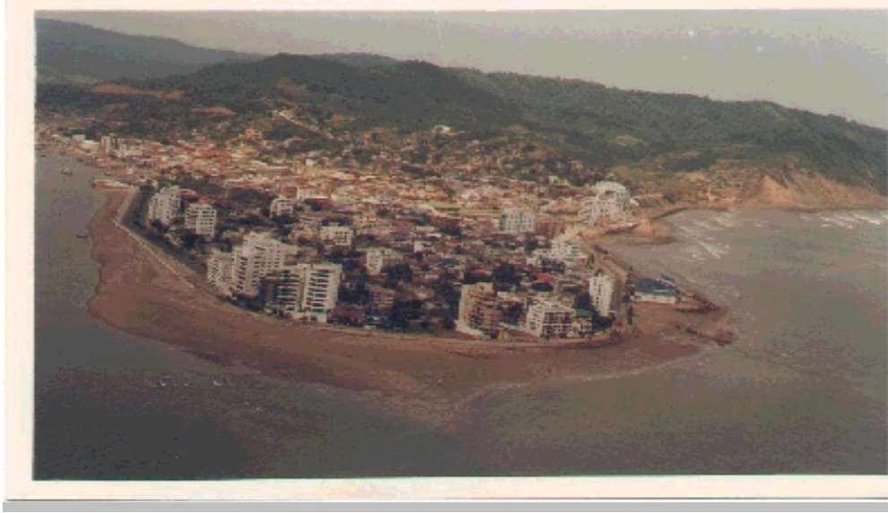
Vista Panorámica de Bahía de Caráquez