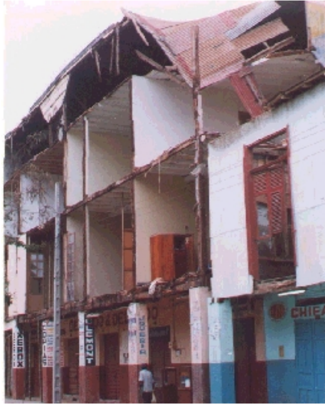
Edificio destruido en La Av. Simón Bolívar