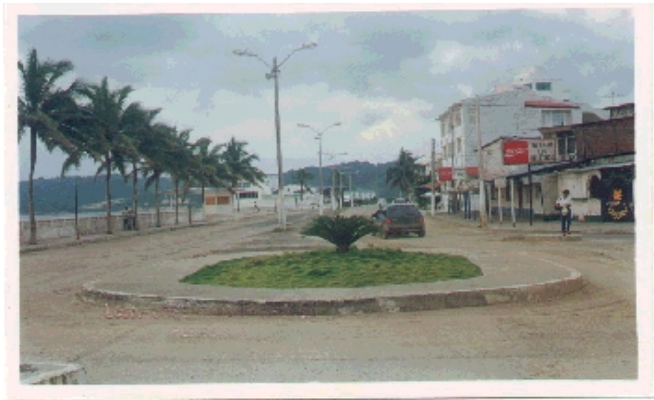
Malecón Alberto Santos