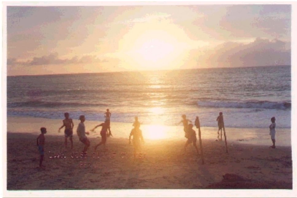
Atardecer en Bahía