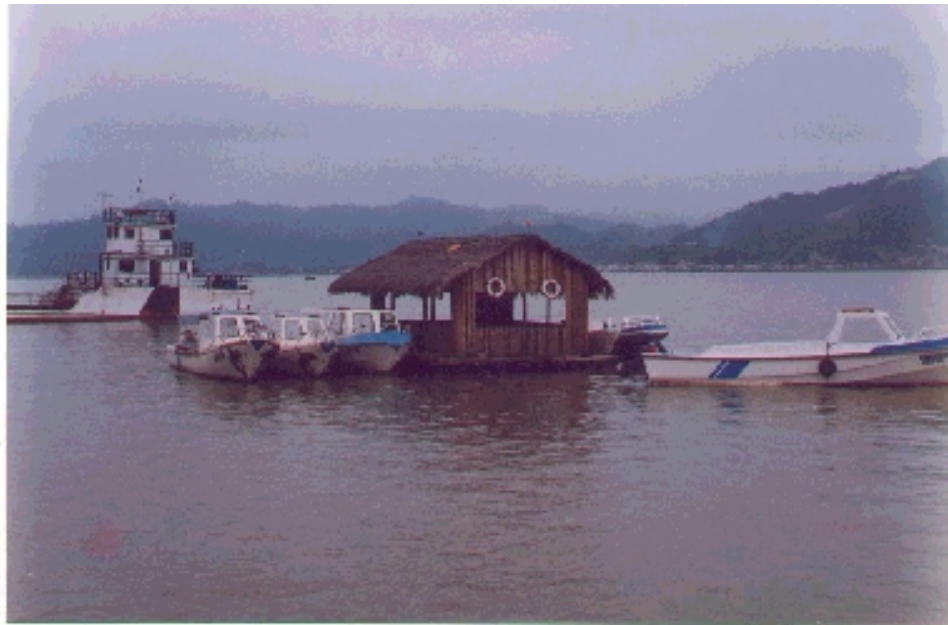
Cabaña flotante de Chirije