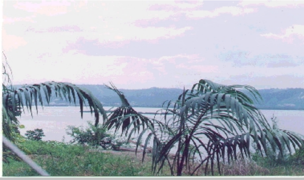
Vista panorámica de la Isla de los Pájaros