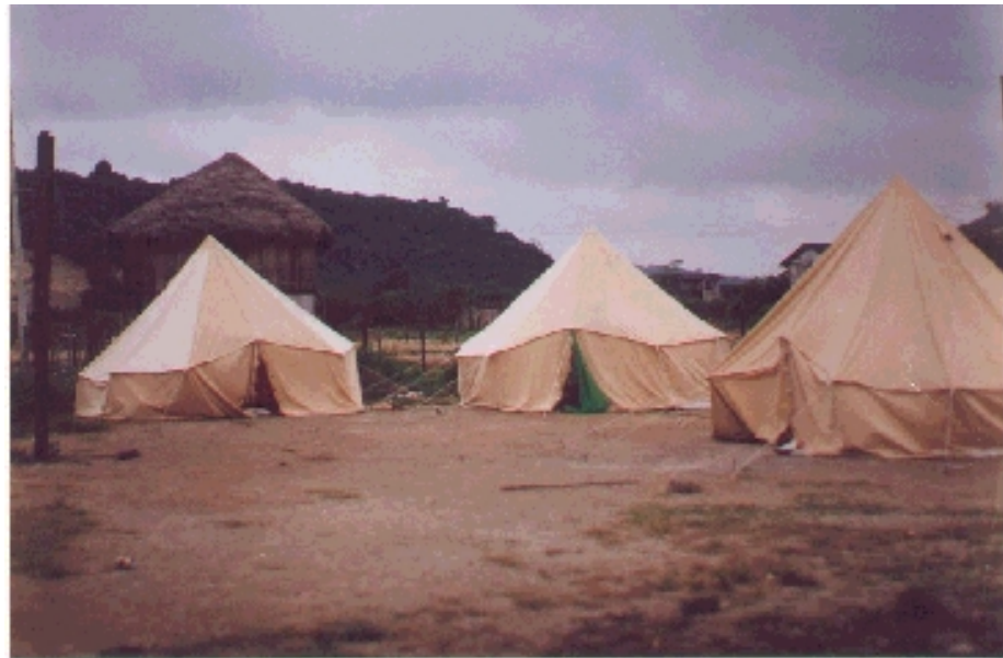
Damnificados de Canoa