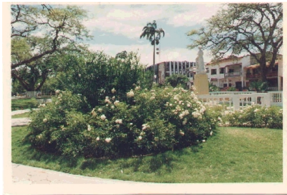
Parque Manuel Nevares – Monumento a La Madre