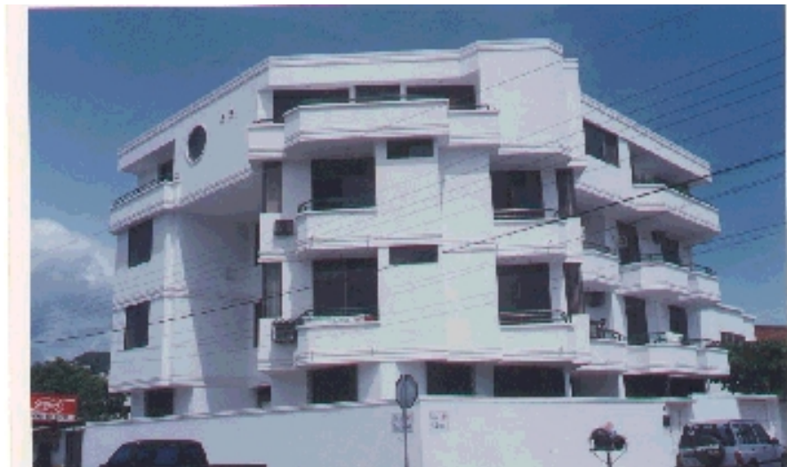
Edificio de las Embajadas