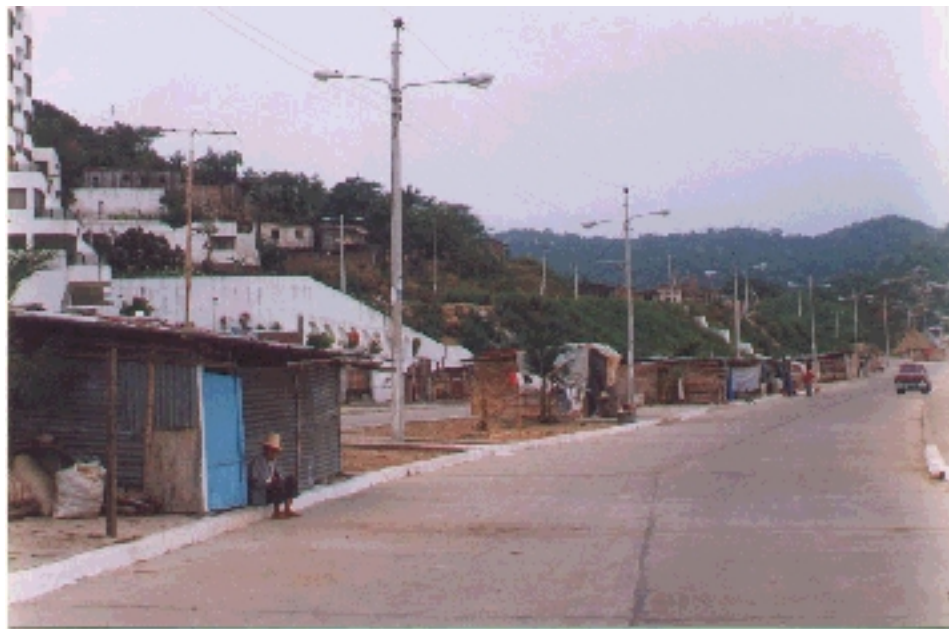
Damnificados en el Malecón