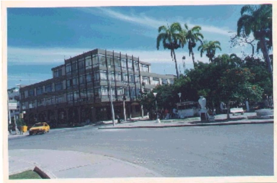
Edificio del IESS