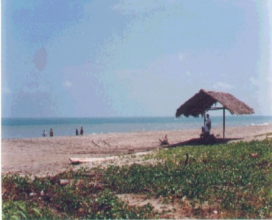
Playa de Cojimies