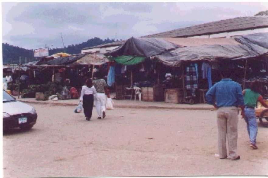
Mercado de San Vicente