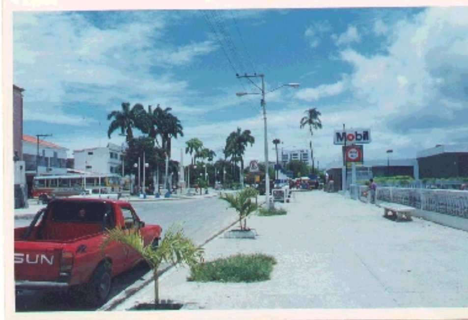
Entrada a Bahía – Parque de El Obelisco