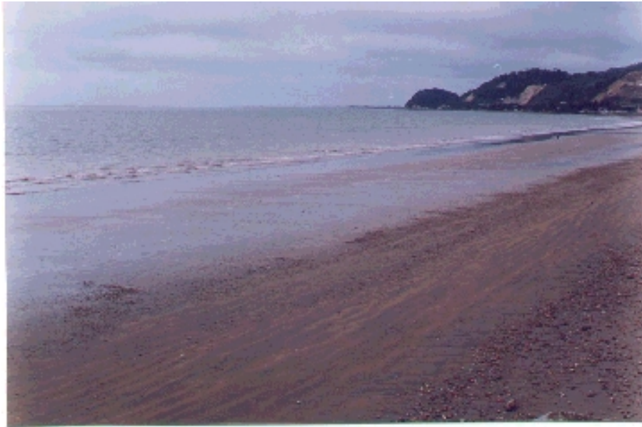
Playas de Jama