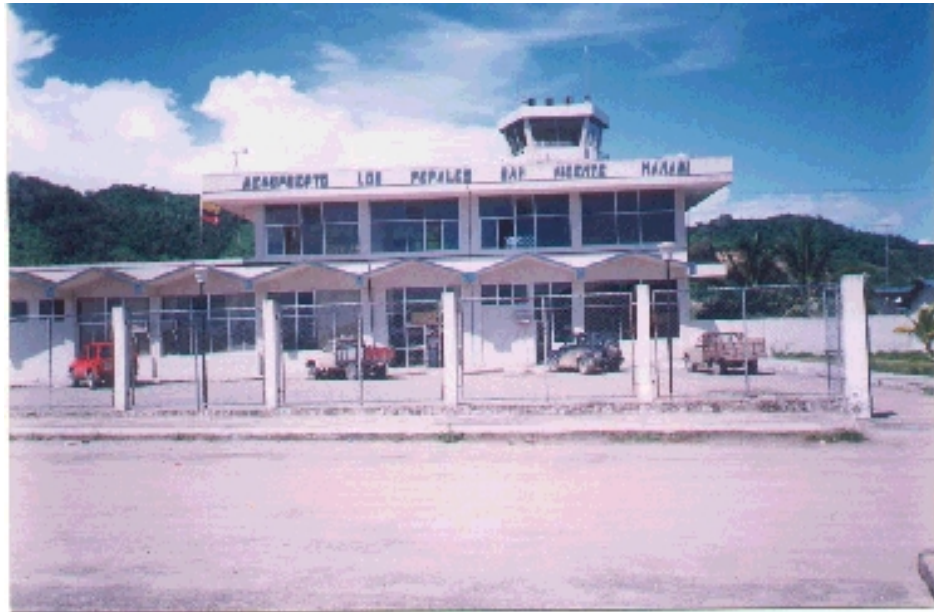
Aeropuerto de Los Perales