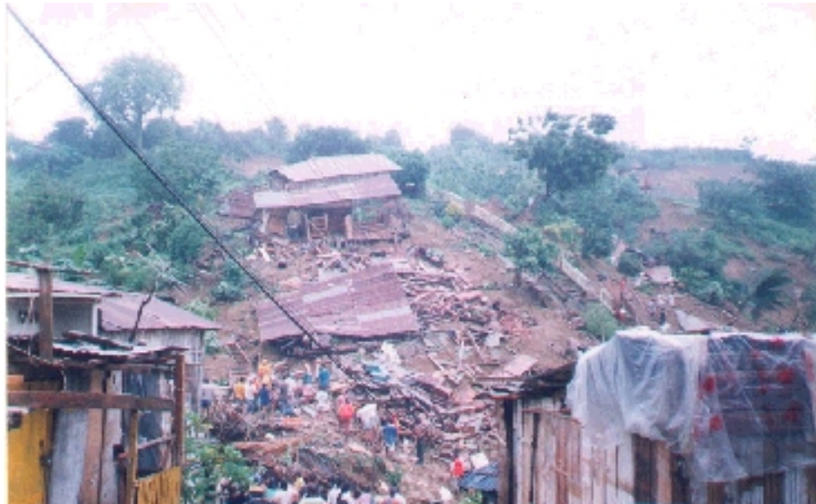
Fenómeno de El Niño Barrio Ma. Auxiliadora (Bahía de Caráquez)