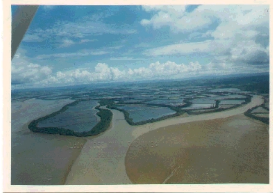
Camaroneras del Estuario