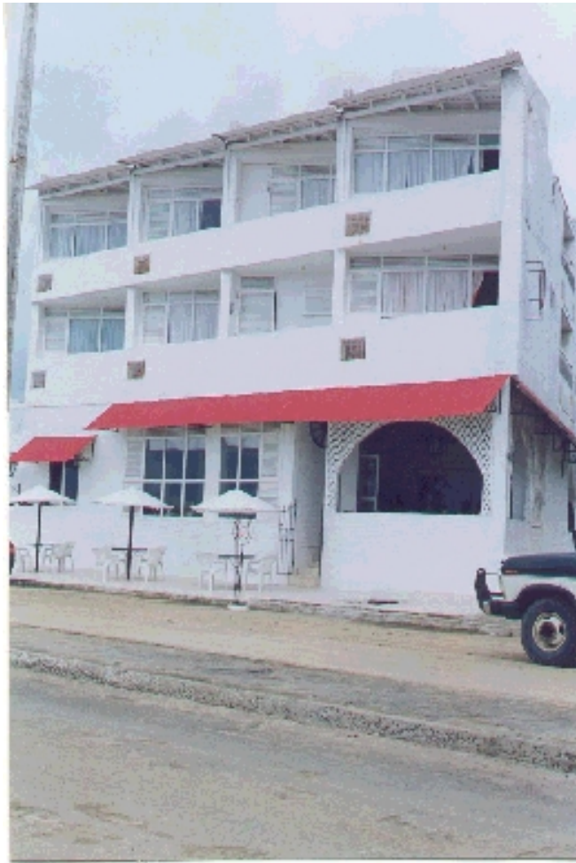
Hotel La Herradura