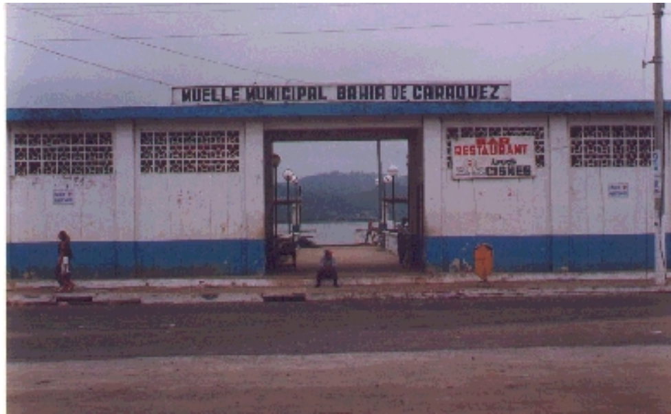
Muelle Municipal de Bahía de Caráquez