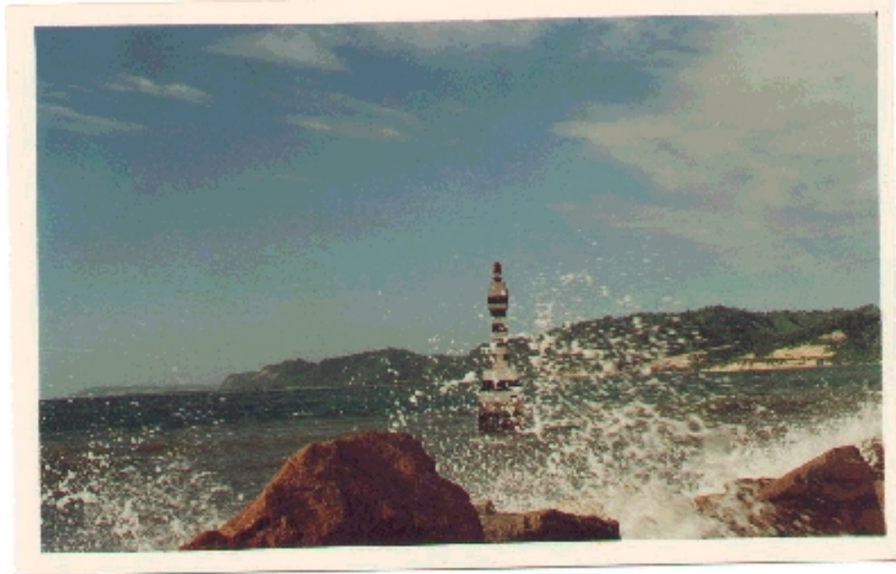
El Faro en la actualidad