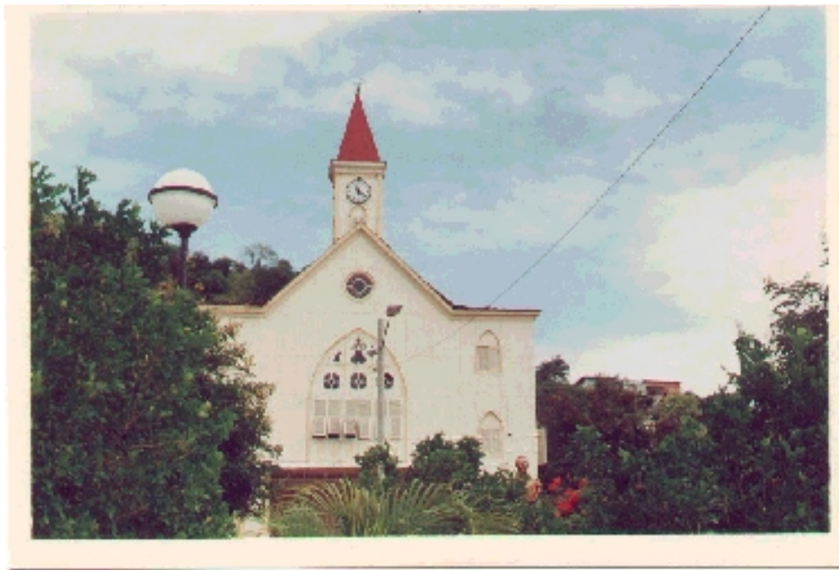
Iglesia de La Merced