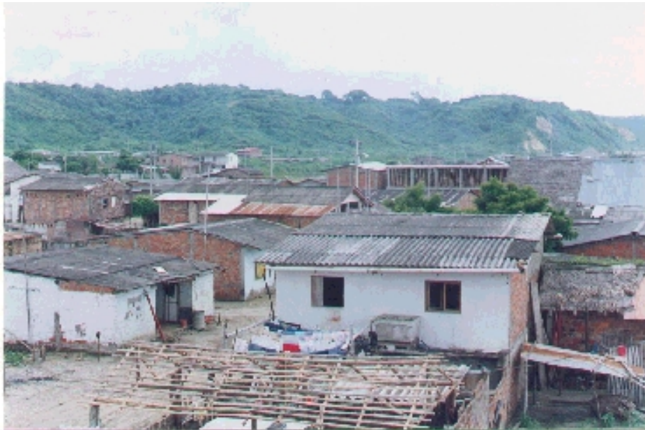
Vista panorámica de la ciudad de Canoa