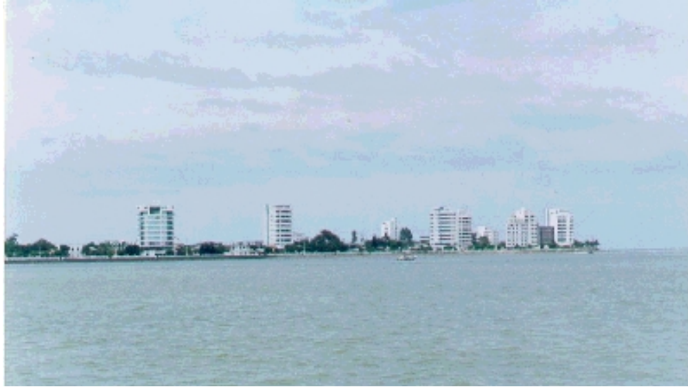
Bahía de Caráquez vista desde la Gabarra