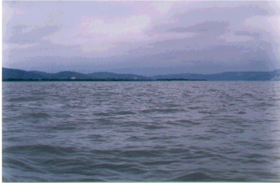
Estuario del Río Cojimés