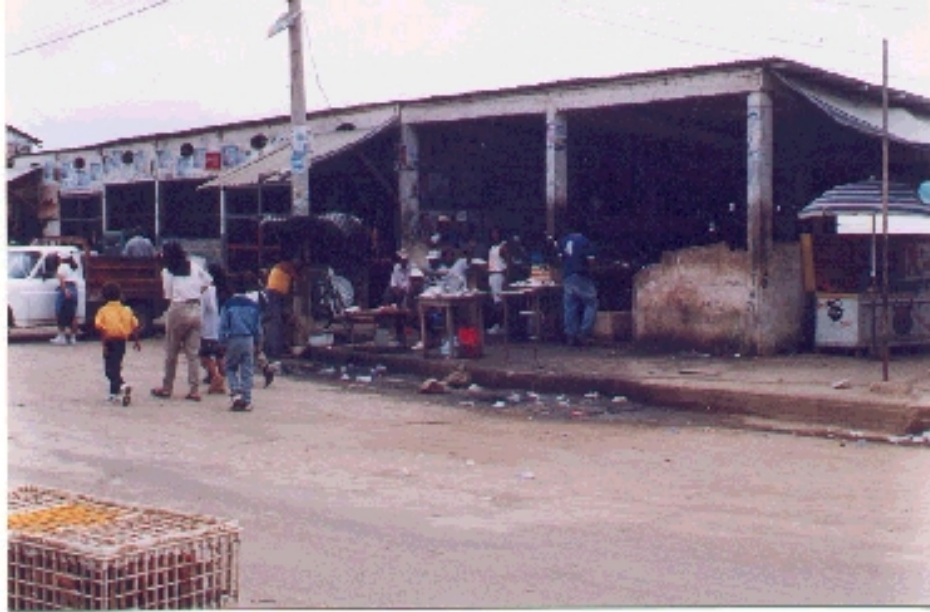
Vista parcial del Mercado