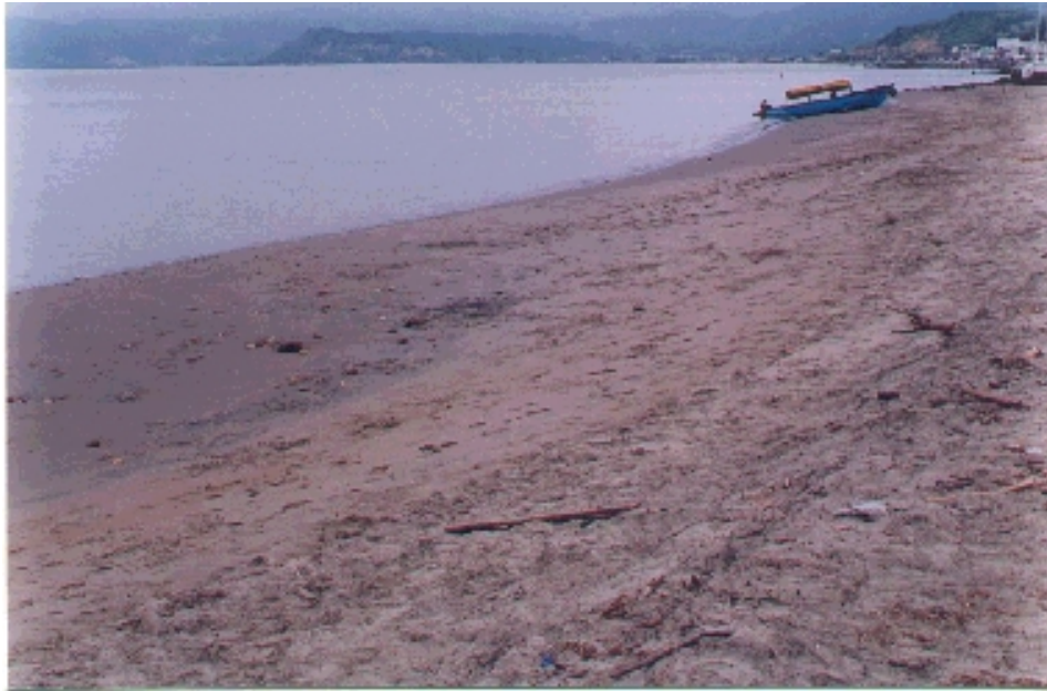
Playa de San Vicente