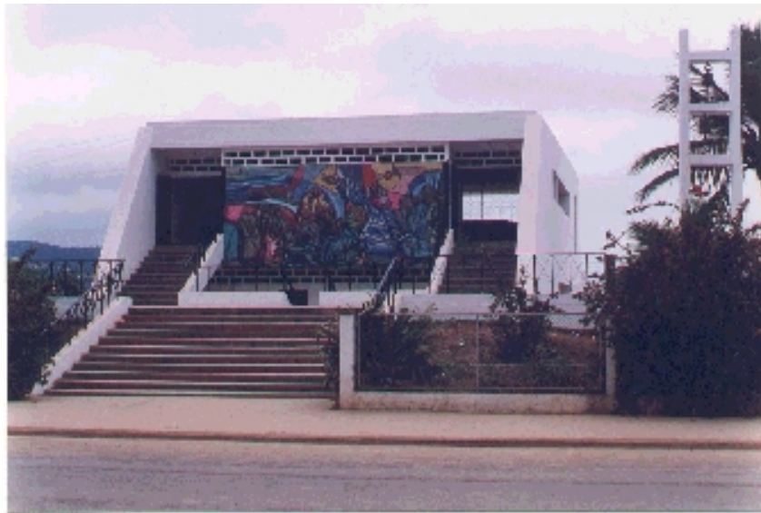
Iglesia Santa Rosa