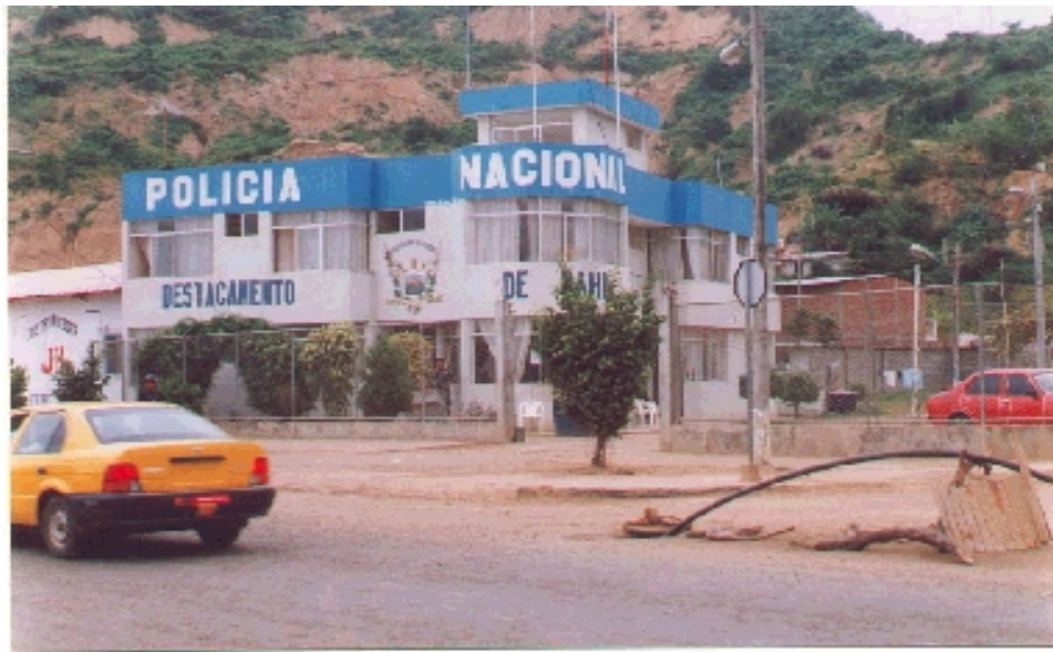
Edificio de la Policía Nacional