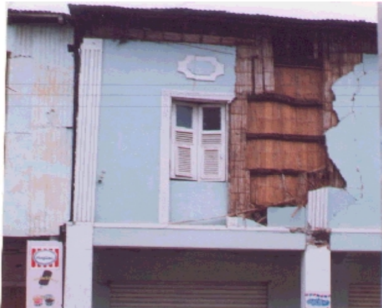
Casa destruida en el centro de Bahía de Caráquez