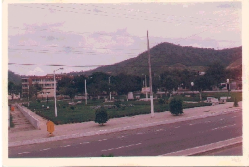
Hospital Miguel H. Alcívar