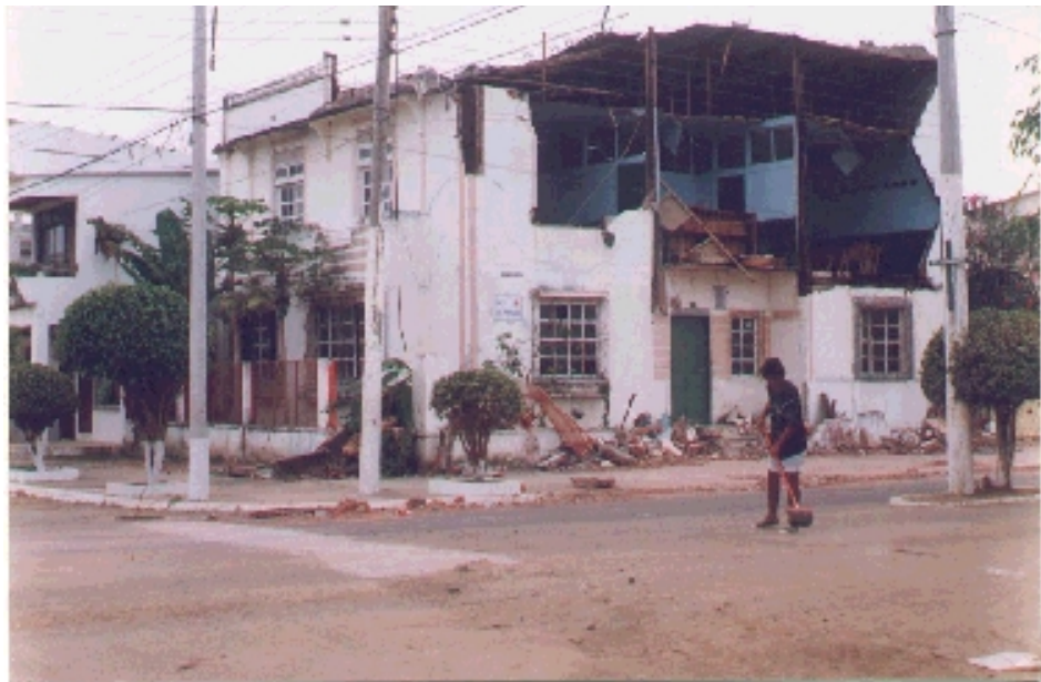
Sindicato de Choferes