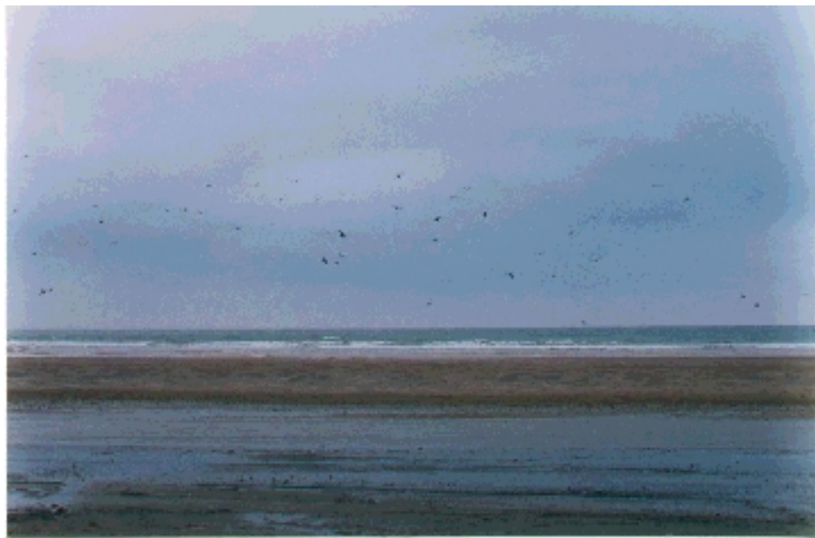
Playa de Bahía de Caráquez