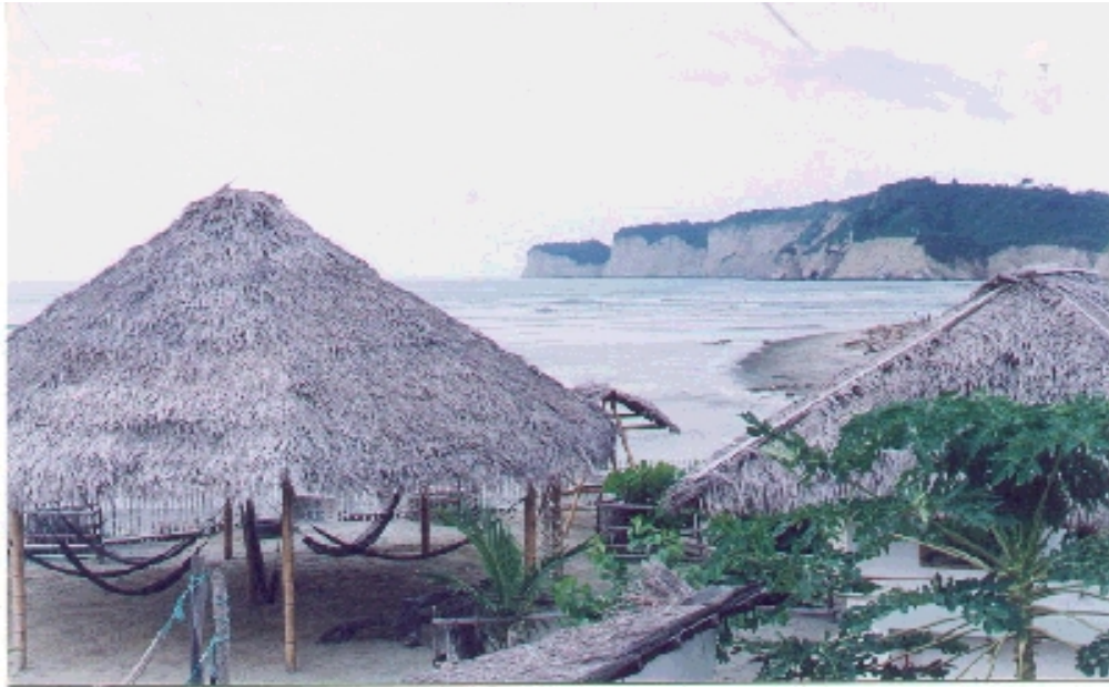
Vista panorámica de las cuevas