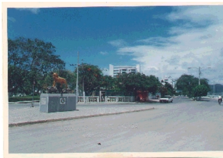
Vía de acceso a la Ciudadela Norte – Monumento del Club de Leones