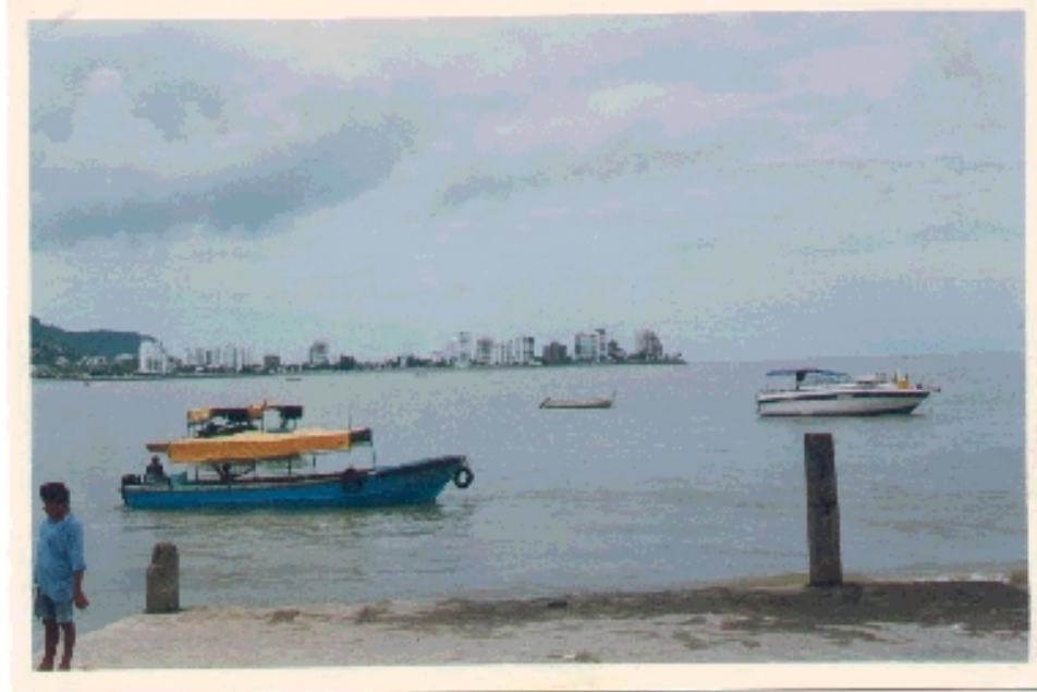
Embarcadero de pangas