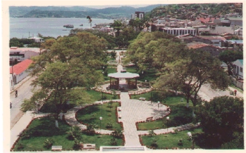
Parque Manuel Nevares