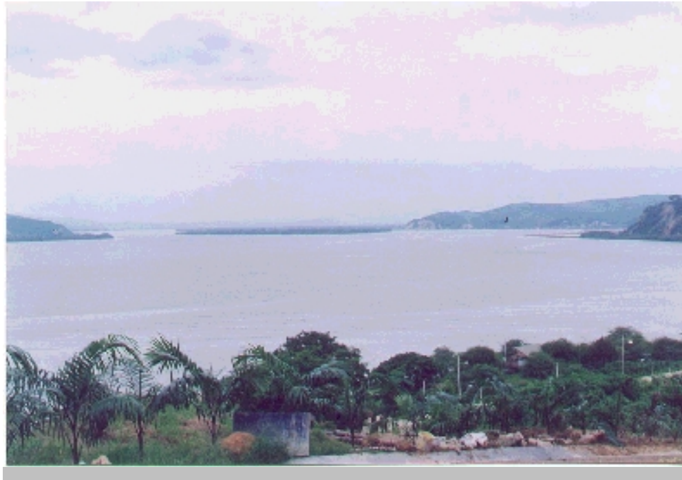
Vista panorámica de la Isla Corazón