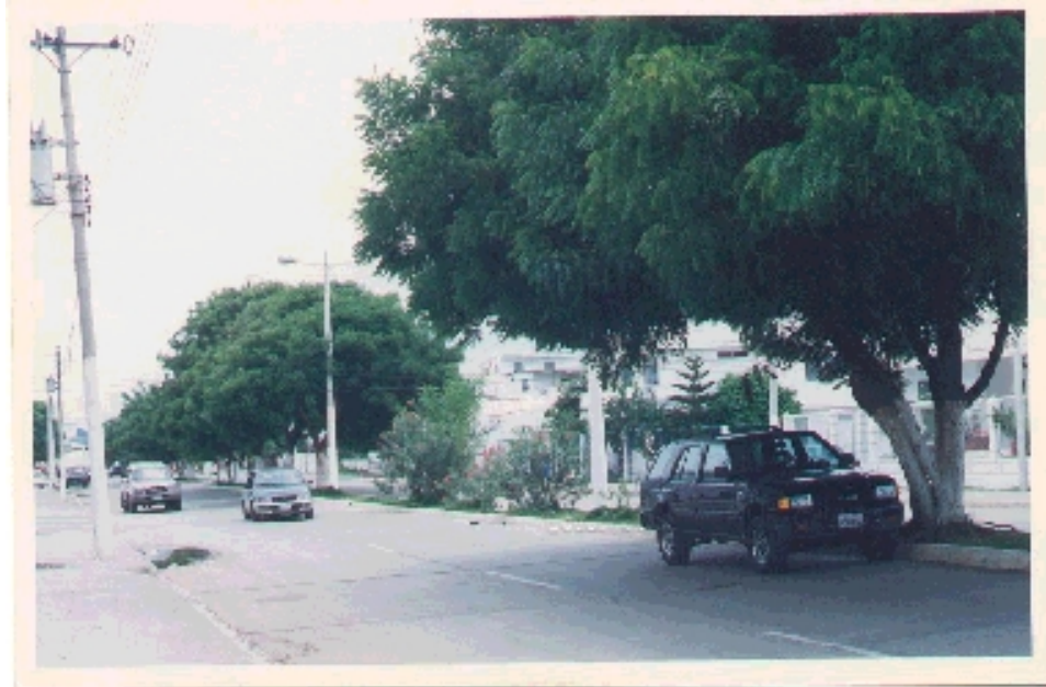
Av. Simón Bolívar – Arteria principal de la Ciudad