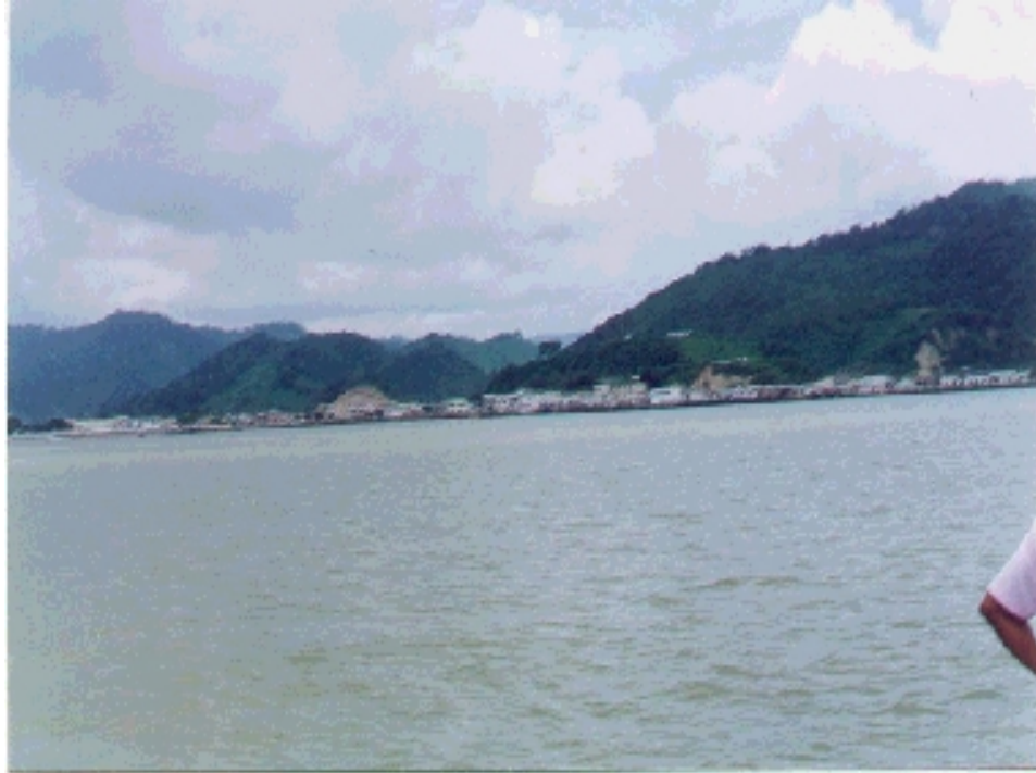
Vista panorámica de San Vicente