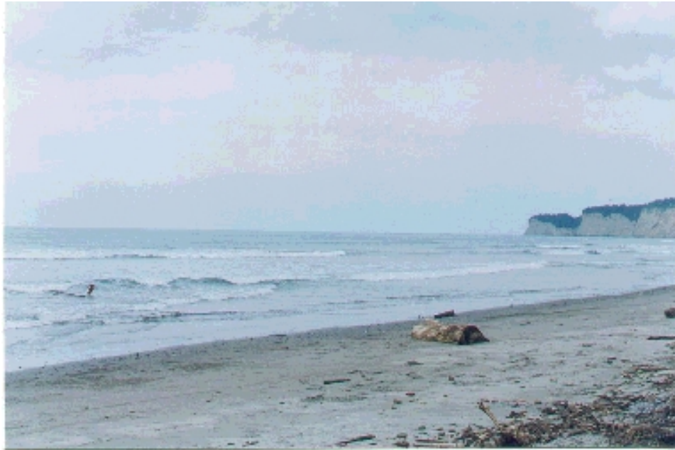
Vista panorámica de la playa de Canoa