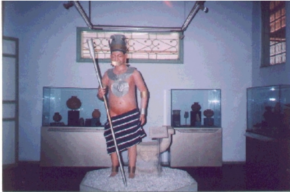
Museo de La Casa de La Cultura