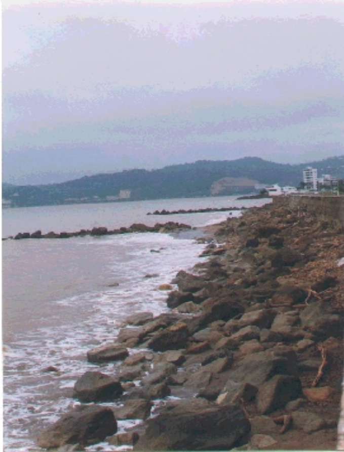
Muro de rocas