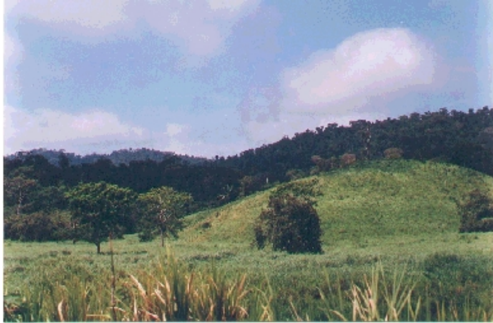
Cordillera de Chindul