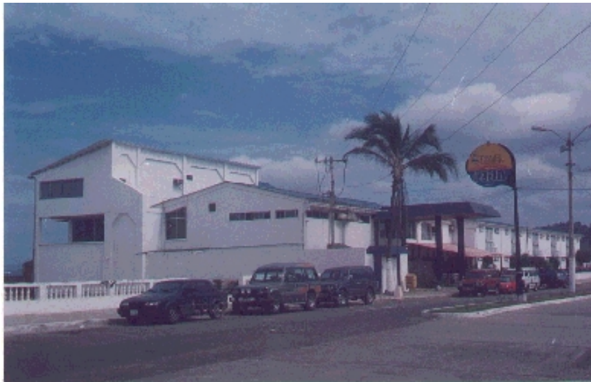
Hotel La Piedra