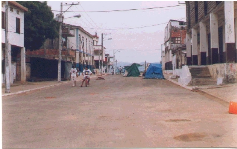
Damnificados del Terremoto Barrio San Roque