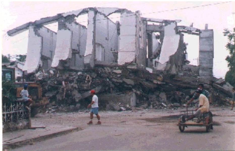
Edificio Calipso luego del Terremoto