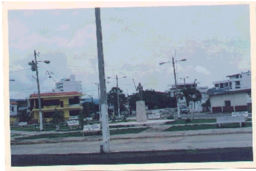
Parque del Indio Cara