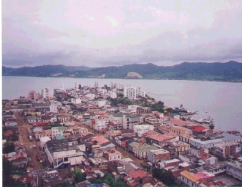
Vista panorámica de Bahía de Caráquez con vista parcial de San Vicente