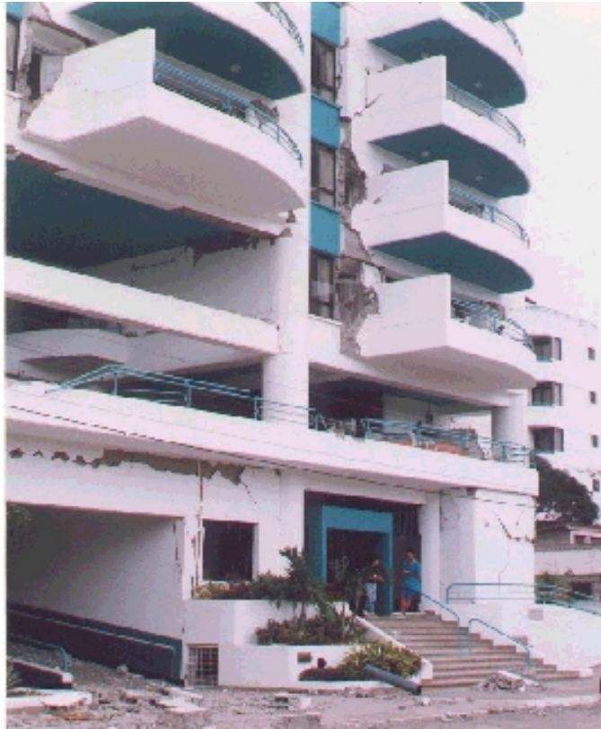
Hotel Cabo Coral