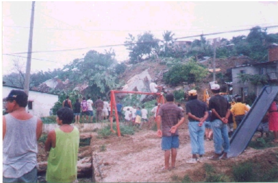
Parque del Barrio Ma. Auxiliadora luego de deslizamientos (Bahía de Caráquez)