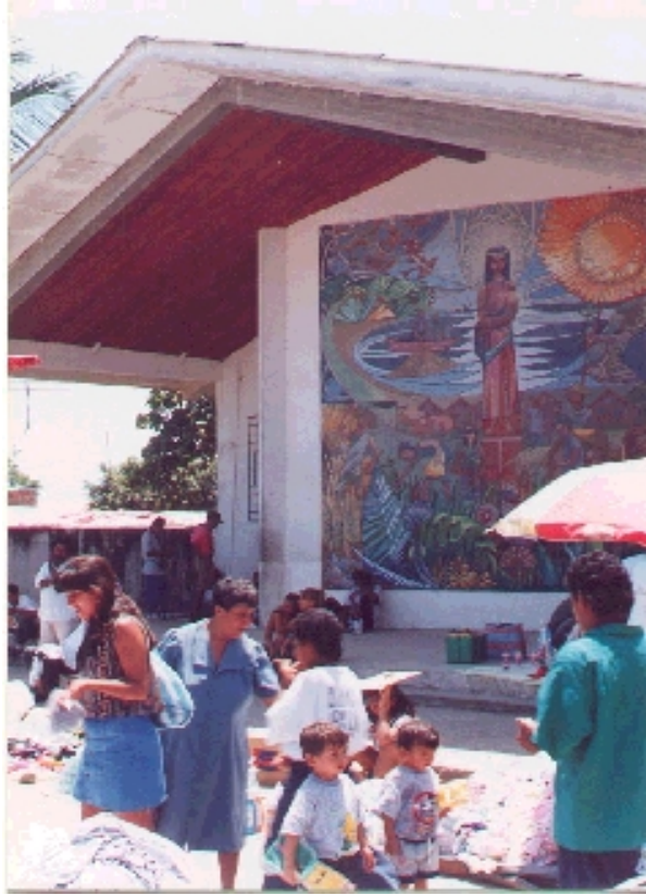
Iglesia Principal de Pedernales