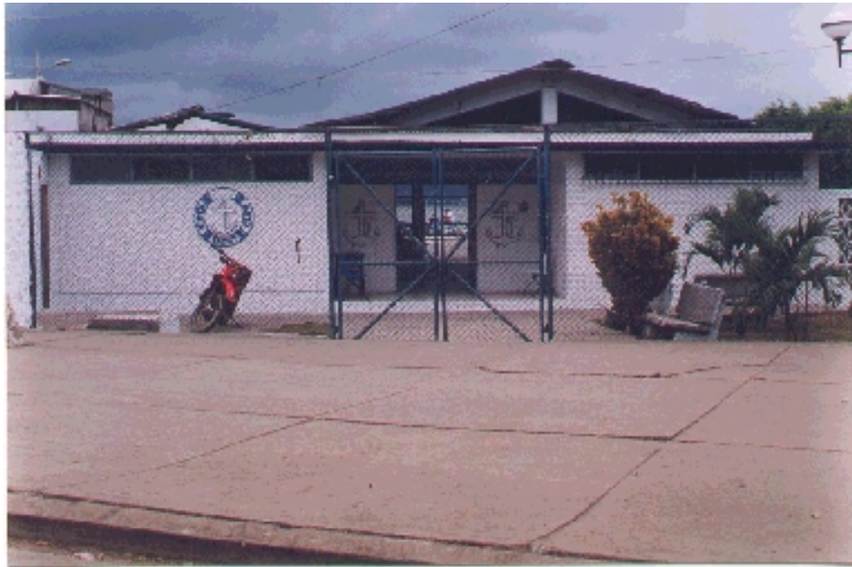
Bahía Yacht Club