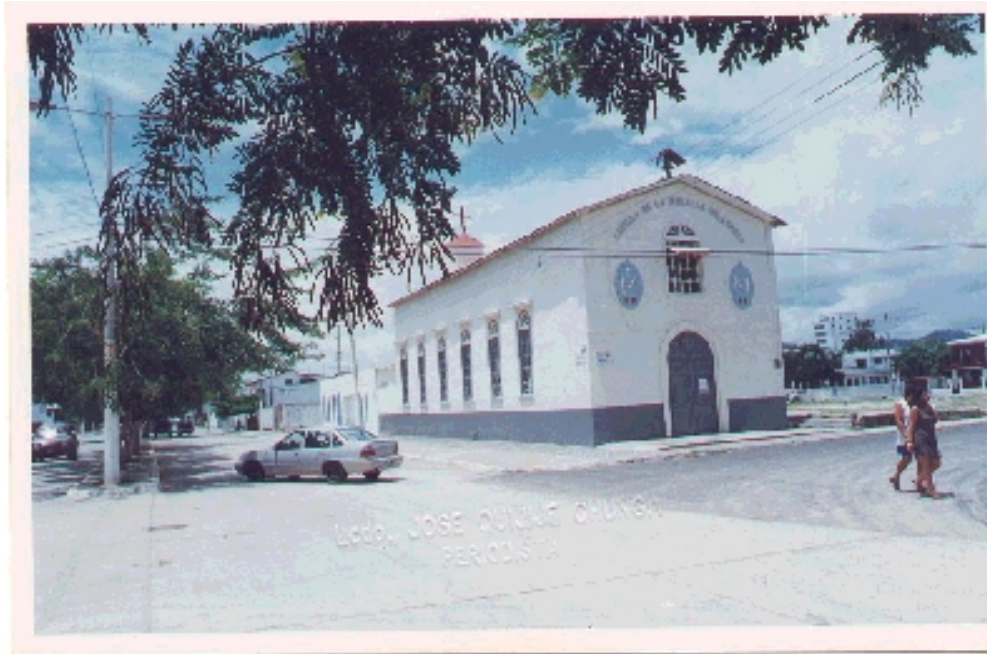
Capilla de La Medalla Milagrosa