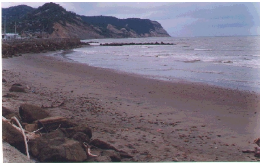
Muro de rocas