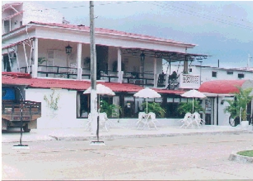
Hotel La Herradura Fachada Principal