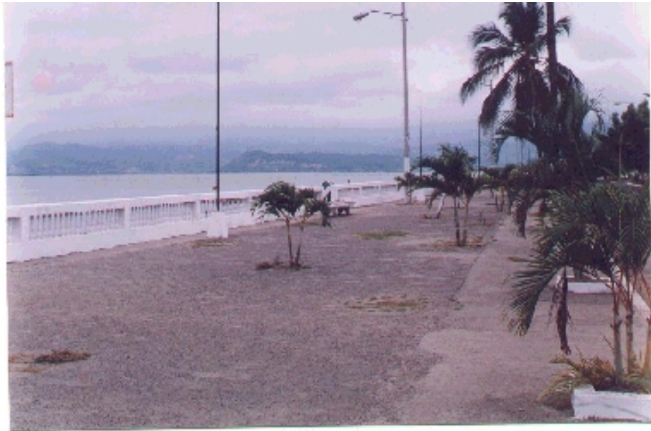
Malecón de San Vicente