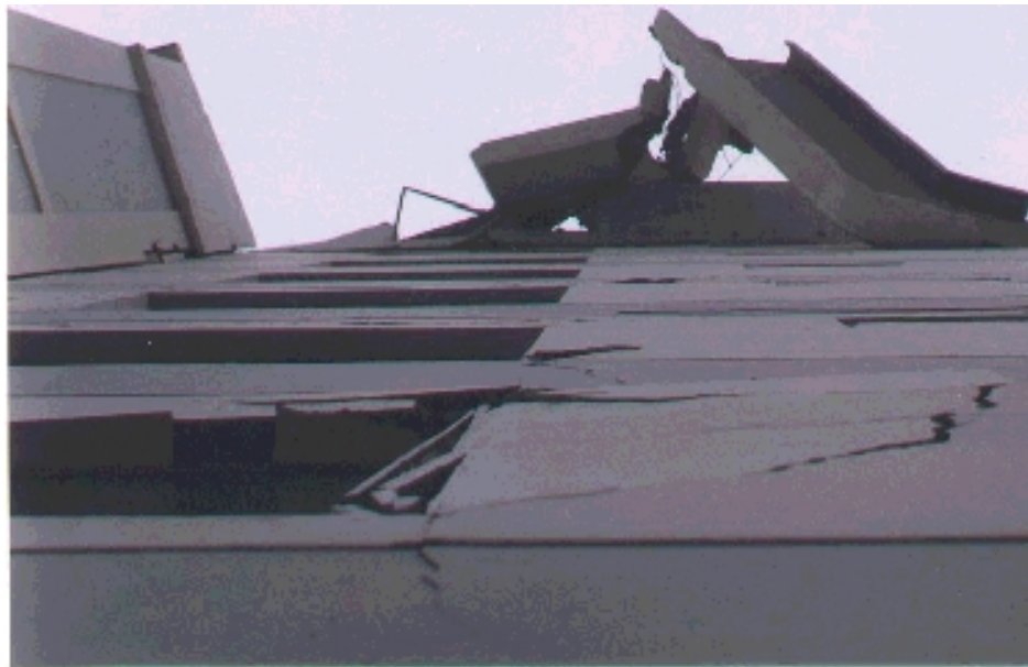
Edificio destruido en su parte superior