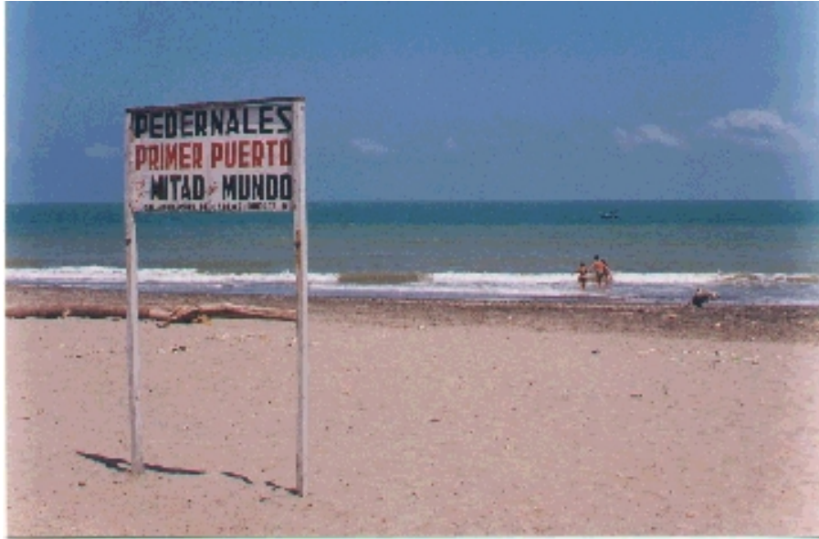
Playas de Pedernales