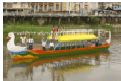
Figura 5. Gondola "Bonita Aldea"

Esta propuesta será ejecutada por personas que se encuentran especializadas en el área del turismo como así mismo se dará la oportunidad de involucrar a los habitantes del cantón, para ellos mismo sean los encargados de representar a su lugar natal y mostrar su belleza natural y cultural.