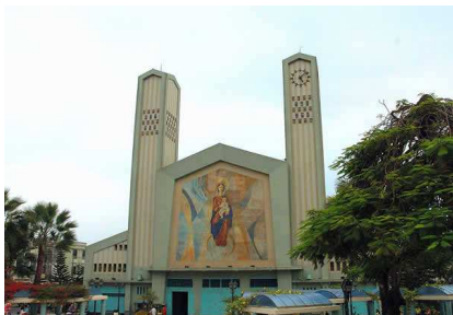
Figura 1. Catedral de Babahoyo

Se ha buscado crear la propuesta de una ruta turística fluvial en el Cantón Babahoyo que permita rescatar la identidad de los habitantes y su vinculación con el río, a través de nuevas actividades que involucre su participación activa para su desarrollo social y económico.