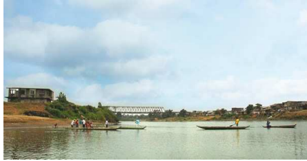
Figura 2. Río Babahoyo

destinos que contribuyan a generar el turismo en la misma.