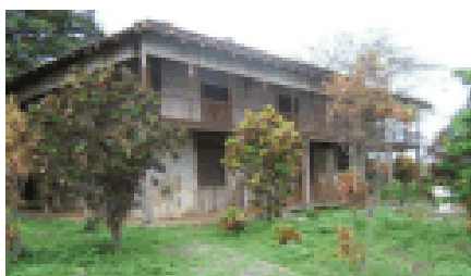
Figura 4. Casa de Olmedo

También se ha determinado posibles impactos negativos que se puedan suscitar durante la ejecución de la propuesta, como son los siguientes: