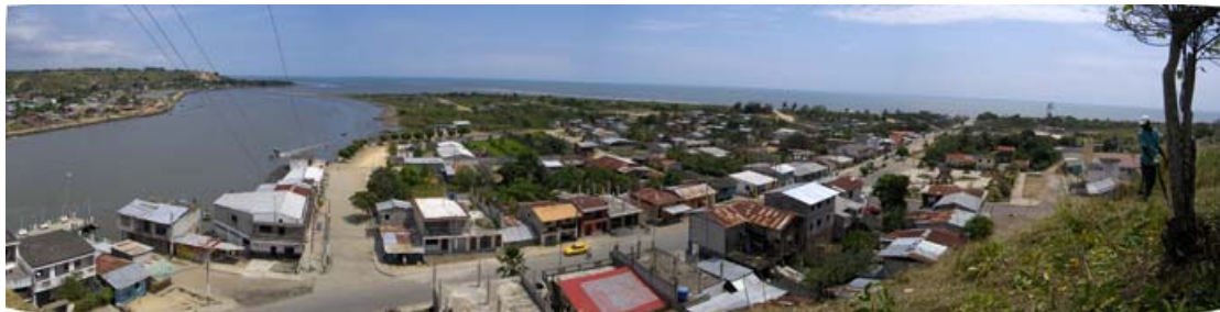
Fig. 1. Panorámica de río Verde, 2007

El cantón Río Verde está ubicado al norte del país, específicamente en la provincia de Esmeraldas, se caracteriza por poseer valiosos recursos naturales, tales como: productos agrícolas, ganado, y acuícolas, los mismos que se irán considerando a lo largo de este estudio.