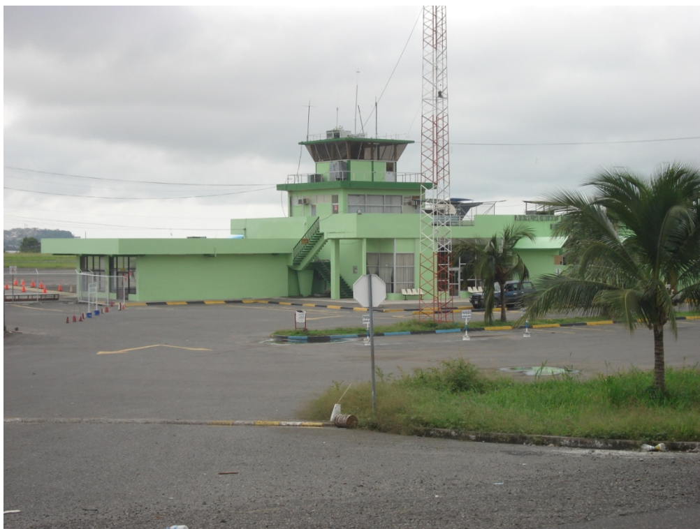
Fig. 3. Aeropuerto General Rivadeneira (Tachina), 2007, Fuente: estudios realizados

En lo que refiere a transporte terrestre, solo existe el transporte intercantonal, el cual recorre las cabeceras parroquiales. El transporte público intercantonal es permanente aunque no presta un servicio de buena calidad. Por otra parte el cantón no ofrece espacios especializados: estacionamientos, paradas, señalización, etc.