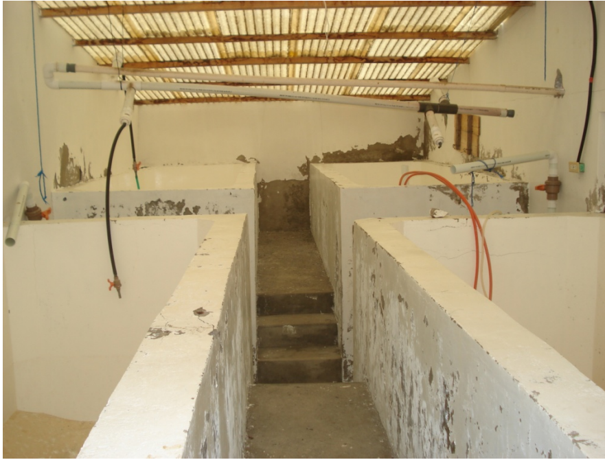
Fig.12. Laboratorio en producción,2007, Fuente: estudios realizados

Estas post larvas no reciben un análisis cualitativo previo, simplemente los productores se basan en la procedencia del nauplio y el sistema utilizado en el laboratorio proveedor, tomando siempre en cuenta las experiencias anteriores con estos mismos laboratorios. Pero claramente, es fundamental hacer la selección de postlarva, con criterio técnico, puesto que se trata de la base o materia prima a partir de la cual se va a llevar a cabo todo el proceso de cultivo. Es imperativo saber la calidad y procedencia certificada de la postlarva que se va a adquirir, analizar si hubo aplicación previa de antibiótico, verificar que no haya mucha diferencia de talla, que sea una talla uniforme, medir el nivel de actividad del individuo, aplicar pruebas de estrés, etc. Esto determina si la calidad de la larva es la óptima, o no. Para esto es muy útil y recomendable, que para la compra de larva, se exija la correspondiente certificación de calidad de larva.