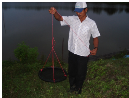
Fig.10. Sistema de Alimentación Tipo Comedero, 2007

Las cosechas de camarón se daban en tallas de 25g. a 30g. en periodos de 3 meses de cultivo, siendo las supervivencias reportadas de 80 a 100 %. Estas tan altas supervivencias podrían parecer algún error, sin embargo la explicación radica en lo que en la industria se llamó machete.