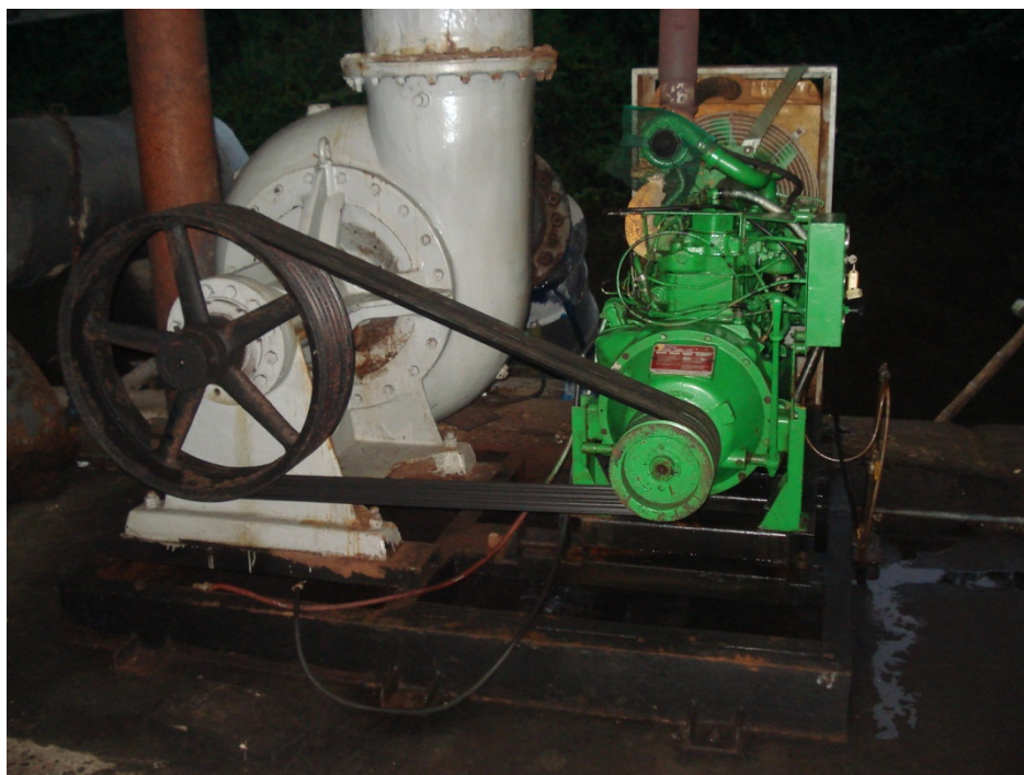
Fig.14. Contaminación por derrame de aceite, 2007, Fuente: investigación realizada