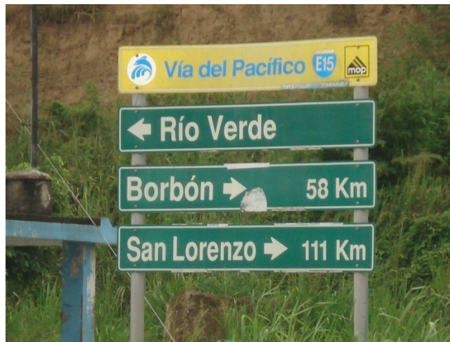
Fig.9. Red Vial, 2007

Las vías acceso constituyen una importante infraestructura de apoyo que permite una logística muy ágil a la hora de entrar y salir de Río Verde tanto para comprar insumos como para vender los productos de las camaroneras y de la pesca artesanal.