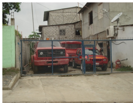
Fig.8. Cuerpo de Bomberos, 2007

Se cuenta con cuerpo de bomberos, un centro de salud del ministerio, el cual se encuentra en condiciones precarias. También está El Municipio de Río Verde, el cual posee una pequeña biblioteca.