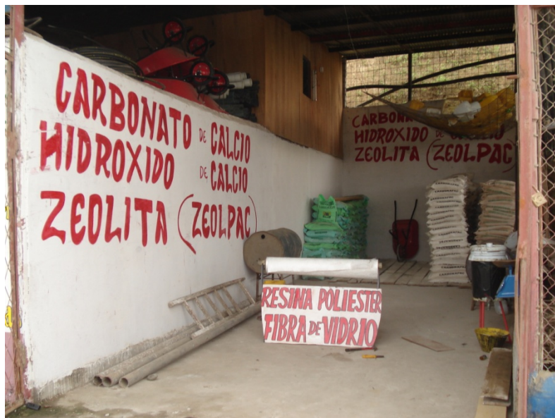
Fig.13. Bodega de Insumos, 2007, Fuente: estudios realizados

Una vez más, la aplicación de probióticos se vuelve frecuente en el proceso de alimentación.