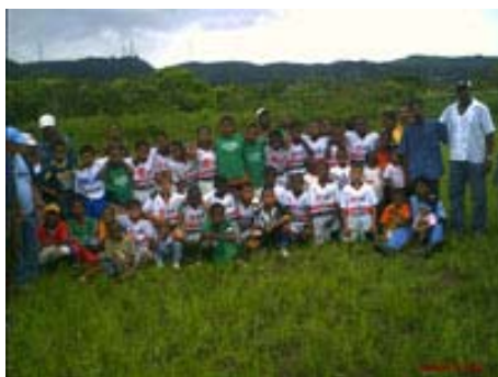
Fig. 4. Pobladores del cantón Río Verde, 2007

Las principales actividades económicas en el cantón son: la agricultura, ganadería y pesca, existen actividades de comercio menor, servicios, administración y turismo, el 20% de la PEA (población económicamente activa) se dedica a actividades generadas por la agricultura, el 20% de la PEA trabaja en actividades generadas por la ganadería, el 30% de la PEA se dedica a actividades forestales, el 10% de la PEA se dedica a actividades de pesca artesanal, otros sectores como turismo, servicios públicos y actividades de comercio menor ocupan el 20% de la PEA.