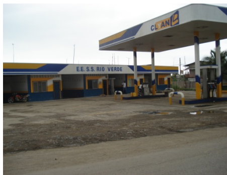
Fig.6. Estación de Servicio, 2007, Maurini