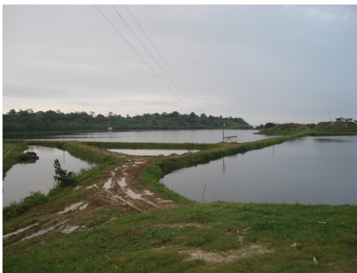
Fig.11. Piscina Rehabilitada, 2007

quedando apenas 100 ha. como zona productiva. Pero gracias la implementación de cuidados y mejoría en los procesos, la recuperación fue factible y exitosa, logrando en la actualidad reactivar 400 ha, de las cuales las últimas 30 ha. fueron construidas en el año 2005. [ 2 ]