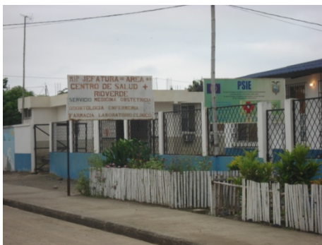
Fig.5. Centro de Salud, 2007, Maurini

En el ámbito educacional, las entidades educativas que se encuentran constituidos, podríamos citar la escuela y colegio Río Verde; además en la vecina parroquia Rocafuerte existe otro colegio que lleva el nombre del Presidente Vicente Rocafuerte.