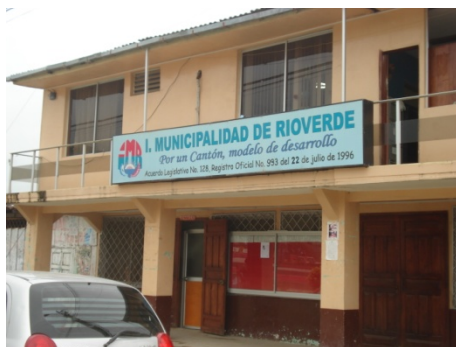
Fig.7.Municipalidad, 2007