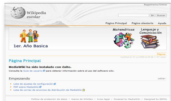
Figura 3. Ejemplo de enciclopedia personalizada para un año de educación básica.

Este ambiente está conformado por el servidor portable llamado Server2Go [2] que contiene las librerías de PHP, una base de datos MySQL Lite y el MediaWiki [3] que permiten procesar y leer el archivo XML generado con anterioridad, transformándolo en un modelo relacional para ser presentado en un entorno gráfico. Todo esto es la infraestructura base que le permite al usuario final observar y buscar dentro de los datos generados de forma rápida y en una interfaz amigable.