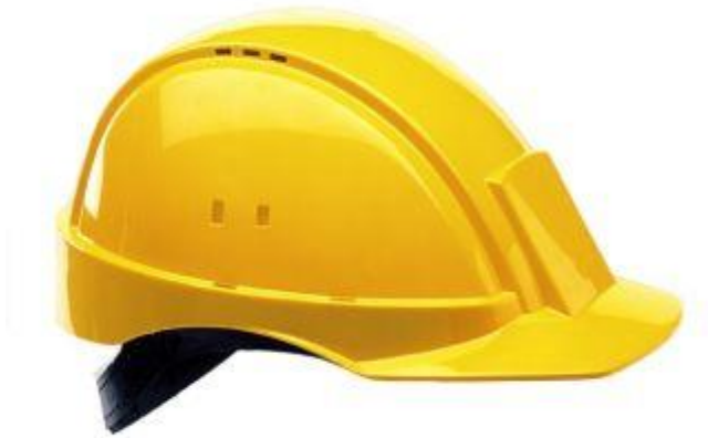
Fig.2.10.1 casco protector de la cabeza

Las características que hacen de este equipo personal sean esenciales para la protección de la cabeza, se detallaran a continuación: