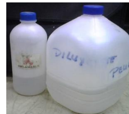
Figura 2.3.1.3 Recipientes del diluyente