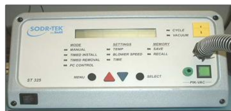
Figura 3.2 Estación de Aire Caliente Pace Pace ST 325

Voltaje de Entrada: 97-127 V CA, Frecuencia: 60 Hz Potencia Máxima: 575 W a 120 V CA, 60 Hz Rango de temperatura del aire: 149 °C – 482 °C (300 °F – 900 °F)