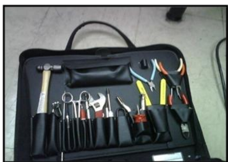
Figura 3.4 Herramientas mecánicas