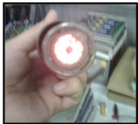
Figura 2.3.2.2 Vista frontal del manubrio de la estación ST 325

El factor de riesgo por quemaduras es uno de los más importantes ya que las temperaturas de trabajo como por ejemplo la estación de aire caliente es de 395 °C.