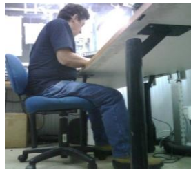
Figura 2.3.2.4 Postura del Técnico