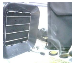
Figura 2.3.1.2 Humos metálicos al momento de soldar