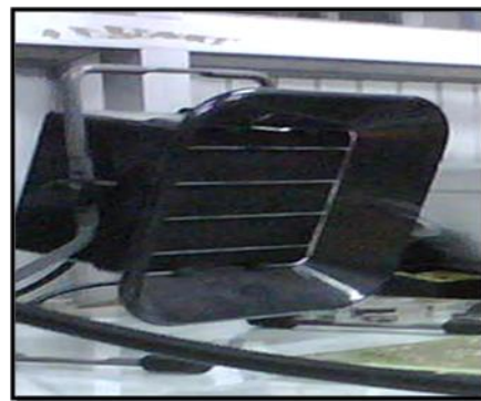
Figura 3.3 PACE FX-50

FX-50 está diseñado para remover gases de soldadura y pasta de soldar de la zona de respiración del operador, mediante filtros de carbón.