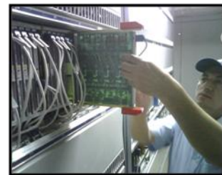
Figura 2.3.2.3 Prueba 1

Durante las pruebas de tarjetas de abonados en los respectivos Racks, se encontró un alto factor de riesgo por electrocución debido a la incorrecta manipulación de la misma (Ver figura 2.3.2.3)