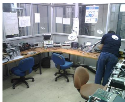
Figura 4.1 Area del Laboratorio

Considerando los datos específicos del laboratorio y las formulas que nos dan la cantidad de fluorescentes necesarias para un trabajo delicado y de precisión se determinó que se necesitan 5 lámparas.