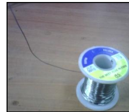
Figura 2.3.1.1 Aleación de 60% Sn y 40% Pb.

En la Laboratorio de la CNT se identifico, el riesgo por la inhalación de gases provenientes de la soldadura con estaño-plomo, manipulación del diluyente, polvo en tarjetas, resina para soldar.