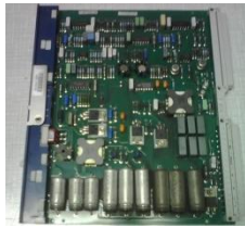
Figura 2.3.1.4 Tarjeta con polvo