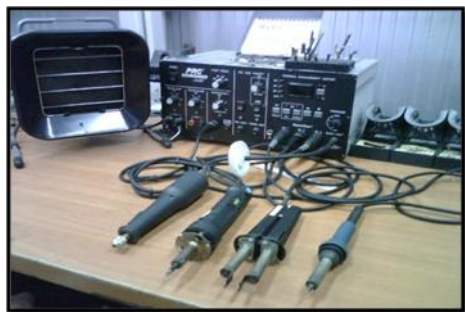
Figura 3.1 PRC2000

V in: 97-127 VAC, Frecuencia 60 Hz. P: 250 Watts.