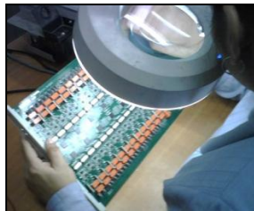
Figura 2.3.2.1 Iluminación y lupa

La iluminación deficiente ocasiona fatiga a los ojos, perjudica el sistema nervioso, ayuda a la deficiente calidad del trabajo y es responsable de una buena parte de los accidentes de trabajo