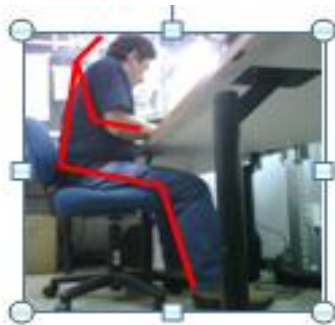
Figura 4.4 Postura Correcta del Técnico

Se puede observar que hay un ángulo entre el cuerpo y el hombro no mayor a 5^\circ de separación. Entre el brazo y el antebrazo existe un ángulo mayor a 90^\circ . Entre el tronco y los muslos forma un ángulo de 90^\circ .