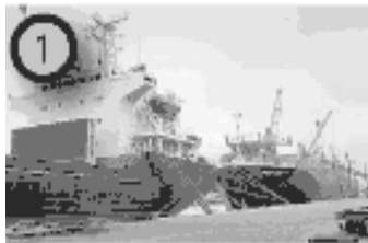
Figura 3. Puerto de Esmeraldas

En este puerto está situada la principal terminal para la exportación de petróleo, además maneja las exportaciones de banano.