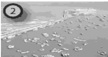
Figura 2. Puerto de Manta

Como es Puerto Abierto al mar no tiene canales y de profundidad natural no presenta problemas al ingreso de las naves a los muelles internacionales y marginales. Es el más próximo de toda Sudamérica a los grandes terminales de transferencia internacional del lejano oriente