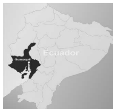
Figura 1. Ubicación de Puerto de Guayaquil

Es el único puerto del país que puede convertirse en el más eficiente del país, con menor inversión Excelente abrigo de la acción de corrientes, oleajes y vientos de mar abierto. Profundidad suficiente para el manejo de la carga. Con el dragado actual a mediano y largo plazo. Suficiente disponibilidad de espacios para la construcción de nuevos muelles y facilidades (Áreas de reserva Baja sensibilidad del manejo portuario respecto a fluctuaciones de la economía nacional. ). Especialización en tráfico y carga. Solvente situación financiera Ausencia de sindicatos. Prestación adecuada de servicios portuarios por la empresa privada. Baja interferencia en general con áreas urbanas Cercanía con el centro industrial más importante del país. Cercanía con una ciudad que empieza a funcionar como marca turística. Certificación en el Código Internacional de Seguridad para Buques e Instalaciones Portuarias PBIP - ISPS.