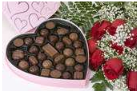
FIGURA 1.3.: Caja con variedades de bombones

Pastelería.- Pasteles y tartas que piden chocolate o que presentan variantes en chocolate: en la masa en forma de añadido o como baño. Técnicas muy refinadas permiten preparar nuevas creaciones.