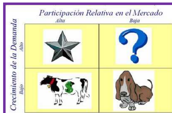
CUADRO 2.2.: Matriz BCG

Según la matriz BCG nuestra chocolatería podría ubicarse en el cuadrante superior derecho, es decir una Interrogante.