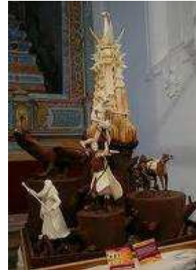
FIGURA 1.7.: Figura elaborada a base de chocolate fuera de lo común.

milkshakes, cocteles etc. serán elaborados al instante del pedido.