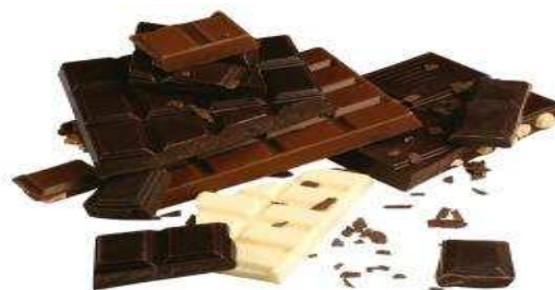
FIGURA 1.2.: Barras de Chocolate para la elaboracion de dulces y postres

La era industrial arrastró cambios fundamentales para el chocolate. España, el primer exportador de chocolate abre su primera fábrica de chocolate en 1780 en Barcelona, luego Alemania y Suiza continúan esta marcha hacia la industrialización de este plato.