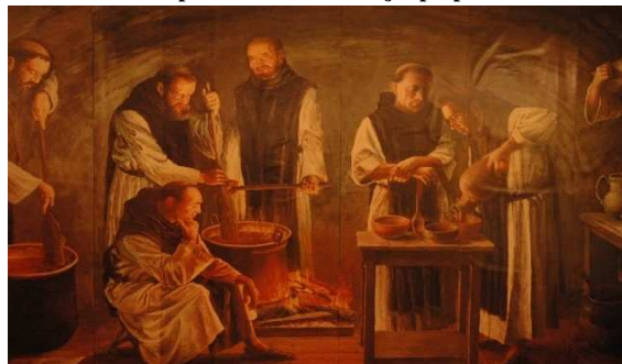
FIGURA 1.1.: Representación de monjes preparando chocolate.

Los Olmecas (1500 a 400 A.C.) fueron ciertamente los primeros humanos en saborear, en forma de bebida, las habas de cacao molidas, mezcladas al agua y adornadas de especias, guindillas y de hierbas (Teoría de Coe) y quienes comenzaron a cultivar el cacao en México. En el curso de los siglos, la cultura del cacao se extendió a las poblaciones mayas (600 A.C.) y aztecas (1400 A.C.). El haba entonces era utilizada como unidad monetaria y como unidad de medida, 400 habas equivalen a un Zontli y 8000 a un Xiquipilli. Al tiempo de las guerras entre aztecas, mayas y chimimeken, estos últimos utilizaban el haba como impuesto en las zonas conquistadas.