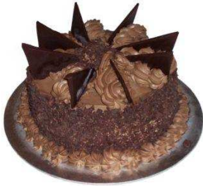
FIGURA 1.4.: Pastel elaborado a base de chocolate.

Postres.- Creaciones que se deshacen en la boca. Desde las mousses al delicado helado pasando por las cremas finas, con adornos especiales. Suflés.