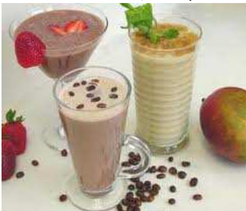
FIGURA 1.6.: Bebidas frías, calientes y cocteles.

Fuera de lo común.- Especialidades que se salen del marco habitual. Las más finas creaciones de nuestros chef para clientes más exigentes.