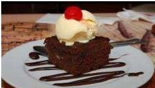
FIGURA 1.5.: Dulce de chocolate con helado de vainilla.

Bebidas.- Preparaciones frías y calientes. Líquidos mixtos con o sin alcohol, mezclados con leche o servidos con mantecado de chocolate.