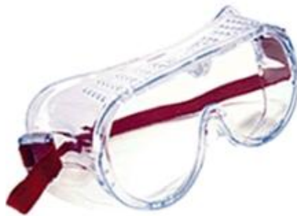
Fig. 2.10.2 gafas anti-impactos o anti. Golpes