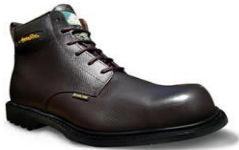
Fig. 2.15 botas aislante de la electricidad

la elaboración eléctrica, ya que en su diseño se le ha adherido en sus putas un aislante para la protección del individuo.