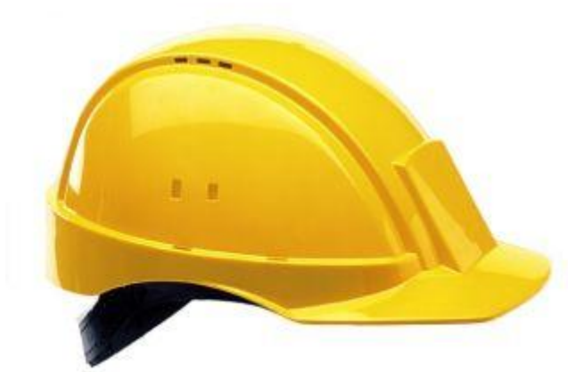
Fig.2.10.1 casco protector de la cabeza

Existen también cascos con dispositivos de conexión desmontables para protectores faciales, y auditivos.