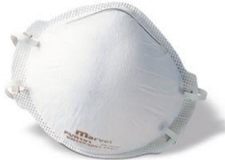
Fig. 2.11 mascarilla de papel auto filtrante

Los E.P.R., equipos de protección respiratoria, protegen al usuario de riesgo de muerte o lesiones graves, pertenecen a la Categoría III de los EPI.(equipo de protección individual).