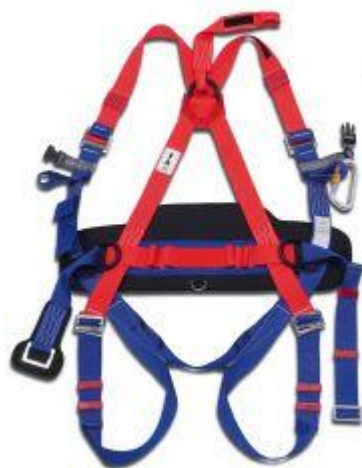
Fig. 2.13 arnés anti caída con cinturón de posicionamiento

Para todos los trabajos con riesgos de caída de altura será de uso obligatorio el uso del arnés anti caída con cinturón de posicionamiento.. Llevarán cuerda de amarre o salvavidas de fibra natural o artificial, con mosquetón para sujetarse. La longitud será la adecuada para que no permita una caída en un plano inferior, superior a 1,50 m de distancia.