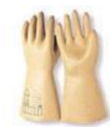
Fig. 2.14 guantes aislantes de la electricidad

Se utilizarán cuando se manejen circuitos eléctricos o máquinas que estén o tengan posibilidad de estar con tensión.