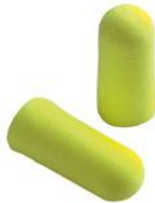
Fig. 2.12 tapón anti ruido

Existen dos tipos de protectores auditivos: auriculares y tapones; en este caso el cual el trabajador deberá utilizar son los tapones. Ya que por circunstancias el no estará trabajando en una área que sobrepase a los 30 decibelios. Y según la norma UNE- EN 352 este es el indicado para dicha labor.