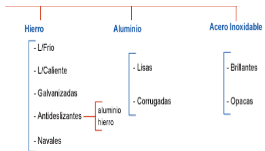
Figura 1. Planchas y otros

A continuación se detalla algunos de los productos que la compañía comercializa.