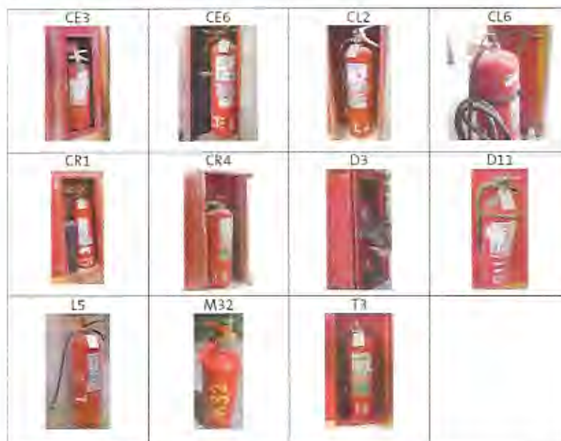
Tabla No. 4: Muestra de extintores seleccionada aleatoriamente