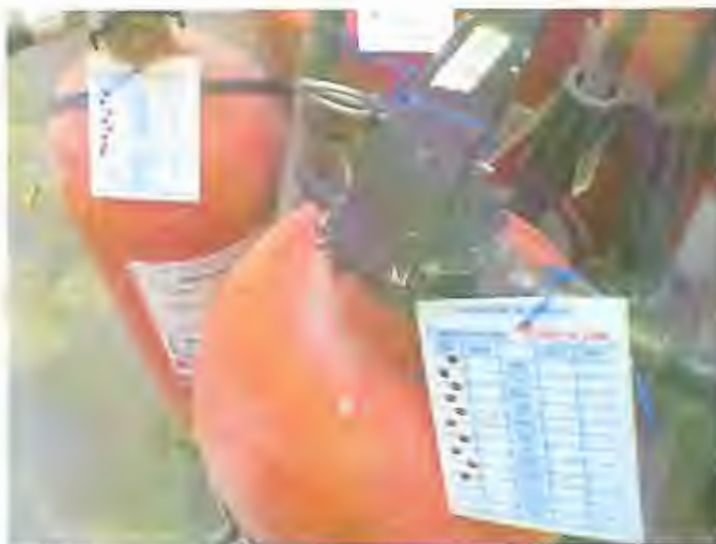
Fotografía No. 1: Extintores con varios meses de no haber sido revisados