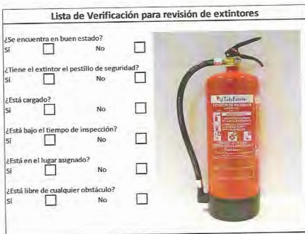
Tabla No. 1: Lista de verificación para revisión de extintores