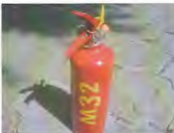
Fotografía No. 2: Extintor con nuevo código