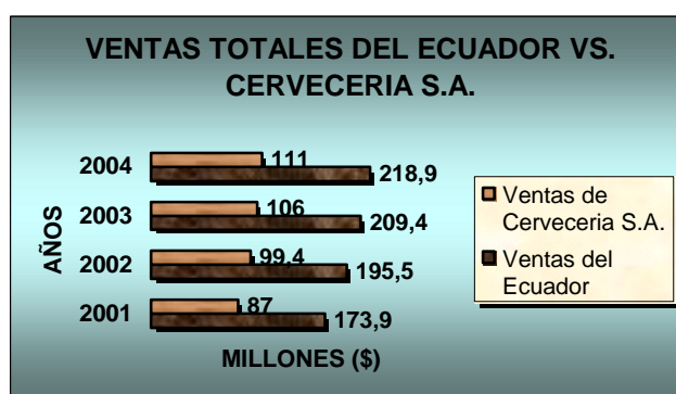
Gráfico 1 Ventas Totales del Ecuador Vs. Ventas de Cervecería S.A.

A continuación se presenta un cuadro de las ventas de Cerveza del Ecuador en Millones de dólares en donde se nota que en el último año las industrias cerveceras vendieron la cifra récord de $210 millones: