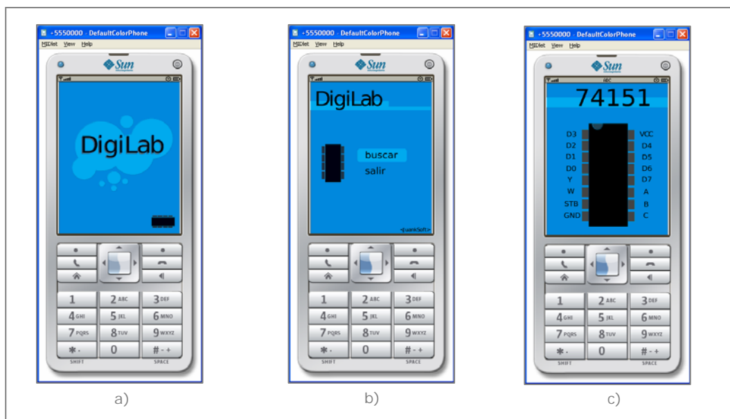
Figura 2. Aplicación Móvil.

Este trabajo se pudo llevar a cabo gracias a la estandarización W3C de imágenes SVG Tiny investigado por TAWS y a la Ing. Carmen Vaca por su ayuda en la redacción de este trabajo.