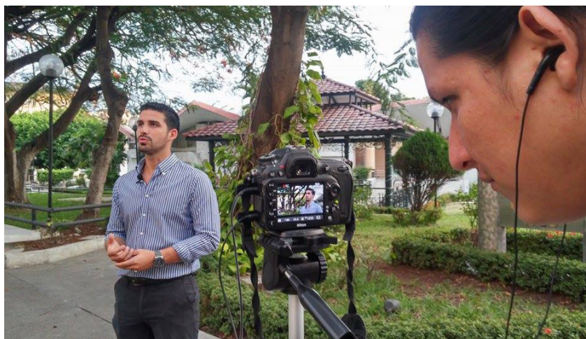
Imagen: Estudiante haciendo entrevista en la espae