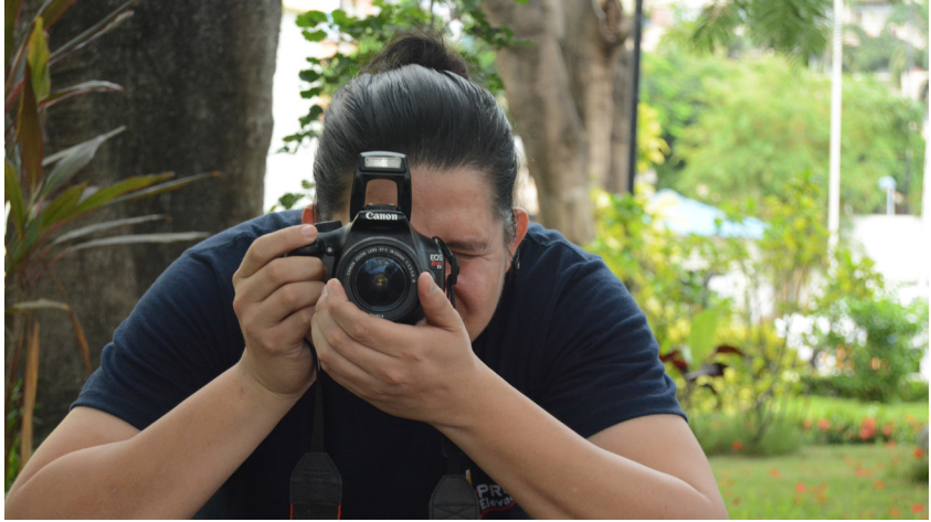
Imagen: Estudiante haciendo entrevista en la espae