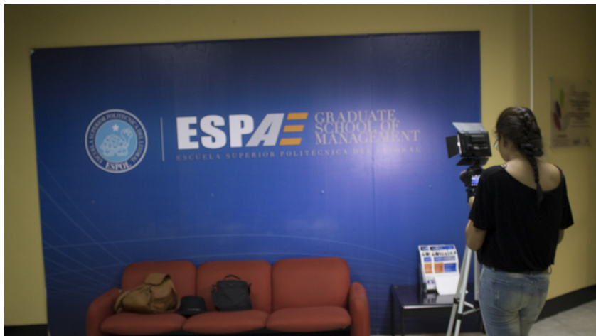
Imagen: Estudiante haciendo entrevista en la espae