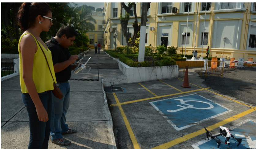
Imagen: Estudiante haciendo entrevista en la espae