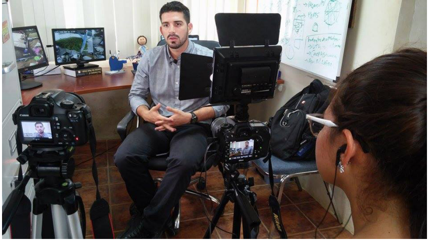
Imagen: Estudiante haciendo entrevista en la espae