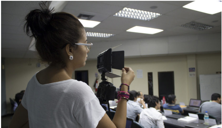
Imagen: Estudiante haciendo entrevista en la espae