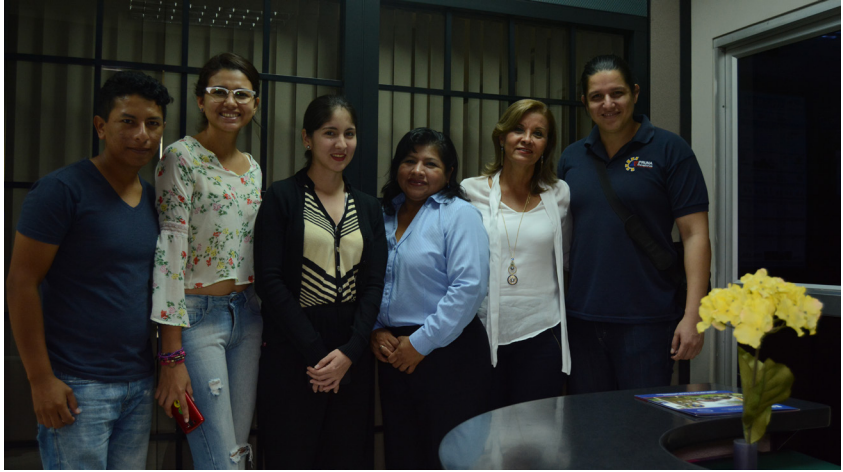
Imagen: Estudiante haciendo entrevista en la espae