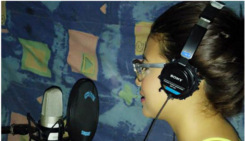
Imagen: Estudiante haciendo entrevista en la espae