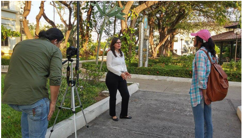
Imagen: Estudiante haciendo entrevista en la espae