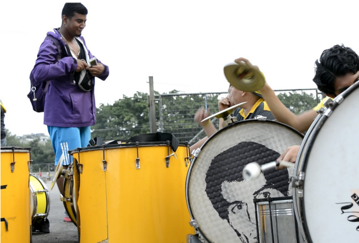
Integrantes de la banda esperando para entrar al Monumental