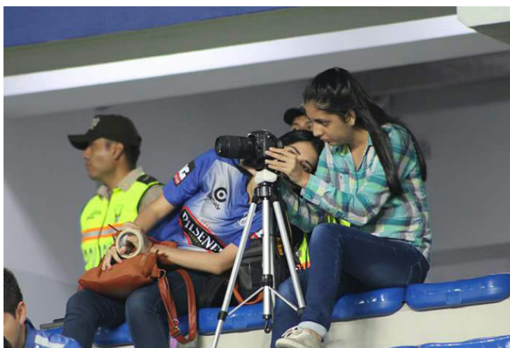
Detrás de cámaras en el estadio George Capwell de Emelec