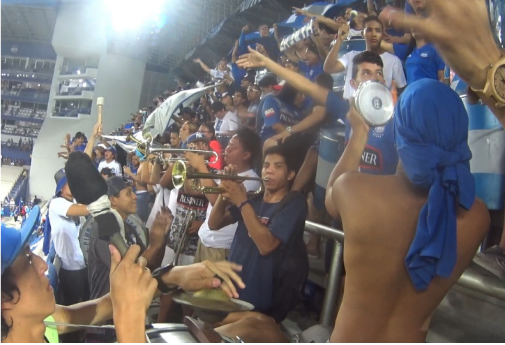
Banda La Boca del Pozo alentando a su Club Sport Emelec