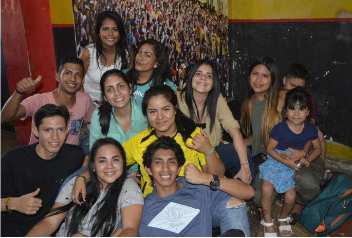
Integrantes de la Barra Zona Norte de Barcelona