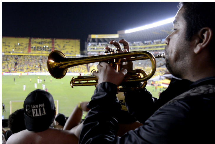
Integrantes de la banda dentro del estadio alentando a su equipo