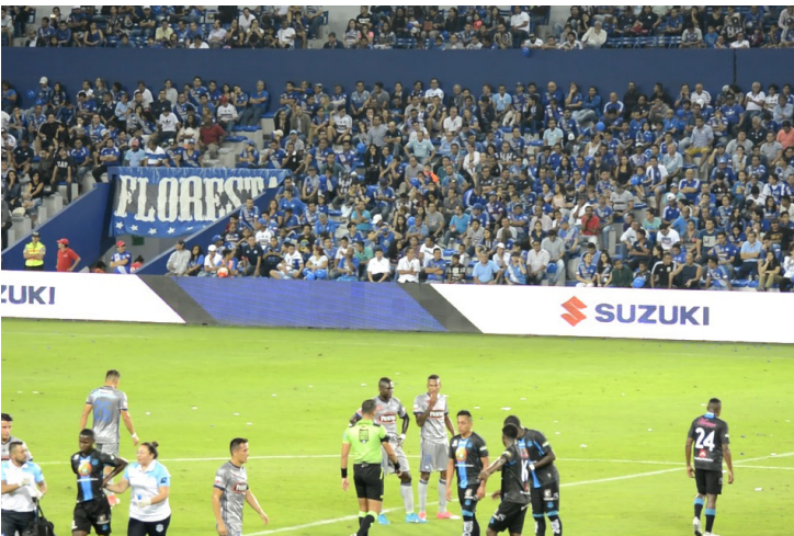
Jugadores del Club Sport Emelec vs Macará