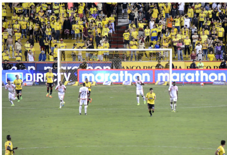
Jugadores del Barcelona Sporting Club vs Fuerza Amarilla