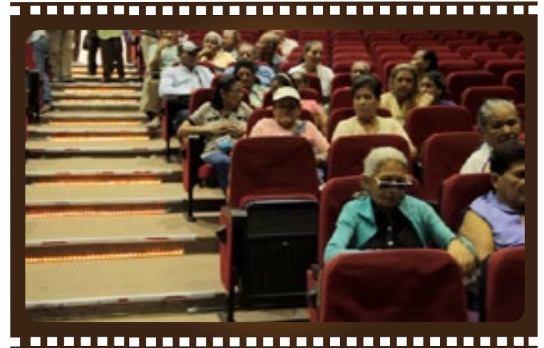
■ Público asistente