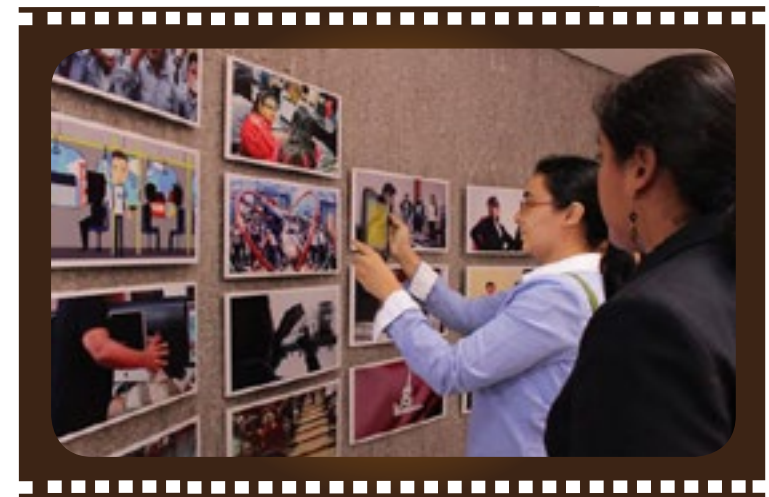
Reproducción del video