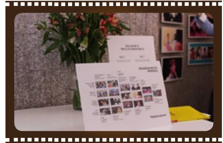
Exposición del producto audiovisual

Se diseñó el esquema y planificación a seguir en cuanto a la pre-producción, producción y post-producción del video reportaje, siguiendo las tendencias identificadas en la investigación para los grupos objetivos. Además, se realizó el audiovisual en tiempo récord—un mes más cuarenta y cinco días de proceso creativo y pre producción—y a costo reducido, puesto que un registro de similares características requiere mayor inversión de tiempo y presupuesto.