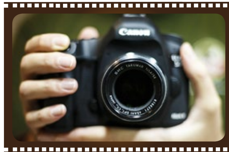
■ Equipos utilizados

En cuanto al equipo técnico se usaron los siguientes equipos: Cámaras Canon 7D con objetivos Canon originales de 50 mm y 18-135 mm, trípode de 160 cm de altura, Rig estabilizador para hombro Opteka csx 600, micrófono omnidireccional conectado a un Handy recorder Zoom H4 para captura de audio, luces y rebotadores para uso de video, entre otros equipos auxiliares.