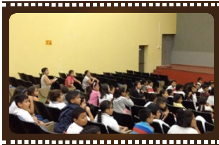
Asistentes de Cine Foro

Los siguientes valores están sujetos a los costos que establece el mercado ecuatoriano actual, los mismos que, se optimizaron para aprovechar de forma eficiente el presupuesto final estimado. Se receptaron cotizaciones y proformas de productoras locales como Metrópolis Publicidad, Celmedia S.A., HP Producciones, Dolly Producciones, y Prime Voices, para luego, basados en precios preferenciales, poder negociar con el equipo involucrado y acordar los valores finales por cada concepto. Vale recalcar que muchos de los costos fueron acordados después de varias negociaciones, en especial con el presentador que trabajó en el proyecto audiovisual.