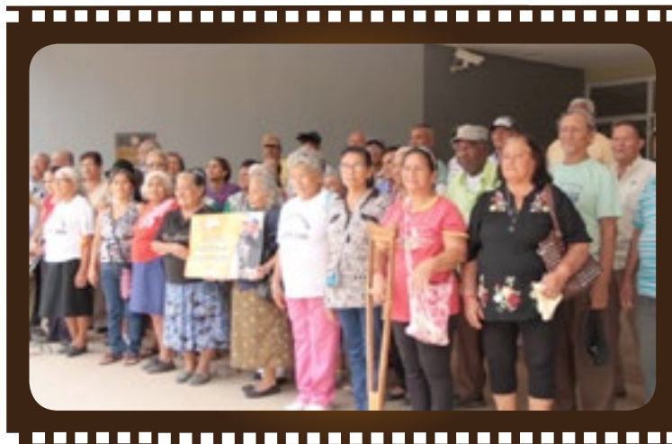
Asistentes de Cine Foro