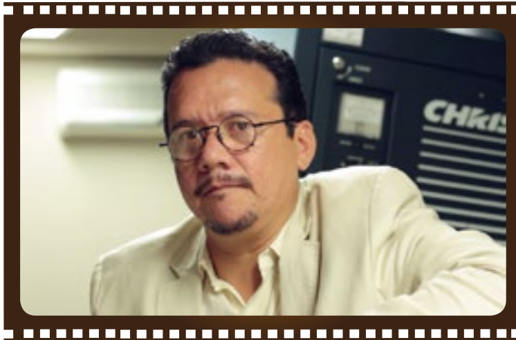
■ Marcelo Báez - Crítico de cine y escritor