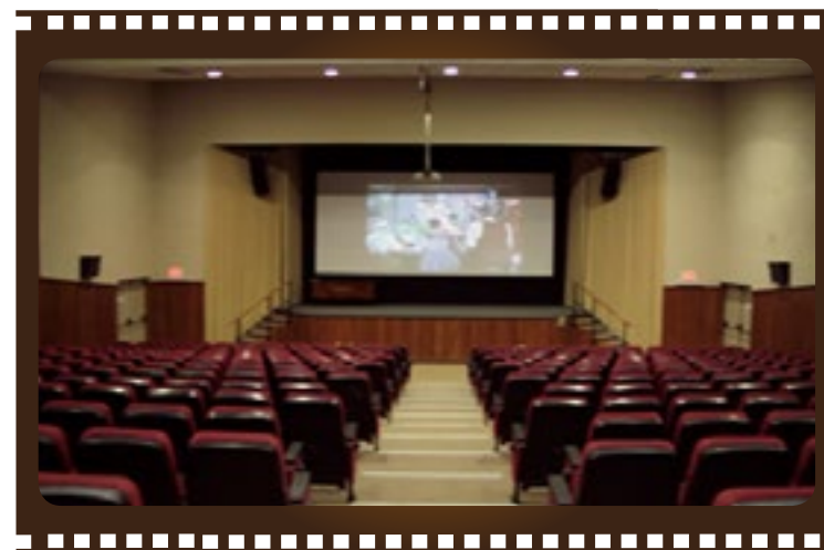
■ Auditorio de la FIEC