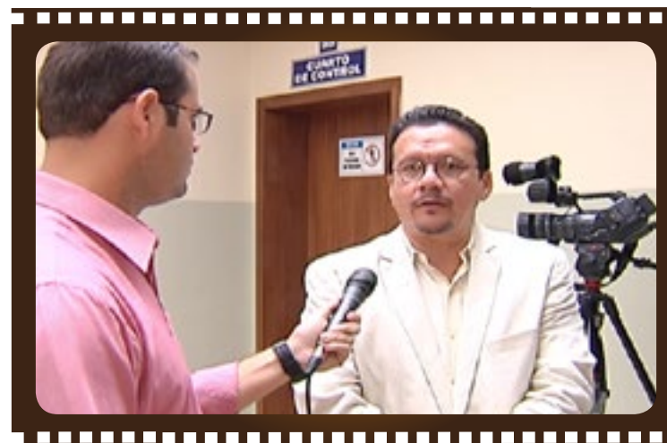
■ Equipos utilizados