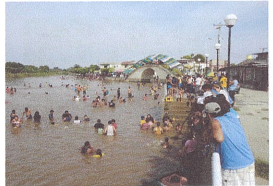
Ilustración 5: Balneario General Vernaza