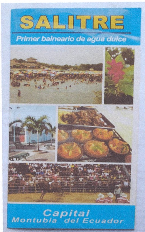
Ilustración 10: Tríptico: Salitre, primer balneario de agua dulce. Atractivos del cantón.