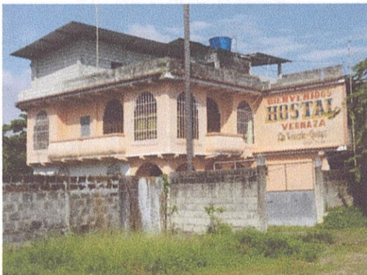
Ilustración 6: Hostal Vernaza