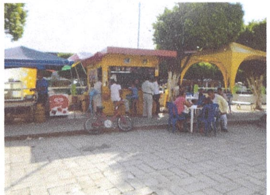
Ilustración 7: Kiosco de víveres