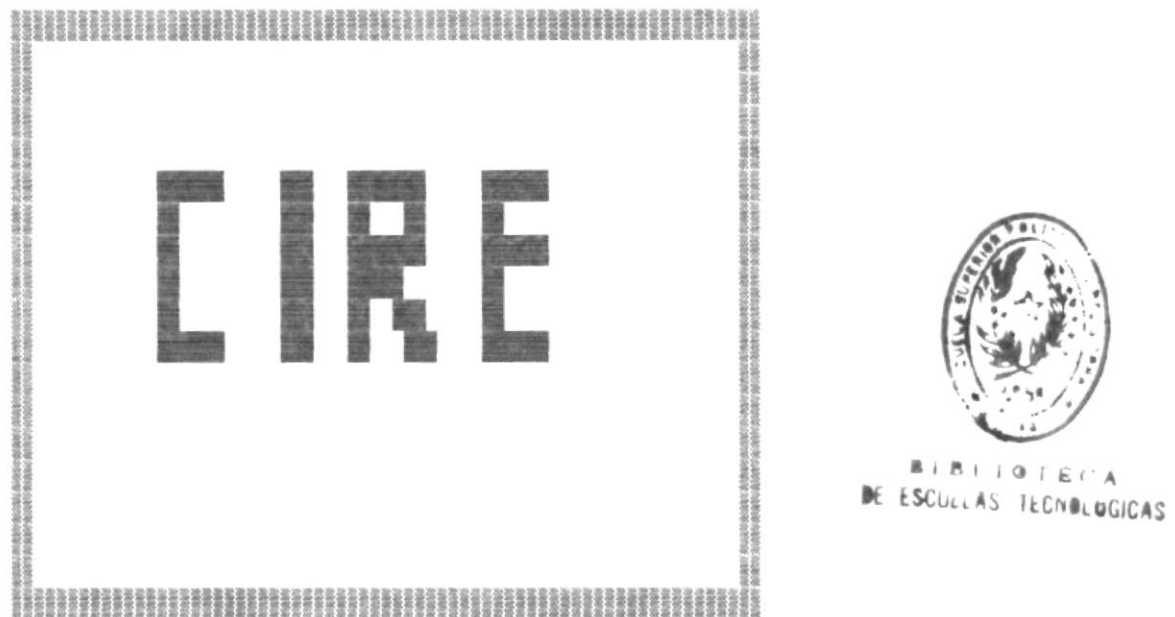
Figura 3.1 Pantalla del Presentación del Sistema

En este momento se ejecuta el sistema presentando la pantalla de presentación del sistema (Figura 3.1)