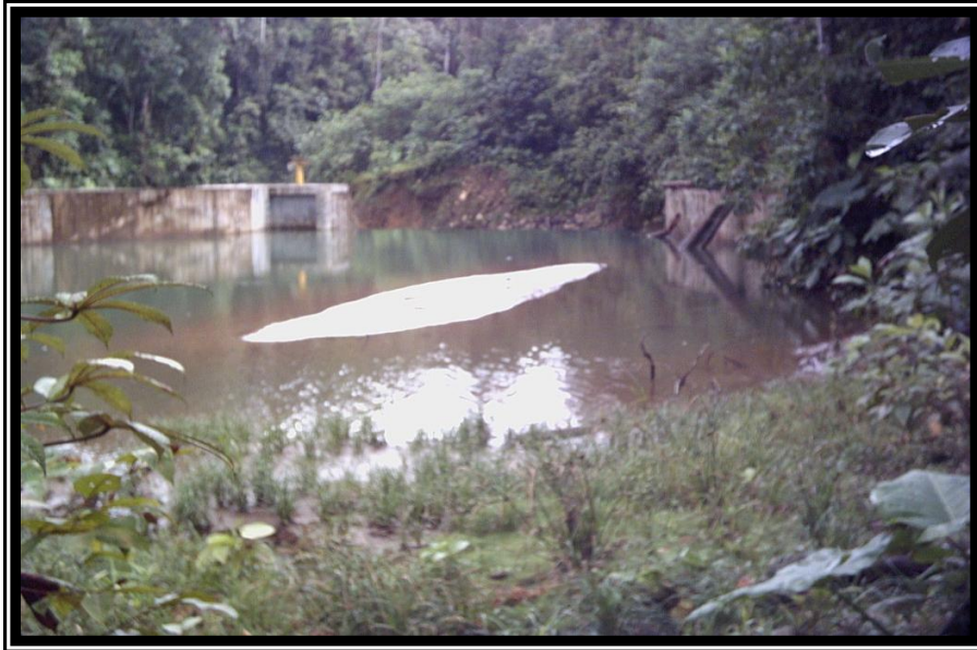
Fotografía 3. Vista de la acumulación de sedimentos en la zona del embalse