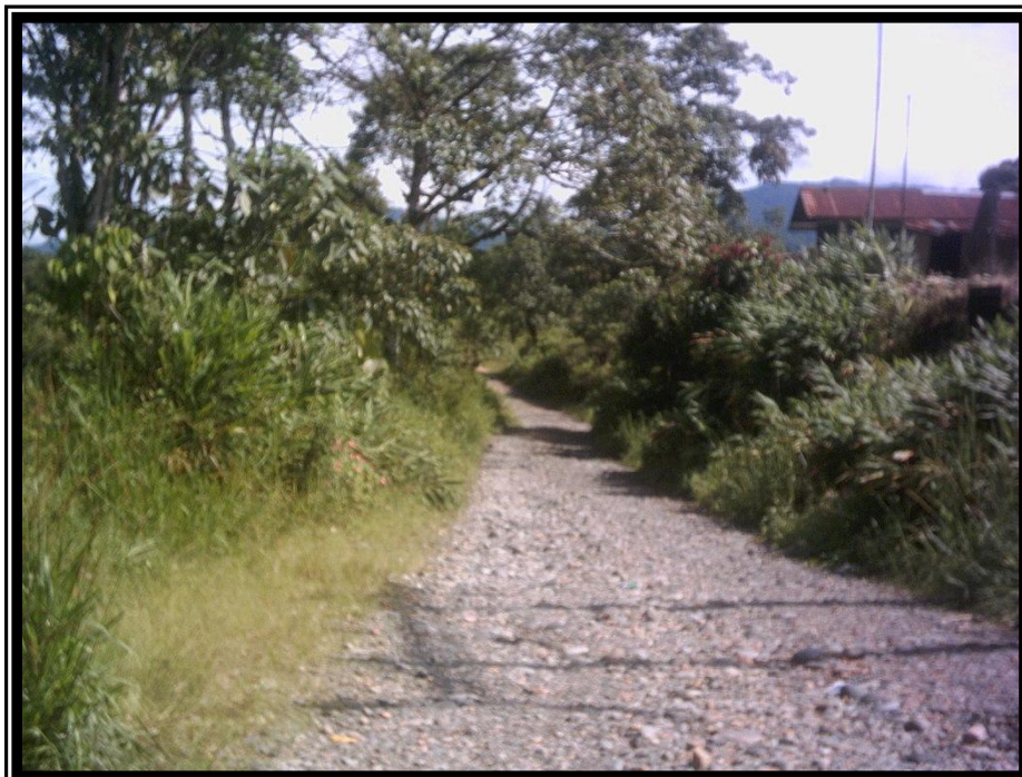
Fotografía 2. Vía de acceso existente al área de la Cuenca del Río Tatalá