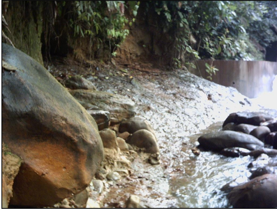
Fotografía 5. Se observa en primer plano material consolidado tipo lahar sobre la cual descansa la capa de suelo