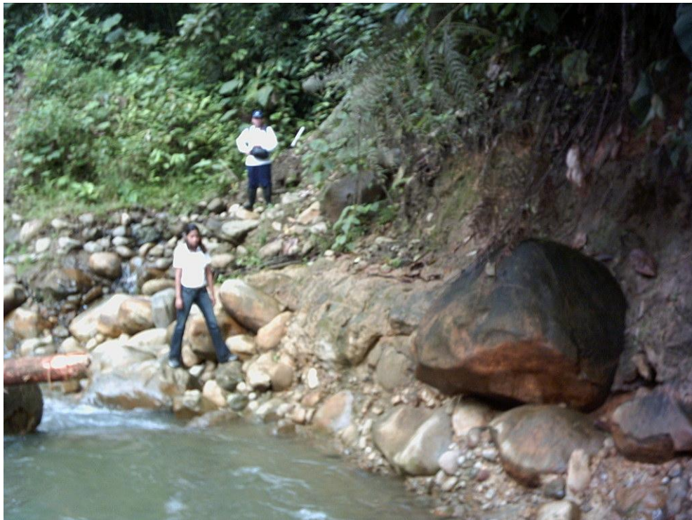
Fotografía 6. Material granular depositado en el cauce del río. Especialistas de cuenca de drenaje durante el trabajo de campo