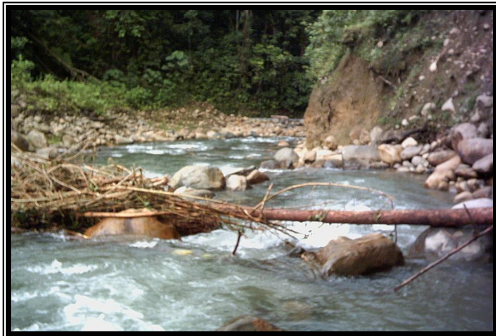
Fotografía 4. Depósitos de sedimentos y transporte de troncos de árboles por energía hidráulica