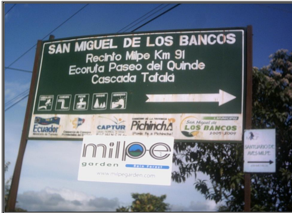
Fotografía 1. Señal de Acceso de la Cuenca Alta del Río Tatalá