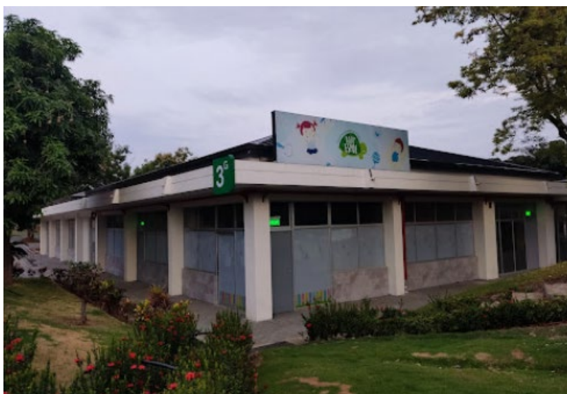
Figura 1. Imagen de las instalaciones del Centro de Desarrollo Infantil (CDI) “Baby ESPOL” en el campus Gustavo Galindo V.

Este lineamiento será aplicable para la gestión del CDI “Baby ESPOL” el cual prestará el servicio a los profesores, estudiantes, personal administrativo y código de trabajo de la ESPOL. El CDI está situado en la parte posterior de la Facultad de Ciencias de la Vida.