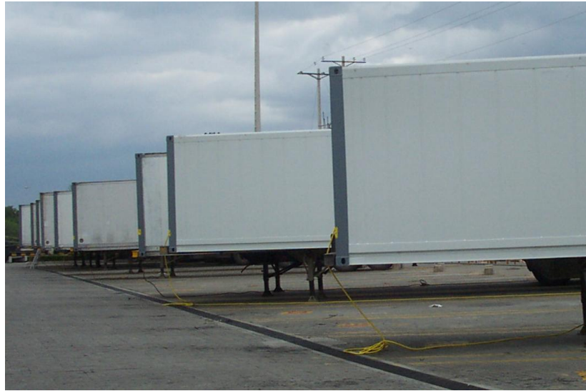
Figura 2.3. Almacenamiento sobre Chasis

El proceso de almacenamiento de contenedores, ya sea en cualquiera de las dos formas, finaliza con la conexión del contenedor a la fuente de poder . Esta labor la realiza el personal de operaciones.