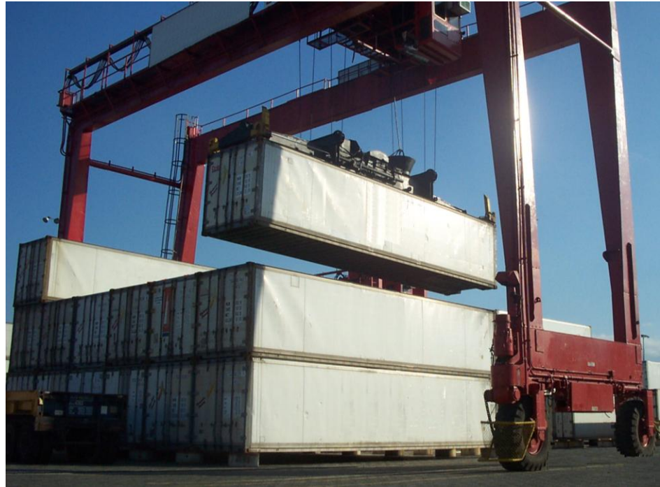
Figura 2.2. Almacenamiento en Stacking

La zona de almacenamiento en “stacking” tiene cuatro niveles de altura y los contenedores son depositados de acuerdo a la planificación que tenga el departamento de operaciones.