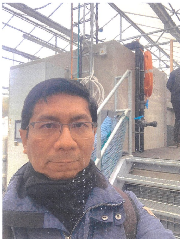
Ilustración 2. Visita al Mesocosmos donde se ejecutan experimentos en torno a las propiedades del manglar como atenuador de niveles extremos de marea en estuarios.