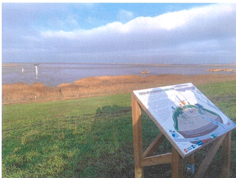
Ilustración 3. Visita a Estación Científica en Hedwige-Prosperpolder (Bélgica-Holanda), para el seguimiento de la captura de carbono neta obtenida por el proyecto de restauración de la zona intermareal WETCOAST.