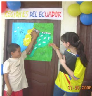
Figura 2. Identificación de las Regiones del Ecuador