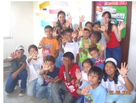
Figura 3. Participantes