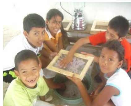
Figura 4. Elaboración de papel de reciclaje