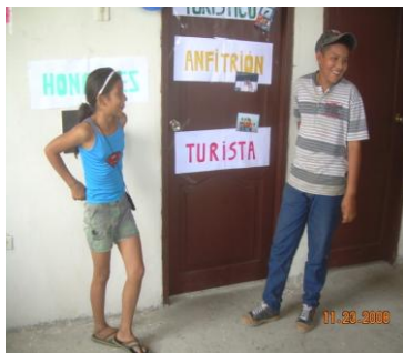
Figura 1. Sketch (turista y anfitrión)