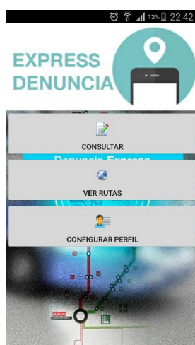
Figura 5.1: Pantalla de inicio.

Las figuras 5.1, 5.2, 5.3, 5.4 muestran las interfaces de la aplicación que reflejan los requerimientos del software: