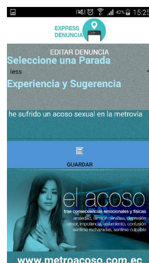
Figura 5.4: Edición de Denuncias.