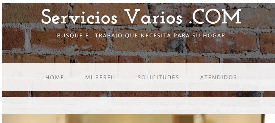
Figura 2.9: Pantalla de Bienvenida de trabajadores.

El módulo Trabajador ofrece opciones para los usuarios de los diferentes servicios que serán buscados y consultados por los usuarios Clientes, cuya pantalla de bienvenida lo vemos en la figura 2.9, este perfil tendrá a su alcance las siguientes opciones: