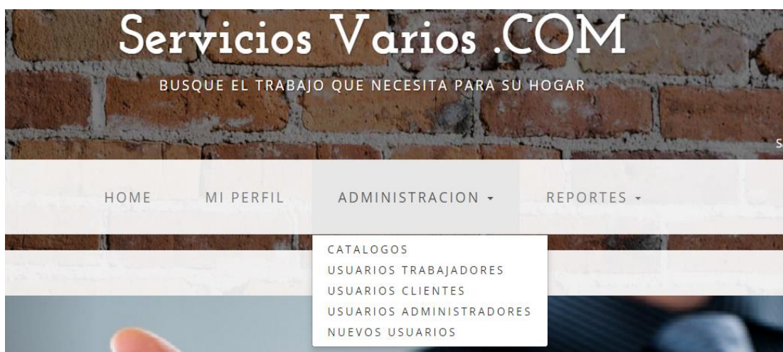
Figura 2.3: Pantalla de Bienvenida de Administrador.

El módulo Administrador , se encarga de administrar los diferentes datos y catálogos que utilizan los otros módulos, como lo muestra la figura 2.3, este contará con las siguientes opciones: