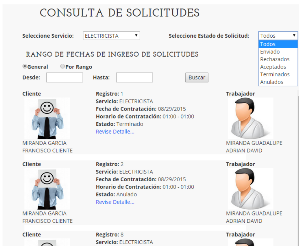
Figura 2.6: Pantalla modelo de Reporte de Administrador.