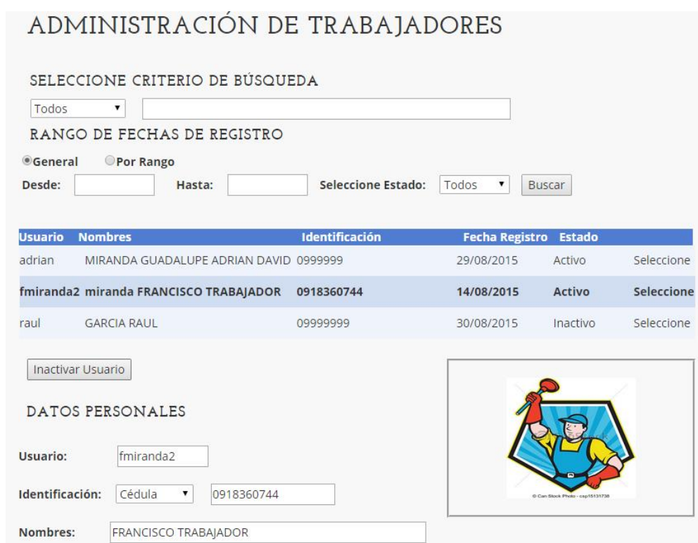
Figura 2.5: Pantalla modelo de Administración de usuarios.