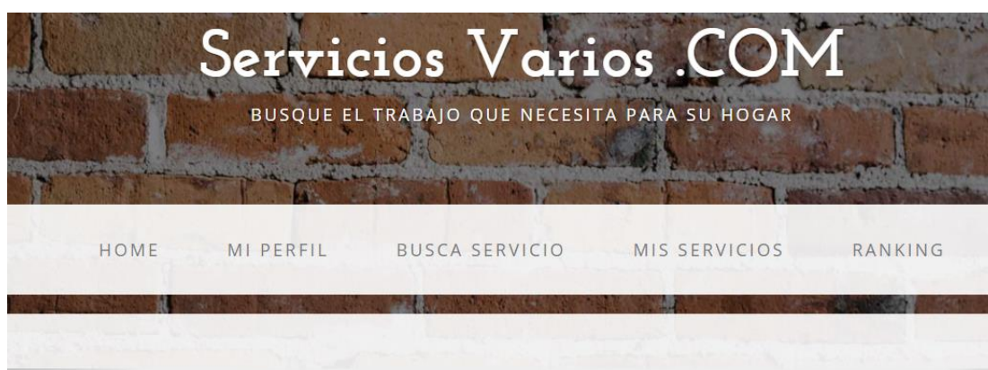
Figura 2.7: Pantalla bienvenida de Clientes.

El módulo de Cliente , permitirá buscar los servicios que ofrecen los usuarios trabajadores, cuya pantalla de bienvenida lo vemos en la figura 2.7, este perfil contará con las siguientes opciones: