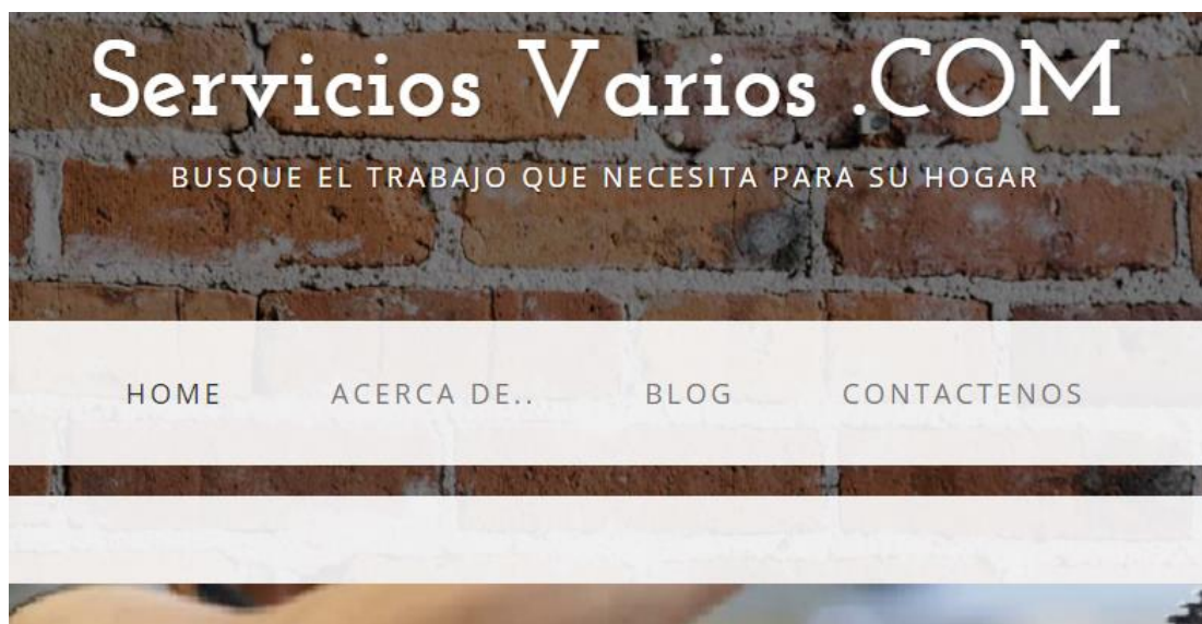
Figura 2.2: Pantalla Home de Bienvenida.