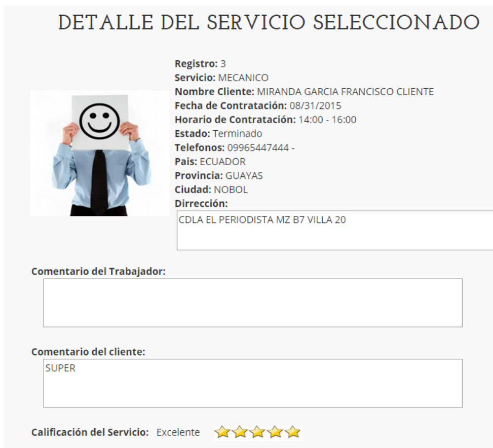
Figura 2.10: Pantalla modelo de consulta de servicio de trabajadores.