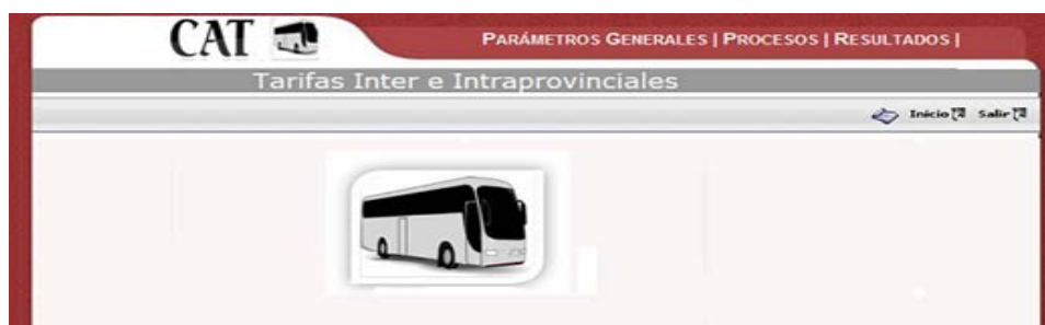
Figura 3. 1 Menú del Sistema