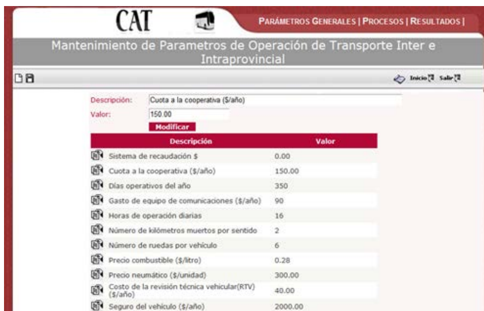
Figura 3. 5 Mantenimiento Parámetros

Registra los costos de operación del transporte.