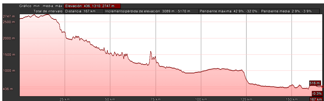
Figura 2. 5 Perfil longitudinal de la ruta Ambato-Tena: terreno llano y ondulado

Las perfiles longitudinales proporcionadas por la Cartografía de Google muestran la variedad de rutas que puede existir entre la costa y la sierra. También conlleva a una variedad de costos debido al consumo de combustible, gasto de neumáticos, tiempo de viaje.