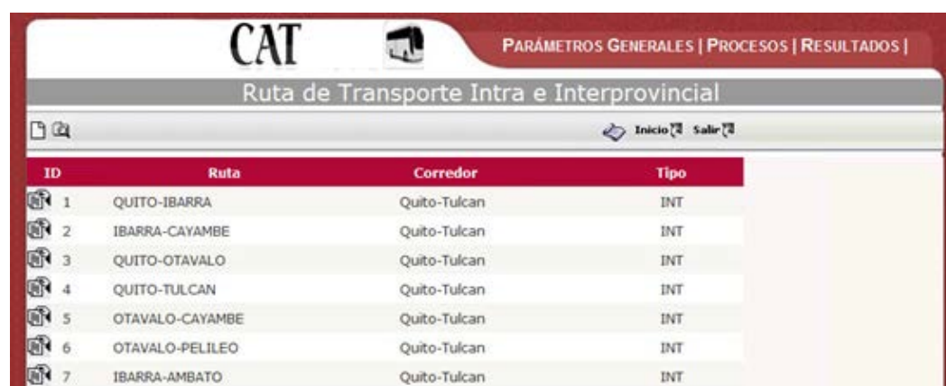
Figura 3. 6 Mantenimiento Rutas

Registra las rutas entre un origen y un destino por ejemplo entre Guayaquil y Quito.