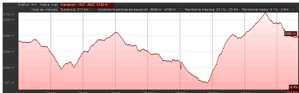
Figura 2. 2 Perfil longitudinal de la ruta Quito-Tulcán: terreno accidentado

Del análisis de estos datos podemos ver que van a existir servicios de transporte que contienen costos distintos. Por un lado, los servicios que transitan por recorridos accidentados y que incurren en costos operativos significativamente mayores (consumo de combustible, desgaste de neumáticos y mayor tiempo de viaje); y por otro, los servicios que transitan por terrenos mayoritariamente llanos y que tienen unos costos operativos menores. Ejemplos de esta categorización pueden verse en la Figura 2.2, Figura 2.3, Figura 2.4 y Figura 2.5, para distintas rutas con diferenciadas características según lo anteriormente especificado.