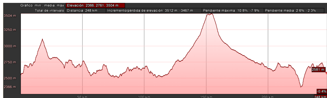
Figura 2. 3 Perfil longitudinal de la ruta Otavalo-Pelileo: terreno accidentado