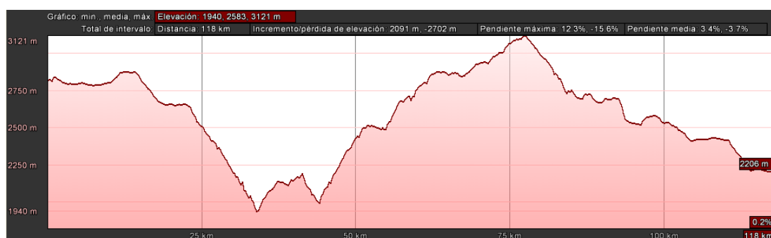
Figura 3. 12 Perfil longitudinal de la ruta Quito-Ibarra

kilómetro recorrido. En este caso, el consumo de carburante se sitúa en 0,51 litros/km (equivalente a 7,43 km/galón) debido a lo accidentado del terreno. El factor de desgaste del neumático se sitúa en 2,75 \cdot 10^{-4} km de vida útil por km recorrido, lo que equivale a 0,005$/km si se suponen 6 ruedas por autobús a 300$ cada neumático.