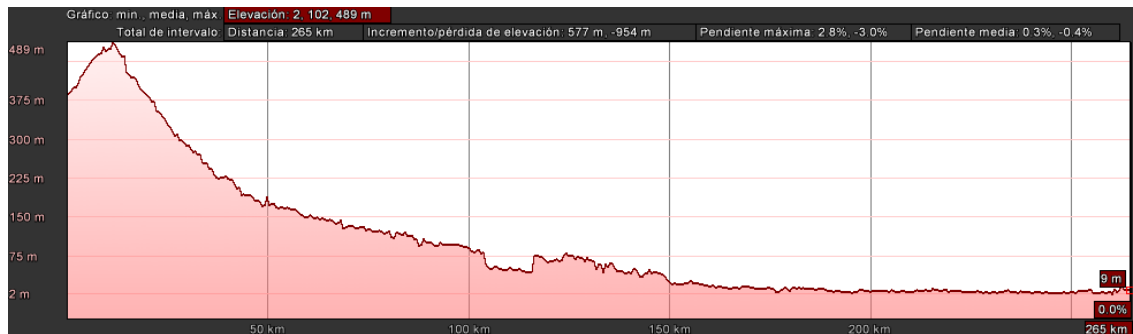
Figura 2. 4 Perfil longitudinal de la ruta Sto.Domingo-Guayaquil: terreno llano y ondulado