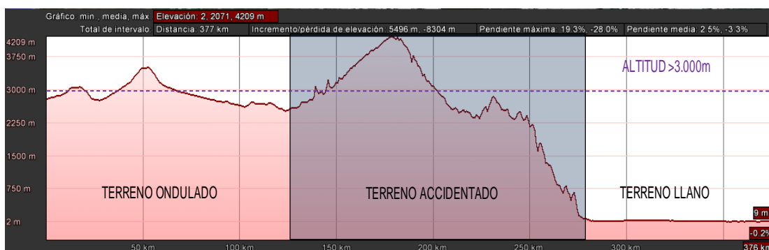
Figura 2. 1. Perfil longitudinal de la ruta Quito-Guayaquil

Un ejemplo gráfico de la anterior caracterización de rutas puede verse en la Figura 2.1 para el trayecto entre Quito y Guayaquil.