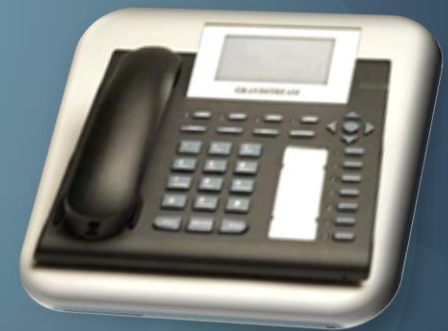
Teléfono IP Grandstream GXP2000