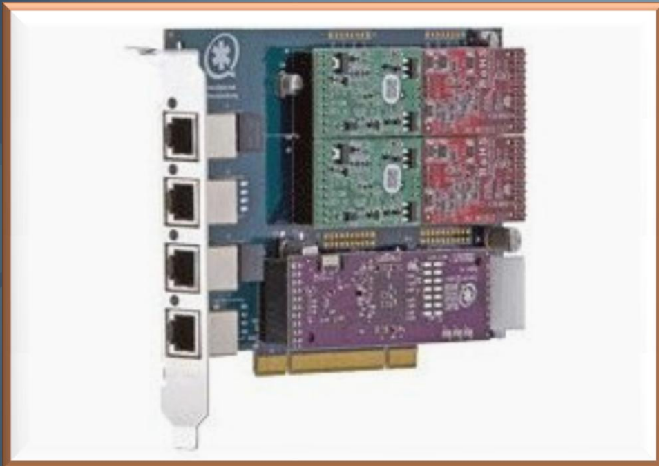
Marca Digium TDM410p 4 puertos

Sirve para configuración de hardware a alto nivel.