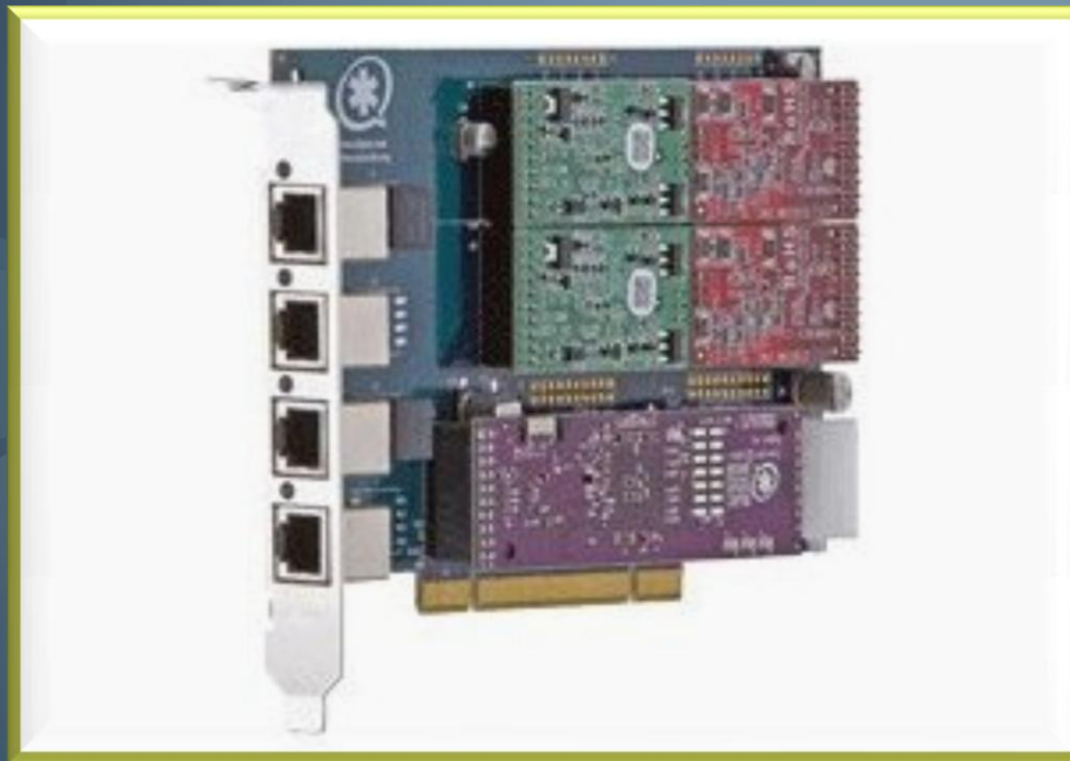
Marca Digium TDM410p 4 puertos

Sirve para configuración de hardware a bajo nivel.