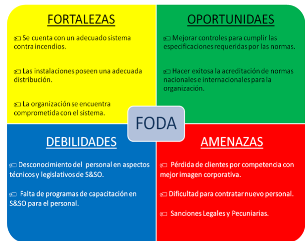
Figura 4. Análisis FODA

La evaluación de las fortalezas y las debilidades de los recursos de la empresa, así como las oportunidades y amenazas externas, proporciona una perspectiva para determinar la posición de la empresa.