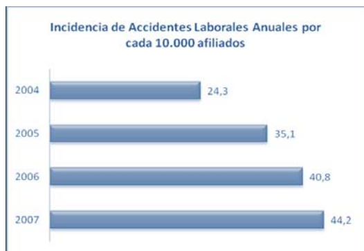
Figura 1. Incidencia de accidentes

Resulta de gran importancia contar con un programa de seguridad y salud ocupacional adecuado que ayude, no solo a preservar los recursos de la empresa sino también motive al personal a realizar sus labores con seguridad y cree un sentimiento de confiabilidad laboral para lograr así un mejor desempeño de sus actividades.