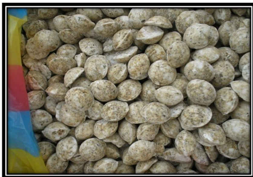
FIGURA 1.4. BRIQUETAS DE UREA CON ZEOLITA

En el presente ensayo también se aplicara briquetas de urea con zeolita en el cultivo de arroz. Ver figura 1.4.