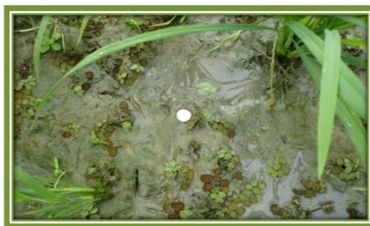
FIGURA 1.6. (APBU) EN EL CULTIVO DE ARROZ