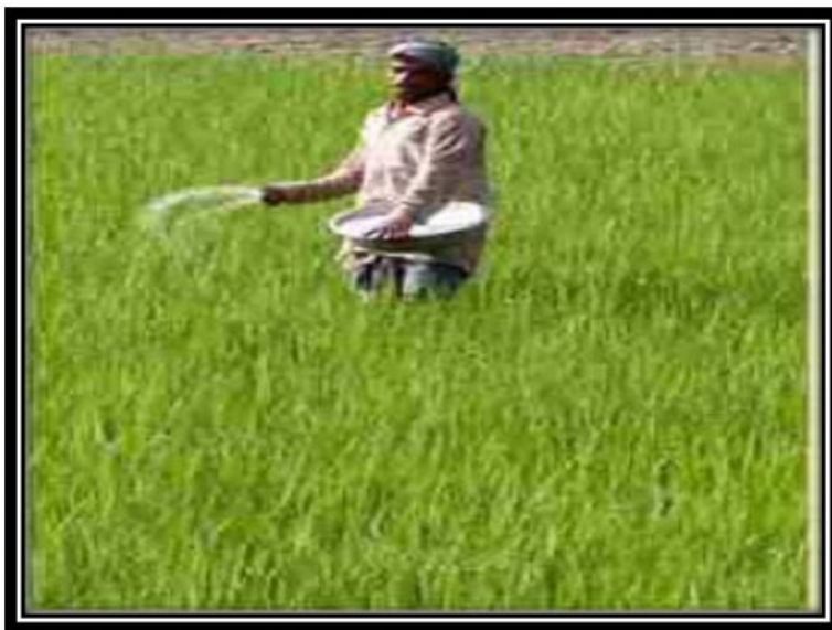
FIGURA 1.1. MÉTODO DE FERTILIZACIÓN AL VOLEO (W. BOWEN IFAS).

para ser voleada (11). (Ver figura 1.1) Método de fertilización al voleo (W. Bowen IFAS).