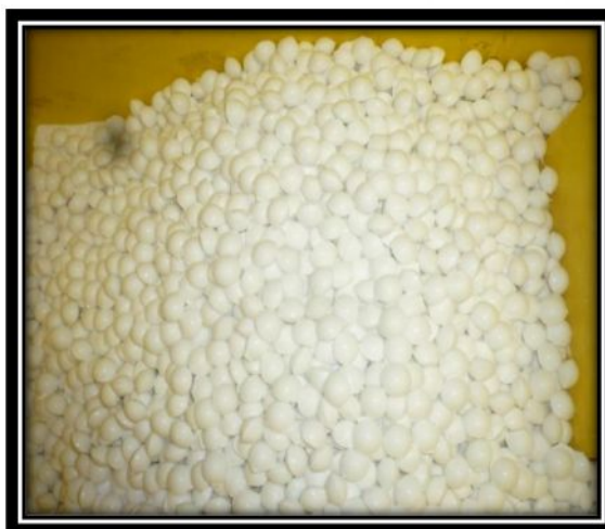
FIGURA 1.2. BRIQUETAS DE UREA

lentamente descompuestas por los microbios del suelo. De acuerdo a Wargo, otra ventaja de este procedimiento es que al calentarse el suelo, la actividad microbiana se incrementa, al igual que el nitrógeno disponible. Esto trabaja en armonía con el cultivo, porque al incrementar las temperaturas del suelo, se incrementan también las necesidades nutricionales de su cultivo (11) (9). Ver, figura 1.2.