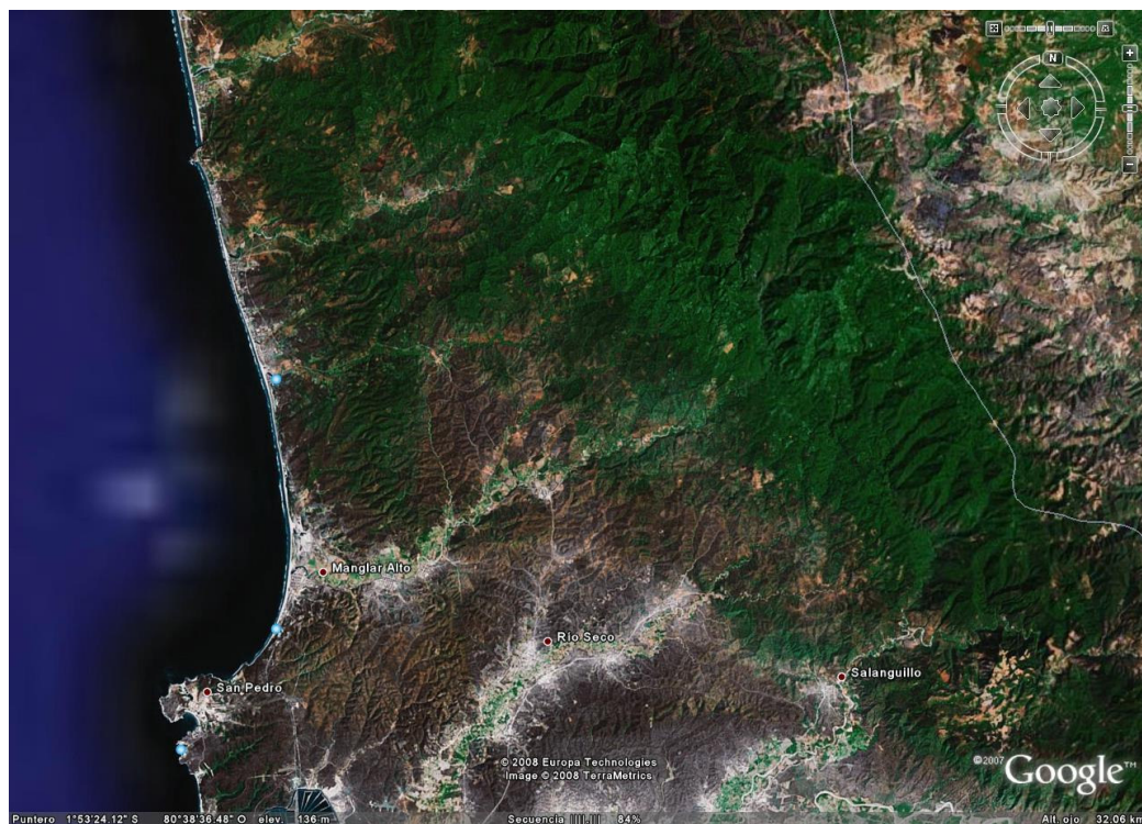
Figura # 1. Perfil Costanero de la zona de estudio.