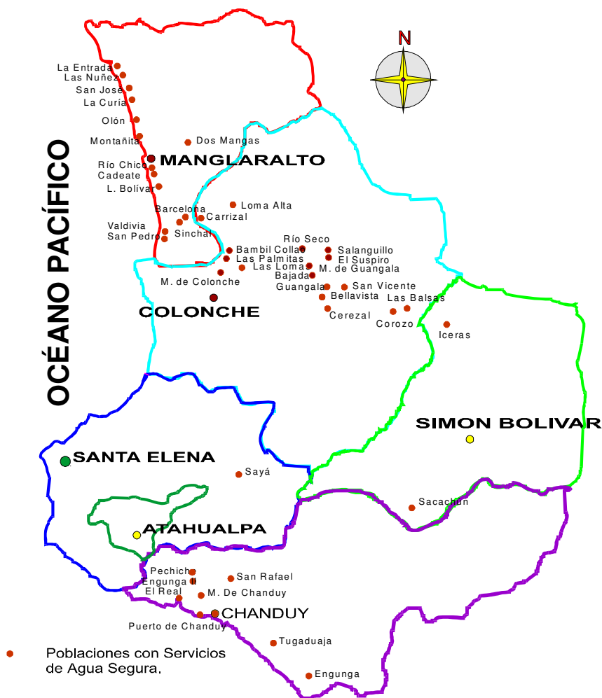
Figura # 2. Poblaciones con suministro de agua segura.

Existen comunidades rurales a las cuales el servicio de Agua Potable todavía no ha llegado, estas comunidades se abastecen de agua a través de pozos ubicados en sus localidades y que no se encuentran en la actualidad regulados (5). El 46,35% de la población recibe agua potable de tanqueros repartidores, el 42% de pozo, sólo el 6,25% de la población está conectada a las redes domiciliarias, el 4,45% se abastece de agua de los ríos, vertientes o acequias, y el 0.87% de la población se abastece de otros medios (10).