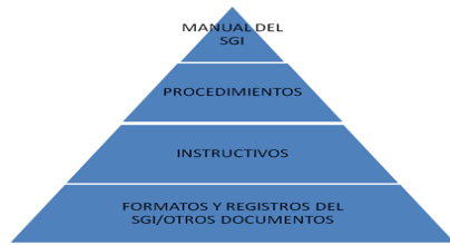
Figura 3 Representación de pirámide documental del SGI