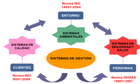
Figura 2 Esquema del Campo de Aplicación del SGI

OHSAS 18001:2007 “Sistema de Gestión en Seguridad y Salud Ocupacional. Requisitos”