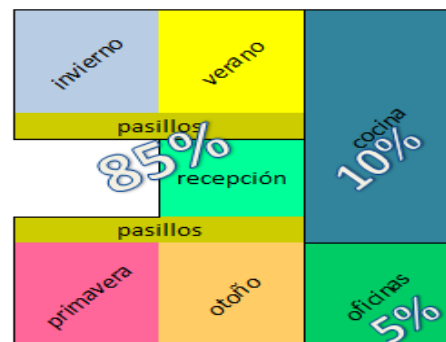
Figura 2. Distribución del área del restaurante

La infraestructura del local necesitara un espacio de 90 m2 de los cuales se los dividirá de la siguiente manera: los 90 m2 representan el 100% de los cuales el 85% se lo utilizará para la construcción de la recepción y de las cuatro áreas temáticas del restaurante, el 10% se lo utilizará para la cocina y el 5% restante para las oficinas.