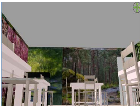
Figura 6. Área primavera