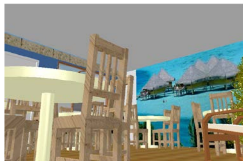
Figura 3. Área verano