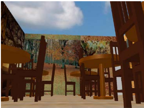
Figura 5. Área otoño