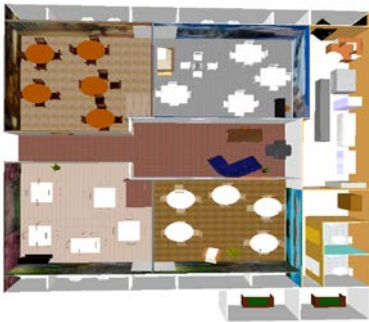
Figura 1. Vista aérea del restaurante

Primavera: Se caracterizará por utilizar colores fuertes en su decoración será un área llena de flores y pero que brindará pero que brindará un ambiente para todo tipo de género.