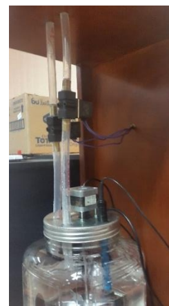
Figura 5. Vista Superior de Envase de Prototipo.

Lo que respecta a los sensores y los demás actuadores se pueden apreciar en la Figura 5 en la cual tenemos una vista superior del envase pudiendo observar el sensor de pH, conductividad eléctrica y de temperatura, adicionalmente también se distinguen las electroválvula y el sistema de agitación que principalmente lo forma el motor.