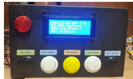
Figura 4. Tablero de Administración local Prototipo.

El tablero de administración local se observa en la Figura 4 en la cual se visualiza que en la pantalla de LCD se muestran los parámetros de medición de calidad de la mezcla, también se aprecia uno de los actuadores que es la luz piloto que nos indica si alguno de los parámetros está fuera del rango normal.