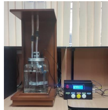
Figura 3. Prototipo final.

En el presente apartado se muestra a través de imágenes las distintas funcionalidades del proyecto y como es el resultado final después de su diseño y construcción.