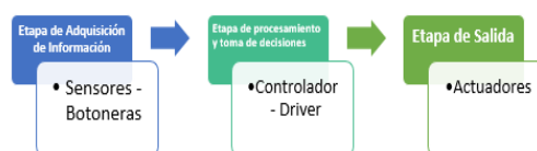
Figura 1. Etapas para el diseño del sistema de control

Considerando los requerimientos del sistema se decidió separar el diseño en varias etapas para tratar cada sección de manera independiente. Las etapas establecidas fueron las siguientes: