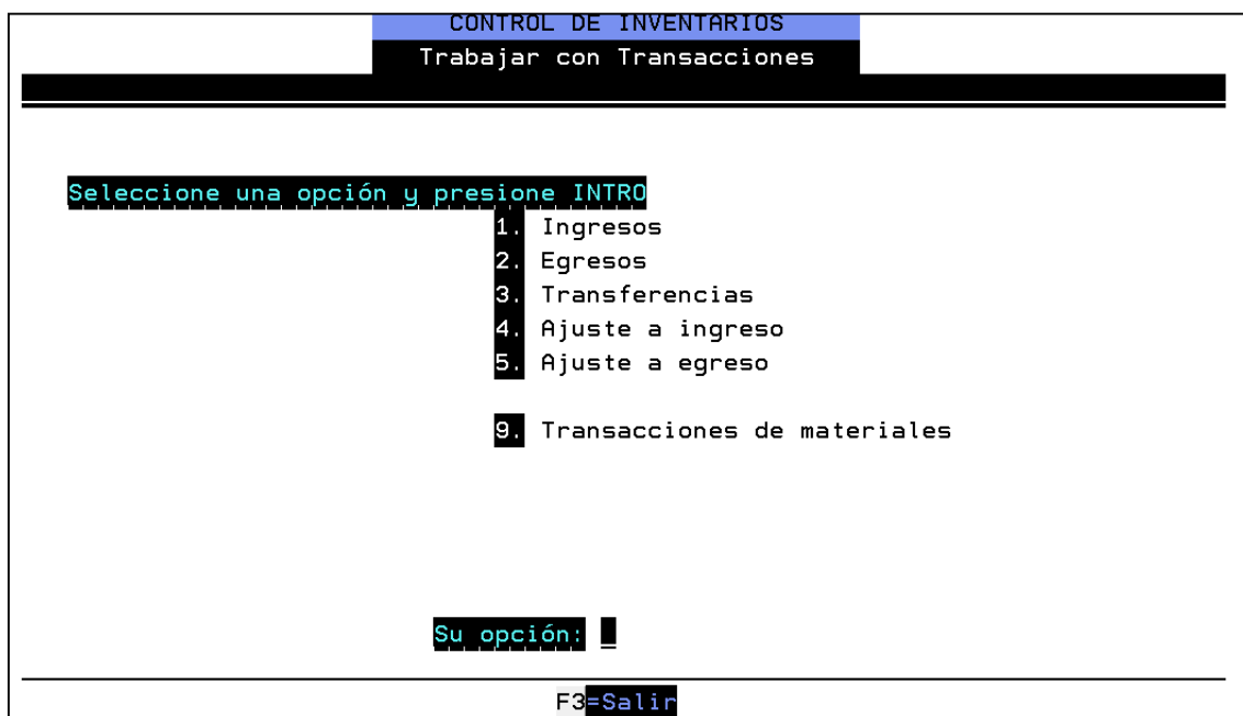
Figura 2.10 Trabajar con transacciones – Control de Inventarios

A continuación detallamos los pasos que se siguieron para realizar los ajustes tanto de ingreso como de egreso en la Bodega General de aquellos medicamentos que hay que modificar por duplicidad de códigos y que presentaban saldos en las Bodegas y Ventanillas de despacho.