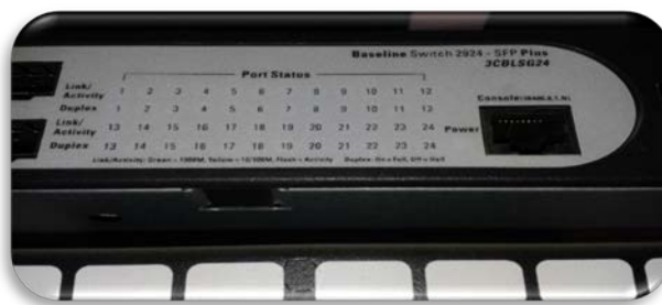
Figura 3.4: Base Switch