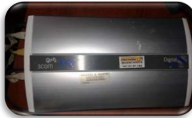
Figura 3.2: Estructura de la Red

recomendable para redes de gran tamaño. Además, un fallo en el nodo central puede dejar inoperante a toda la red.