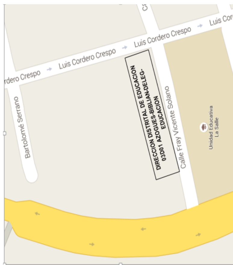
Figura 3.1: Croquis de Ubicación