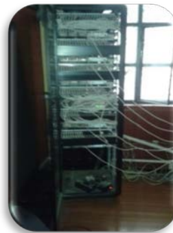
Figura 3.3: Filtro de Control

3 COM X5 Digital vaccine.- Proporciona un filtro de control de ataques., de vulnerabilidades, protocolos, anomalías de tráfico y permite configurar puertos, enlaces y direcciones no deseados. Una de las desventajas es que su actualización dura solo un año en cuanto a las vulnerabilidades.