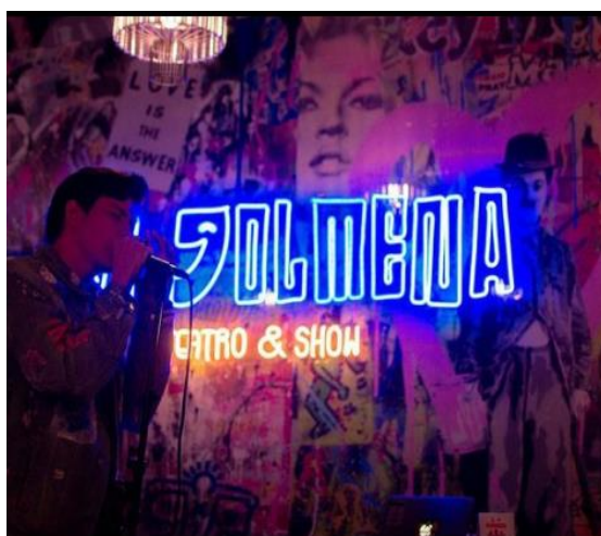
2 Teatro Show La colmena