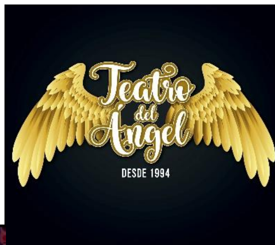
1 Teatro del Ángel