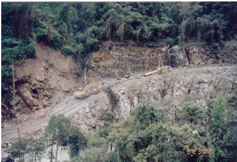
Deslizamiento de suelos en el sector de Quijos