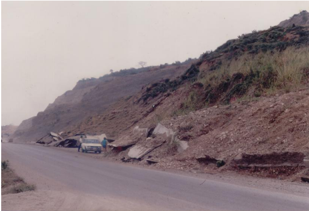
Deslizamiento RioCentro año 1989