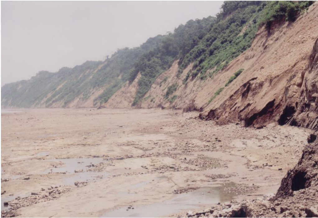
Erosión del perfil litoral en el sector de Esmeraldas y deslizamientos