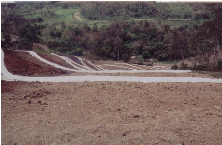
Obras geotécnicas para control de erosión en suelos de Esmeraldas