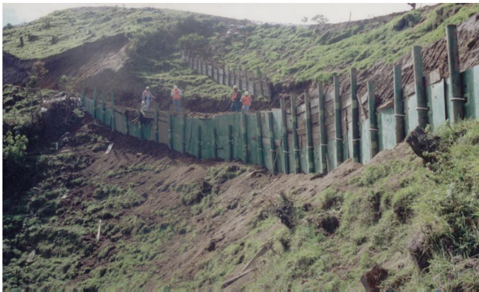
Colocación de pilotes y barreras metálicas