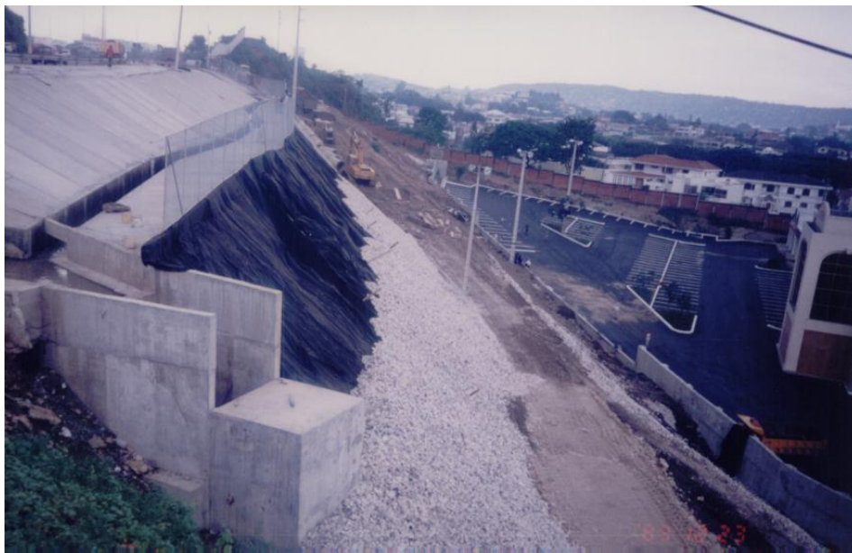
Obras geotécnicas construidas al pie del deslizamiento