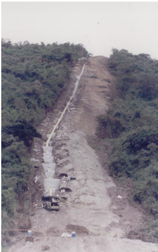
Obras de estabilización en los suelos volcánicos