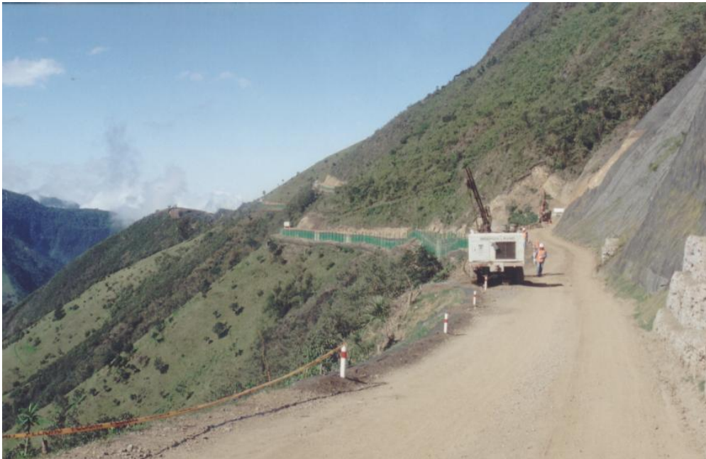
Nivelación y acabado del relleno del pavimento