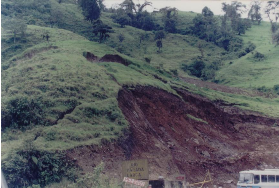
Deslizamiento de suelos en el sector Oriental