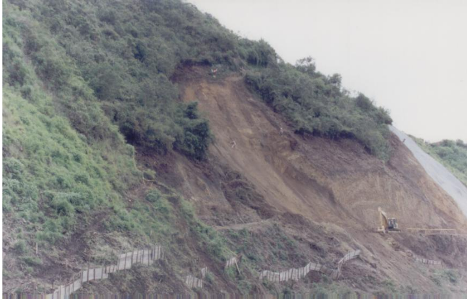
Construcción del camino de acceso – Chiquilpe