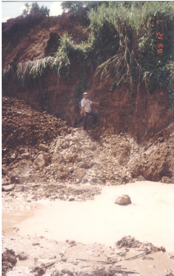
Tipo de material del deslizamiento