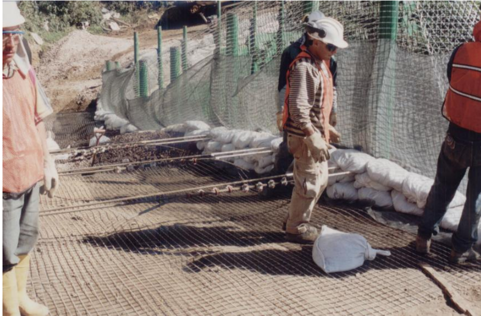
Anclaje y colocación del material de sub-base