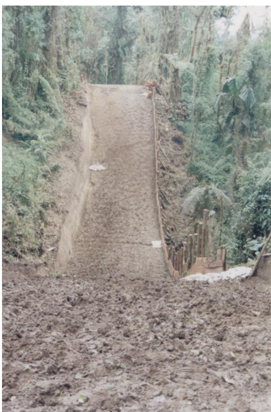
Suelos el flanco occidental de Mindo-Nambillo