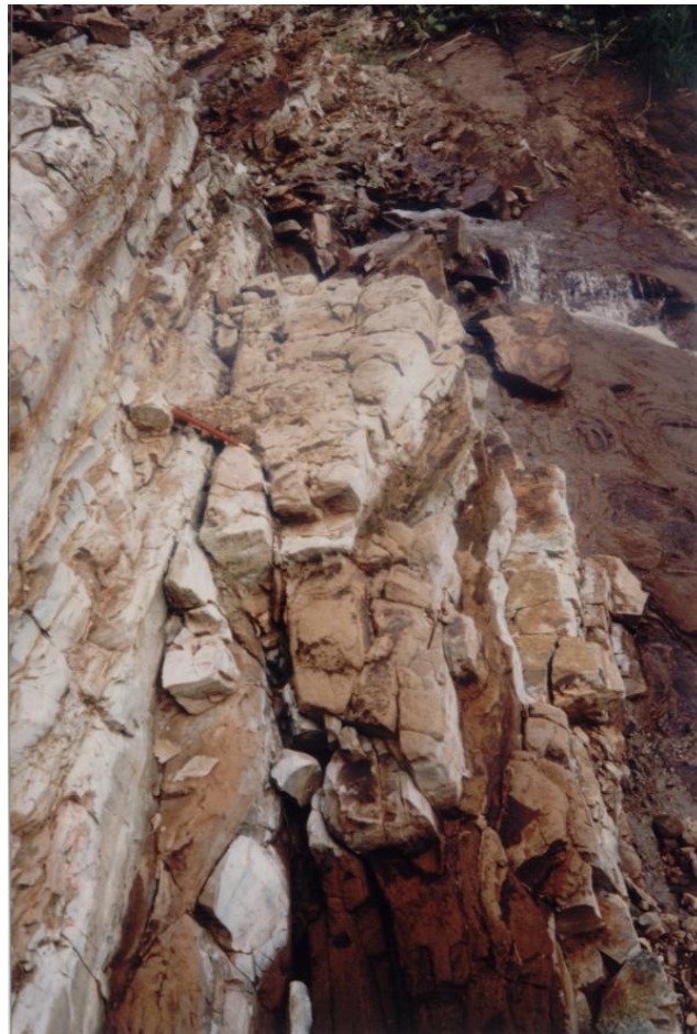
Fracturas de la roca por donde se filtra el agua lluvia