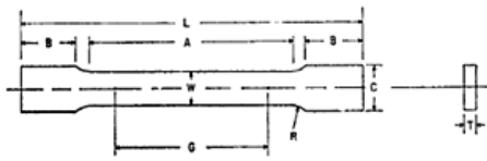
Figura 3 Probeta para tracción – material base

Las dimensiones para la mecanización de la probeta para tracción del material base están detalladas en la norma ASTM E8 (Fig. 3) 13