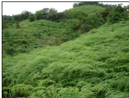
GRÁFICO 3.1 LUGAR DONDE SE LLEVO A CABO LA INVESTIGACION