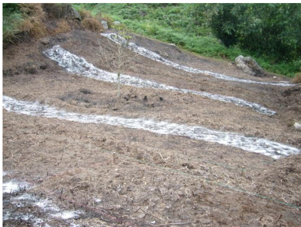
GRÁFICO 3.3 PREPARACION DEL TERRENO Y ENCALADO