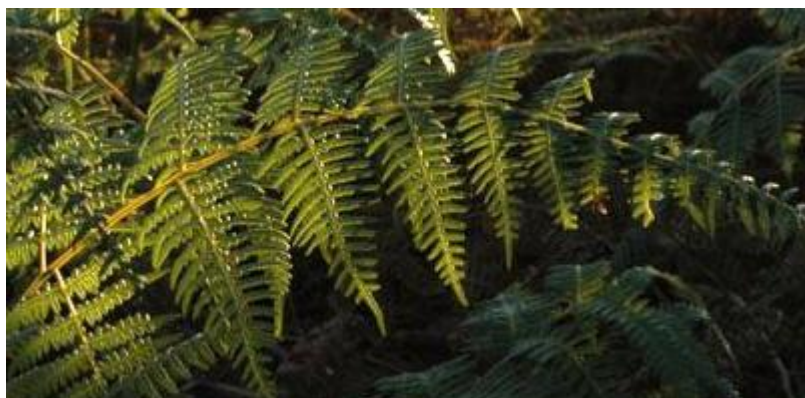
GRÁFICO 1.1 VISTA DEL Pteridium aquilinum

La facilidad con que se dispersan las esporas por el viento, su rápido establecimiento en sitios perturbados, su adaptación a diversos tipos de suelos y climas, han determinado que sea una de las plantas superiores más ampliamente distribuidas en el mundo. Por este motivo el helecho se considera una maleza seria en muchas partes del mundo.