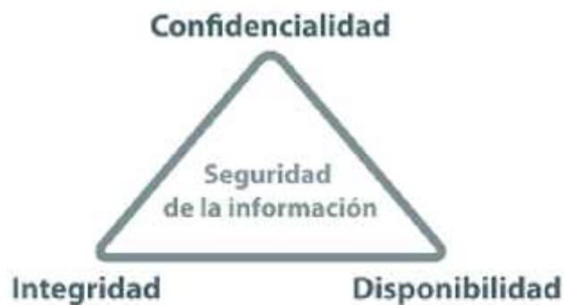
Figura 1.2 Principios básicos de la seguridad de la información