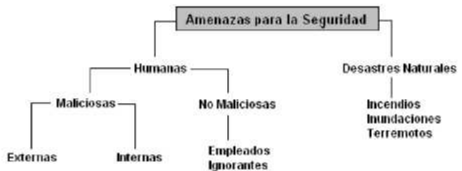
Figura 1.1 Amenazas para la seguridad

Maya y Jaramillo (2015) nos indican algo similar “ISO 17799 define la información como un activo que posee valor para la organización y requiere por tanto de una protección adecuada. El objetivo de la seguridad de la información es proteger adecuadamente este activo para asegurar la continuidad del negocio, minimizar los daños a la organización y maximizar el retorno de las inversiones y las oportunidades de negocio”. [2].